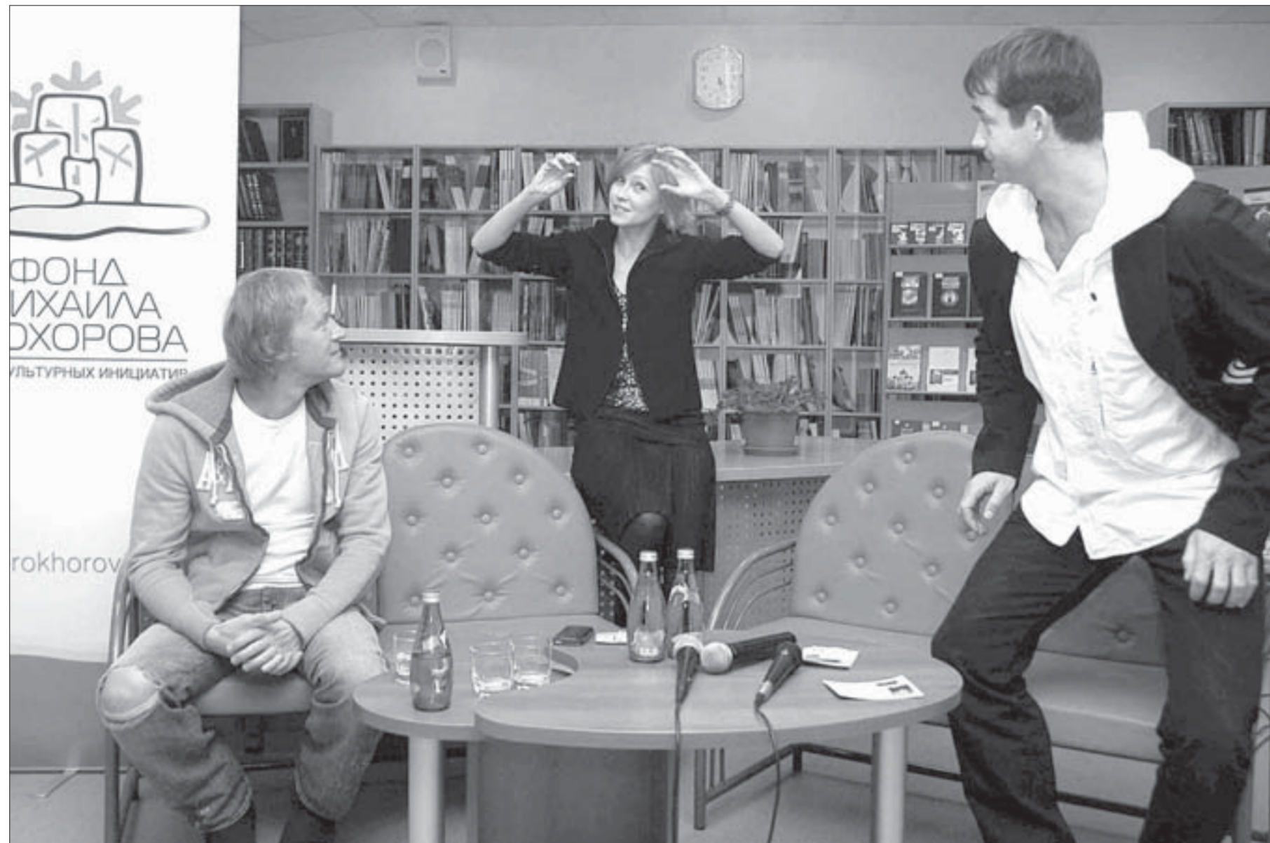
Ингеборга была самой эмоциональной

Остановки на Ленинском проспекте возвращаются на прежнее место. Сегодня в связи с окончанием строительных работ на фасадах домов переносятся две автобусные остановки на Ленинском проспекте: от Дворца культуры к кинотеатру "Родина" и от здания городского музея к ресторану "Лама".