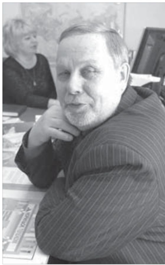
«Я коллектив свой уважаю»

В прошлом году были случаи, когда одни участники акции «Добрая елка» подарки приносили, а другие, самостоятельно признав себя малообеспеченными или попавшими в трудную жизненную ситуацию, их забирали. Не хотелось бы, чтобы из-за таких недобросовестных граждан без новогоднего сюрприза остались по-настоящему нуждающиеся в помощи малыши.