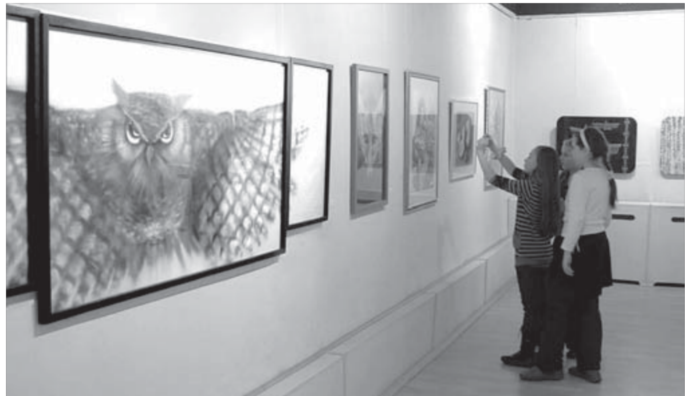
К вам летит бессонница!

В Норильской художественной галерее открылась десятая выставка-конкурс на соискание премии имени Андрея Поздеева.