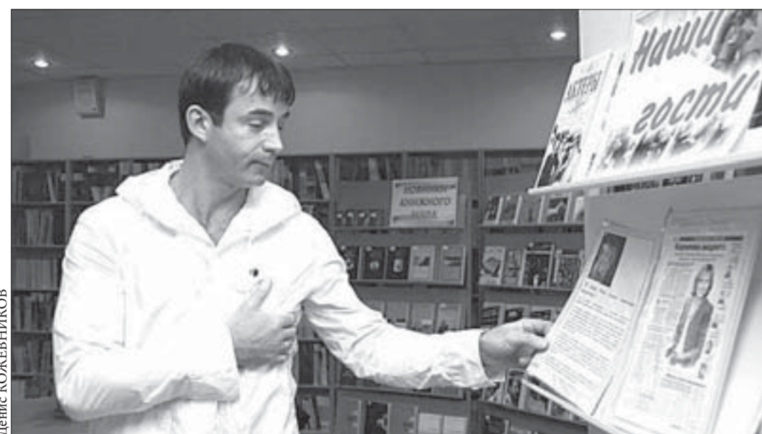
В библиотеке гости увидели статьи про себя

"В желтой прессе о нас можно узнать все, кроме правды. Поэтому предлагаю: задавайте любые вопросы, а мы на них честно ответим. Поболтаем в свое удовольствие", – предложил норильчанам актер Дмитрий Певцов. Ингеборга Дапкунайте и Алексей Серебряков своего коллегу дружно поддержали.