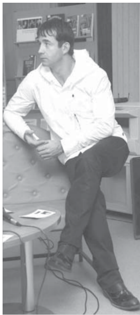
Певцов еще и певец

За последние дни сразу две страны дружелюбно распахнули двери путешественникам из России. Вначале Дмитрий Медведев заключил с президентом Бразилии соглашение об отмене визовых требований при краткосрочных (до 90 дней) поездках граждан обеих стран. А затем Госдума одобрила межправительственное соглашение об упрощенном порядке выдачи въездных виз в Норвегию. На упрощенную процедуру