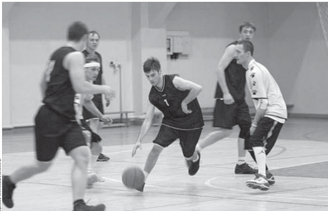
В финале очки «тяжелее»

На грядущих выходных в Доме физической культуры пройдет «Кубок четырех» — силами померяются команды, занявшие первое и второе места в своих подгруппах.