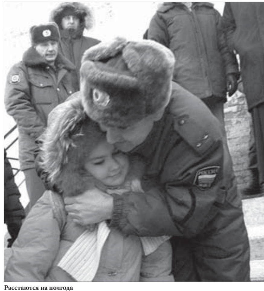
Растают на погода

Подключить услугу и выбрать нужный рейс можно будет на сайте компании в разделе «Информация о полетах» или напрямую с мобильного телефона, если известен номер рейса, сообщается агентство НИА. Услуга оповещения будет платной. Получать информацию о рейсе можно и на e-mail.