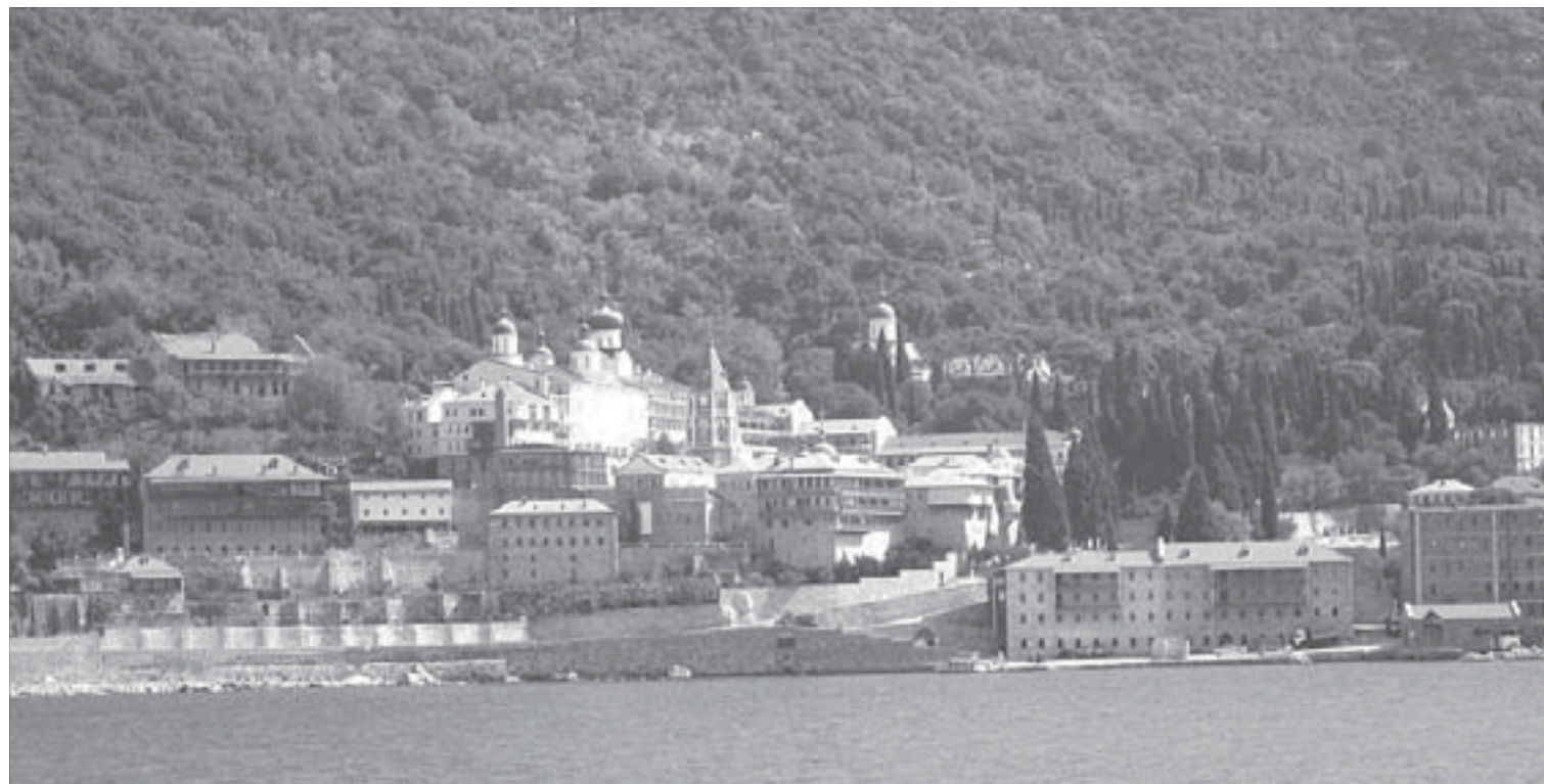
Издали видны яркие купола монастыря Святого Пантелеймона

Конечно, дня для Салоников мало. И одной поездки для Греции – тоже. Отдельно можно было бы рассказать об экскурсии на меховую фабрику. В подробностях передать впечатления от культурных встреч и вечеров. Да и о прогулках по побережью, об Эгейском море Вера Рудинская готова рассказывать и рассказывать, подкрепляя слова иллюстрациями, коих привезла из турпоездки огромное количество. Сегодня мы публикуем малую толику из того, что норильчанка прислала в редакцию “ЗВ”.