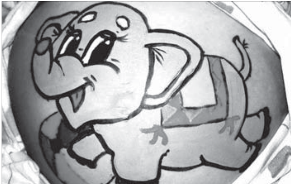
Арт-терапия: веселая картинка на животике снимает напряжение, расслабляет мышцы