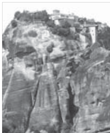
Лавра на метеоре

Дорога на Метеоры неблизкая – только в одну сторону 350 километров. Она пролегает через Центральную Грецию, места, где жили и творили Гиппократ, Эвклид и другие мыслители древних времен. Оста-