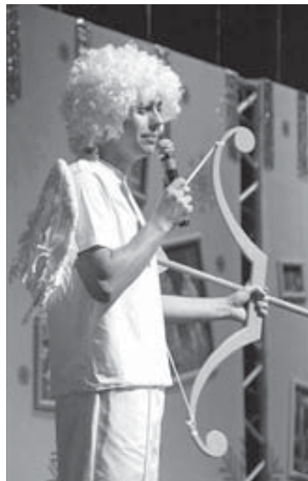
Стрелу Амура – на сцену!

С конкурса никто не ушел без призов. Так что проигравших не было. И в этом еще один секрет творческого соревнования “Мой любимый Дед Мороз”.