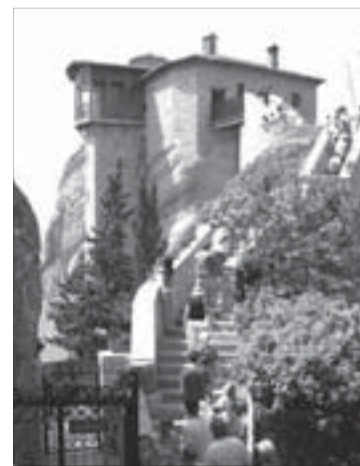
К святой Варваре идут за умиротворением