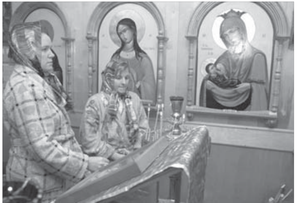
Равноапостольная княгиня Ольга поможет беременным

В кабинете у психолога мы рассматриваем альбомчик с фотографиями. Одно из заданий на курсах духовного акушерства – папа (или кто-то из родственников) должен нарисовать на большом круглом мамином животике какую-нибудь веселую картинку. Называется арт-терапия. Снимает напряжение, расслабляет мышцы. На фотографиях – животики с пчелками, вишнями, арбузом, веселым сурком, цыпленком, вылупляющимся из яйца. А один известный кавээнщик под предлогом того, что художественных талантов у него нет, набросал на животе любимой (тоже известной) жены политический плакат.