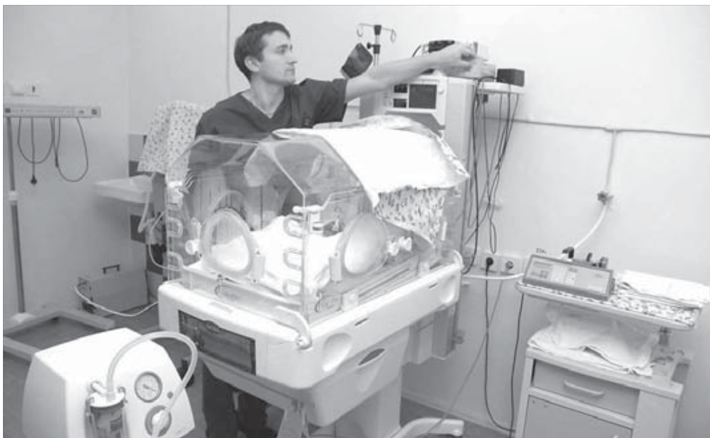
В отделении реанимации для новорожденных выхаживают недоношенных малышей

– К счастью, наши руководители понимают, что значит обеспечить безопасный лечебный процесс для матери и ребенка.