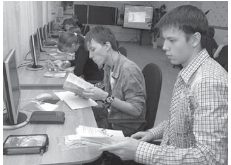
Старшешклассники предметы выбирают сами

На доске висит специальное расписание, где профильные предметы выделены разными цветами. На каждый урок старшешклассники ходят разным составом. Та-