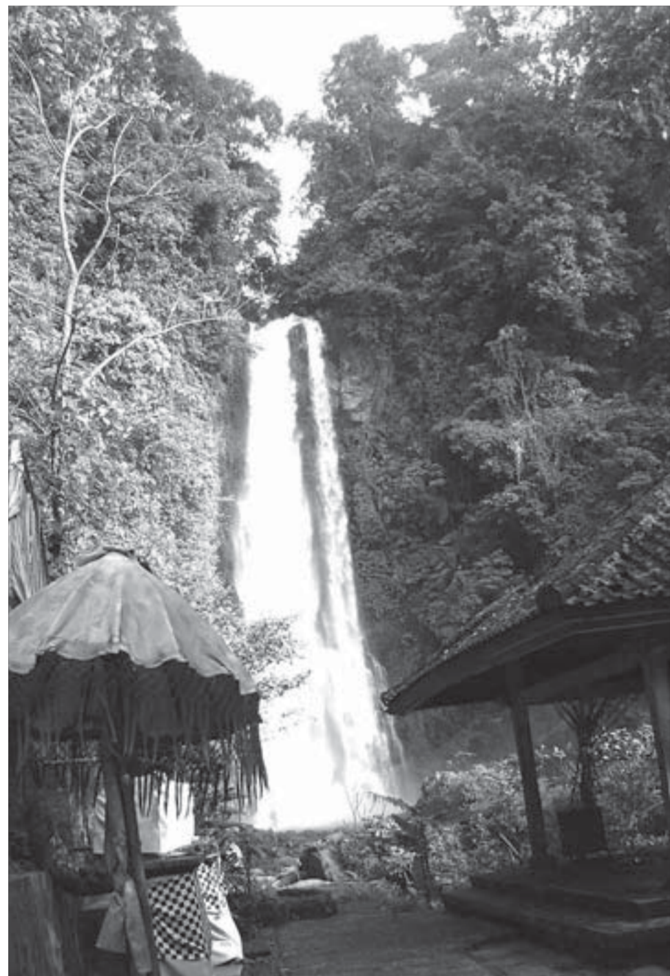
Райский отдых доступен не всем