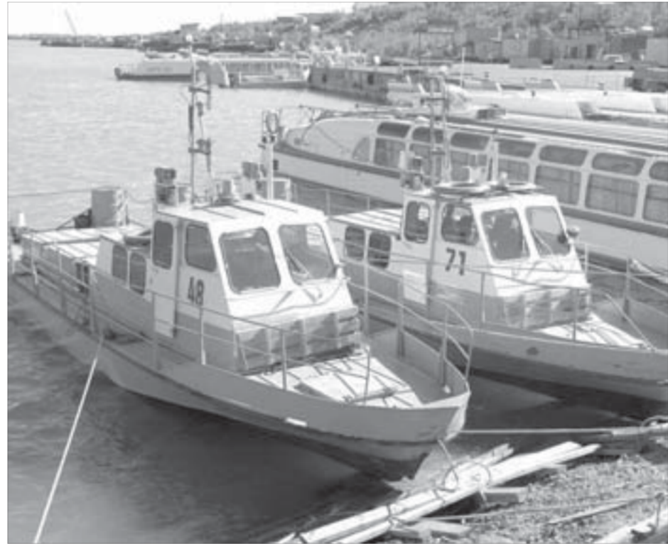
По норильским водоёмам ходят суда и с подвесными моторами, и с водометными двигателями