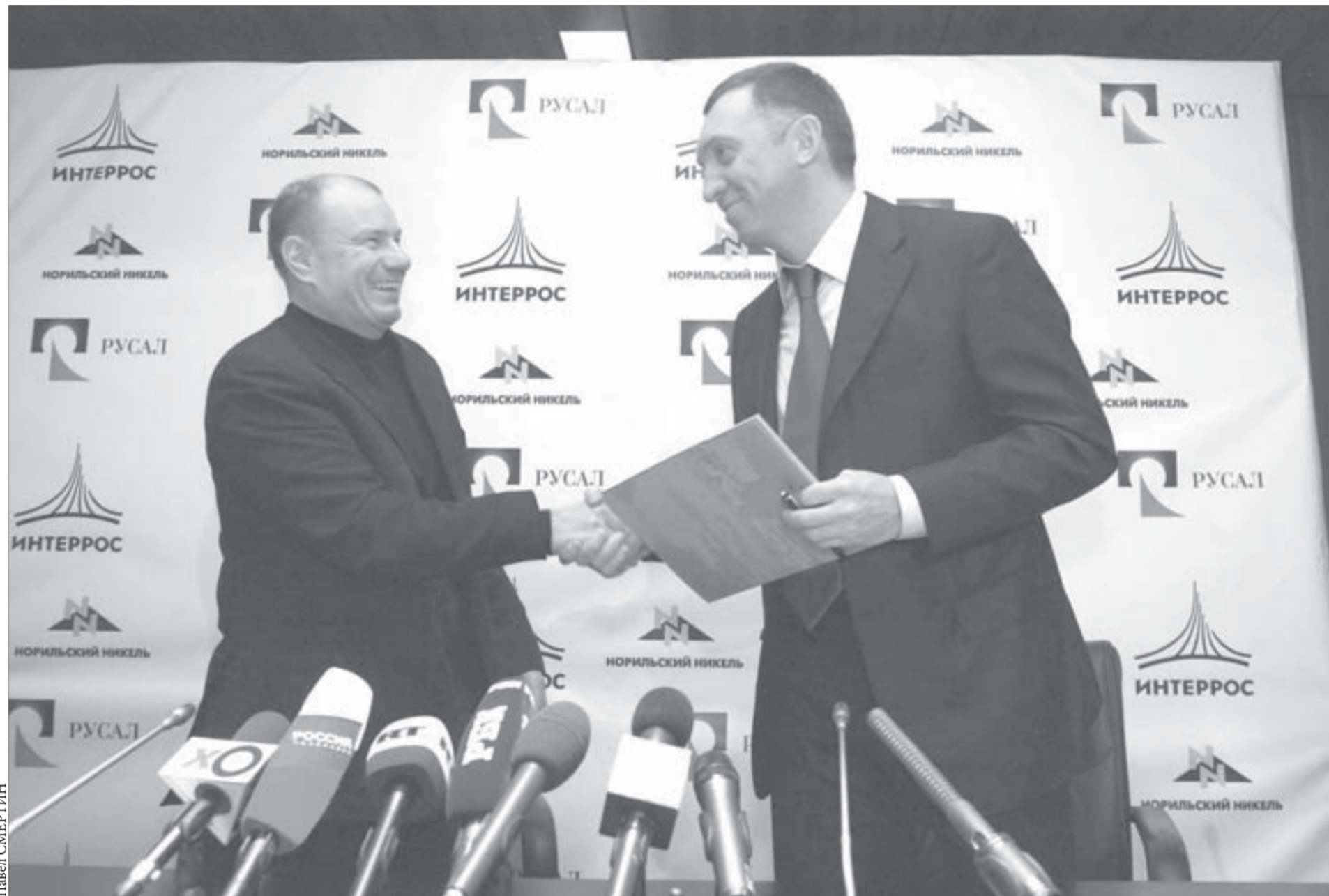
Этого рукопожатия ждали долго

В минувшие выходные в клубе Online сразились игроки Большого Норильска и Дудинки. Прошел чемпионат по Counter Strike – одной из компьютерных игр. В чемпионате участвовало 20 команд. Первое место завоевала команда Teq из Дудинки. Второй стала кайерканская North.net. Команде Ownpage из Норильска досталось третье место. Спонсором и организатором турнира выступил "Норком". Победители получили денежные призы.