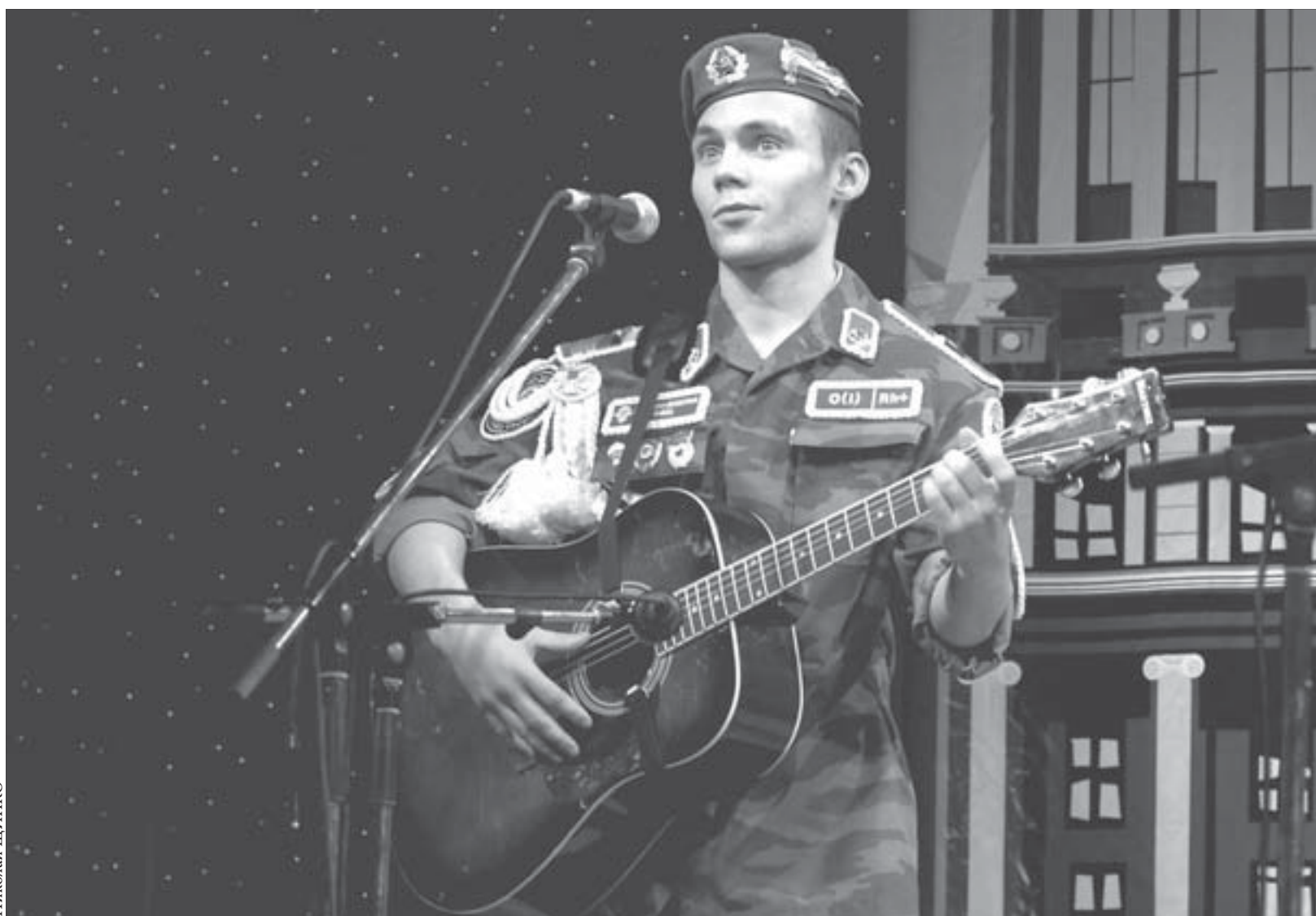
Тебе, Норильск, посвящается...

Временных ограничений по продаже алкогольной продукции на территории муниципального образования "Город Норильск" нет. Но в ноябре текущего года соответствующее предложение главы города Норильска по ограничению продажи алкогольной продукции после 23.00 направлено в Законодательное собрание Красноярского края".