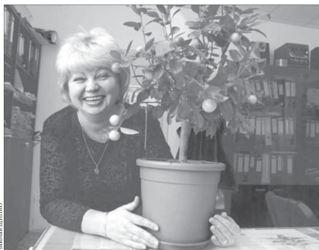
Сразу и "елка", и угощение