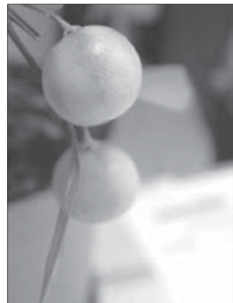
Новый год пахнет мандаринами

Кстати, в условиях кризиса мандариновое дерево – отличное решение новогодней темы. Так сказать, два в одном: сразу и "елка", и угощение. Добавим сюда эстетическое удовольствие от созерцания и флоротерапию. Цитрусовые рекомендованы также при простуде. Универсальная вещь.