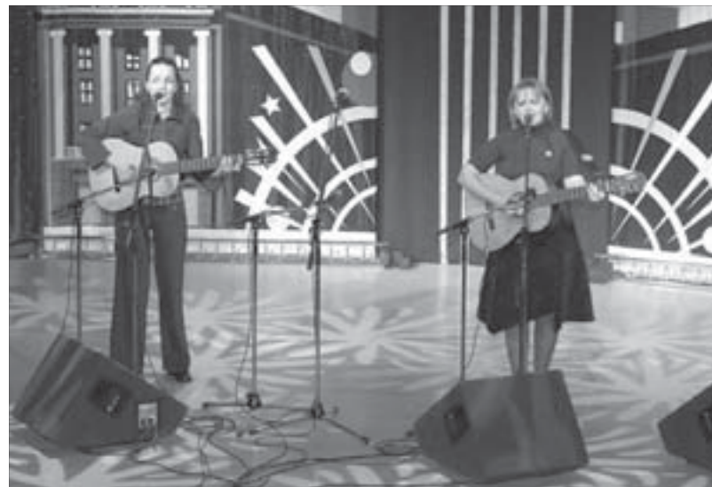
О жизни и о любви

звучали авторские выступления. Тем более что почти все участники имеют отношение к поэзии. У многих есть замечательные стихи. Особенно это касается молодых авторов, которым пока что не хватает дерзости пробовать свои силы на сцене. Но дебют – это уже первый шаг. А в поэзии, как бою, обратной дороги нет. Бардовская песня продолжает волновать наши души. Живая музыка, живая мысль никогда не канут в Лету. Это всегда будет с нами как чудесная и необходимая возможность отвлечься от своих будничных забот и пережить, как свою, чужую жизнь.