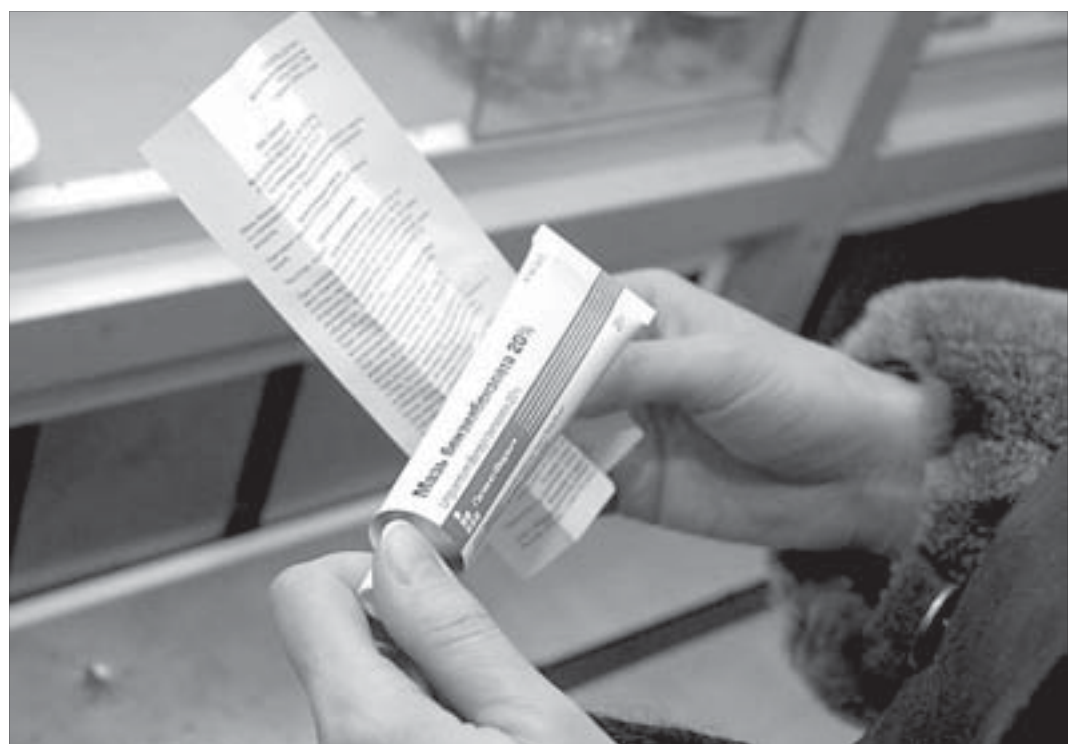
Вместо керосина и бензина — мазь бензилбензоата