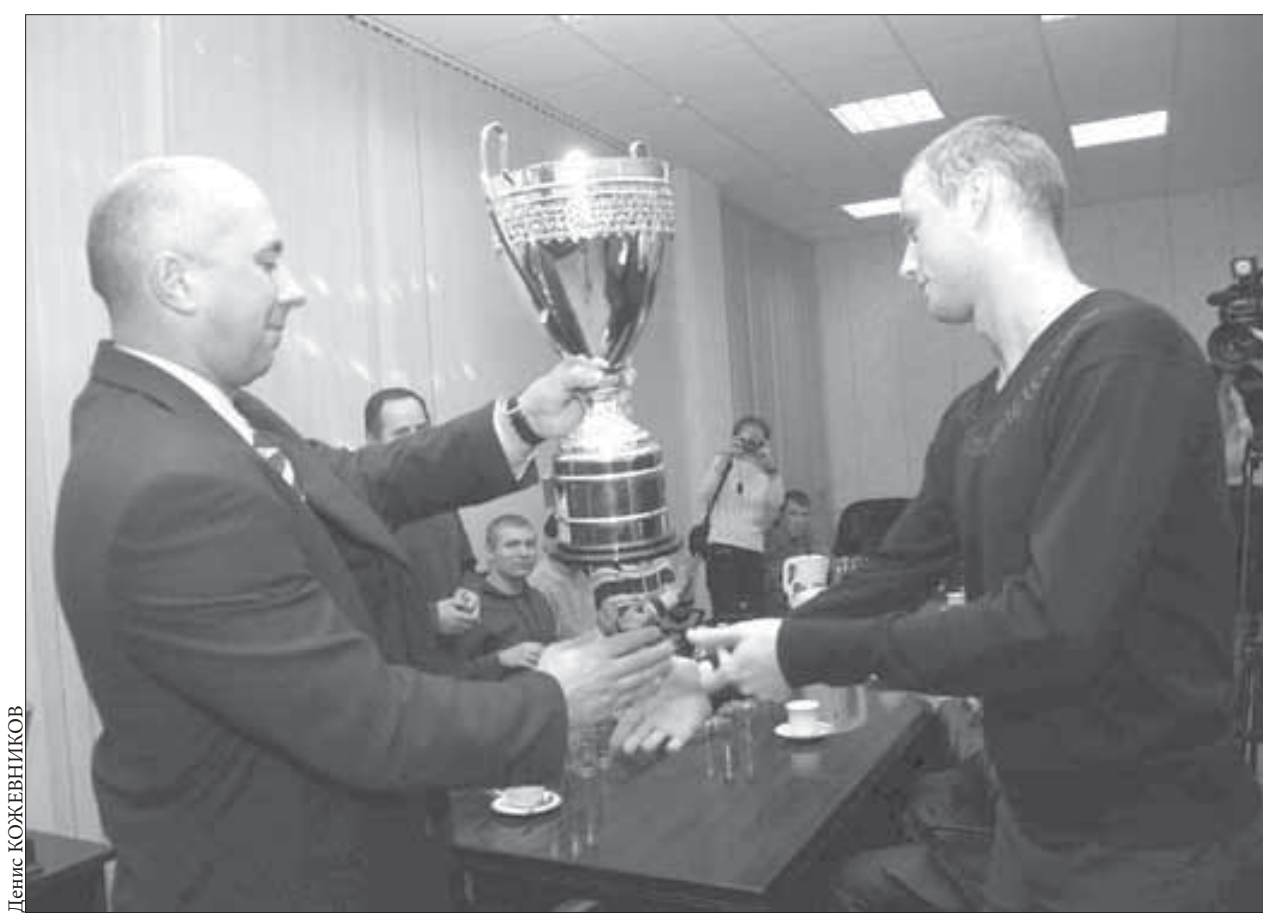
Переходящий кубок пропишется на медном

Краевой центр будет присылать свои лучшие работы в Норильск, тем более что творчество красноярской летней медиашколы “Твори-Гора” получило высокую оценку завершившегося фестиваля.