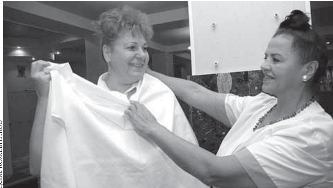
Вот так, с улыбкой, встречают в "Лагуне" посетителей

Дежурные есть не только на производственных предприятиях. Если вы ратуете за здоровый образ жизни и хотя бы раз в неделю предпочитаете попариться в "Лагуне", то наверняка знаете, что банщиц называют именно так – дежурная по отделению. Причем профессия эта и раньше была престижна не только у норильских завсегдатаев бани, а теперь и вовсе вышла на первое место. Вместе с предприятием, признанным лучшим в Красноярском крае в номинации "Бытовые услуги и оздоровительная деятельность" по итогам недавно прошедшего VII Сибирского форума деловых услуг "Предпринимательство Сибири. Договор-2008".