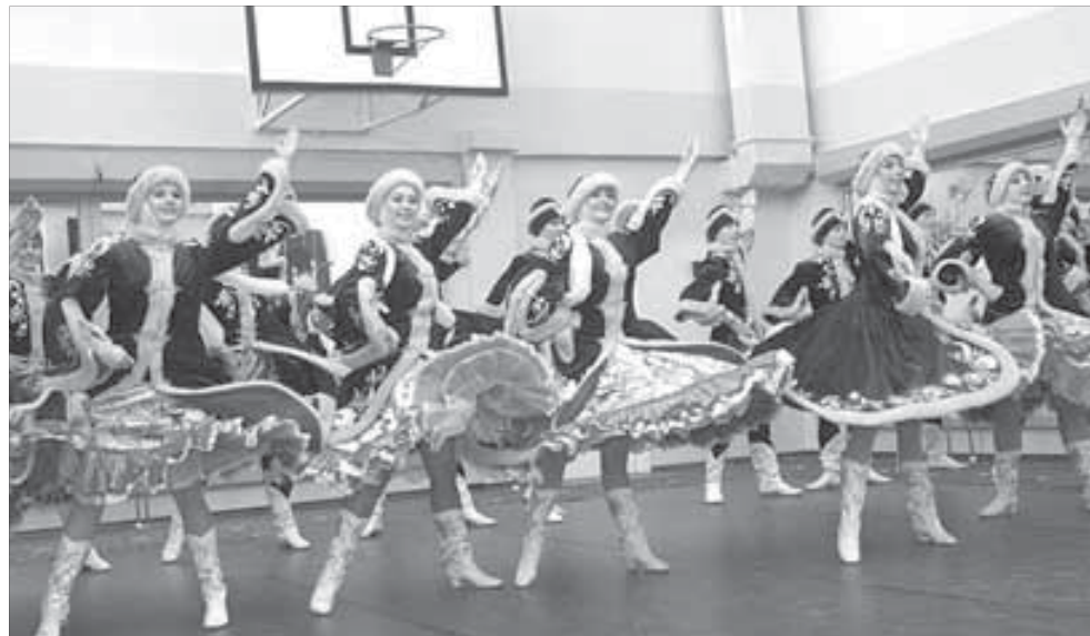
Норильскую красоту президент оценил