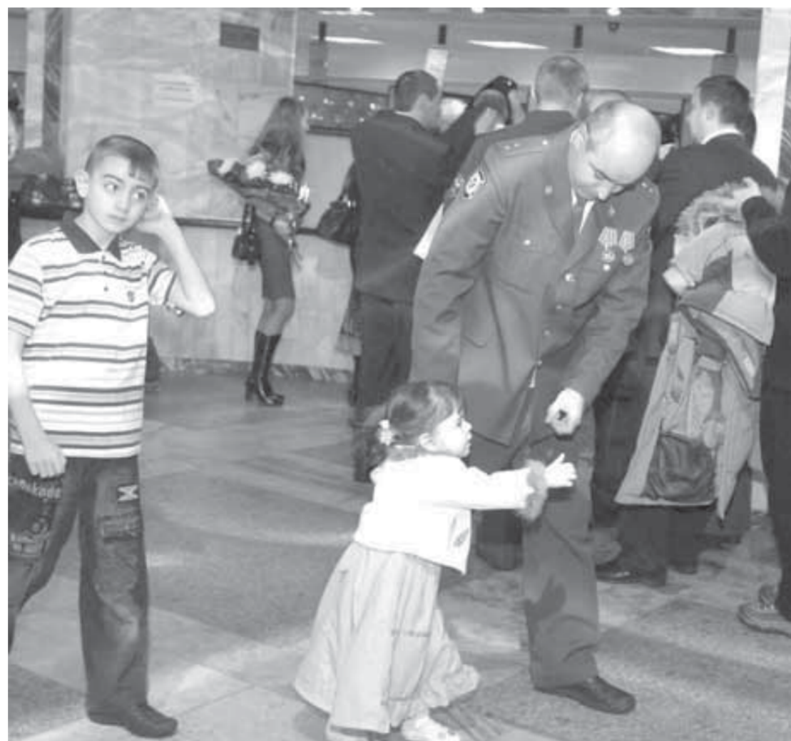
...для малышей – гордость за пап