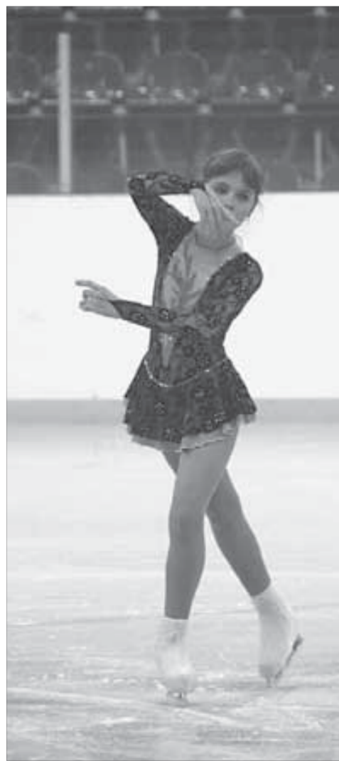
Начало выступления: главное – не волноваться

Именно эти ребята буквально через месяц будут отстаивать честь Норильска на чемпионате края и зональном первенстве. Как сообщили тренеры и члены жюри, везд ребят, занявших первые места, – вопрос решенный. О полномочии делегации серебряными призерами нынешнего состязания еще предстоит подумать. На представительность нашей делегации и судьбу северного спорта могут повлиять кризис и... цены на авиабилеты.