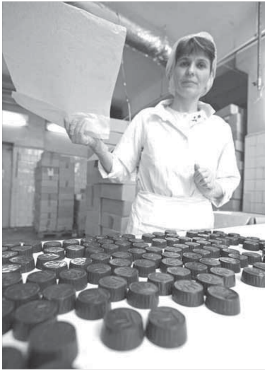
Сладости так и просятся в рот

Но самое интересное в этом процессе – смотреть на лицо фотокамера, по глазам которого видно, как он хочет схватить свежую шоколадку с ленты и съесть, чтобы никто не заметил. Признаться, и я думал об этом, но держал себя в руках до последнего. Все-таки главным было узнать, что интересного заготовили кондитеры детям "Норильского никеля" на Новый год.