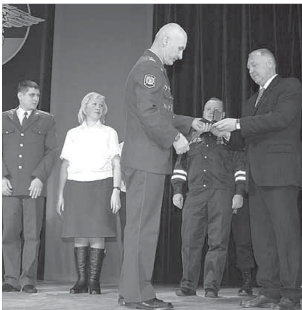
Вручение знака отличия "За профессиональное мастерство"