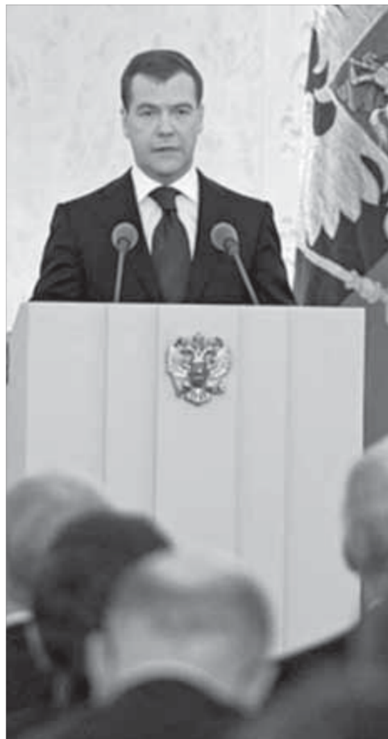
Политические свободы граждан неприкосновенны

Президент заявил, что считает необходимым оптимизировать организацию миграционных процессов внутри страны и создать реальные условия для повышения мобильности российских граждан как эффективного способа перераспределения трудовых ресурсов и обеспечения права граждан на труд. Медведев напомнил, что в Россию по-прежнему продолжает прибывать поток мигрантов, особенно из стран СНГ, и многие из них стремятся получить российское гражданство. “В целом это позитивный процесс, однако получение гражданства должно стать доказательством их успешной интеграции в жизнь нашего общества и восприятия его культуры и традиций”, – подчеркнул Медведев, особо отметив, что при этом необходимо сохранять баланс на рынке труда и обеспечивать интересы российских граждан.