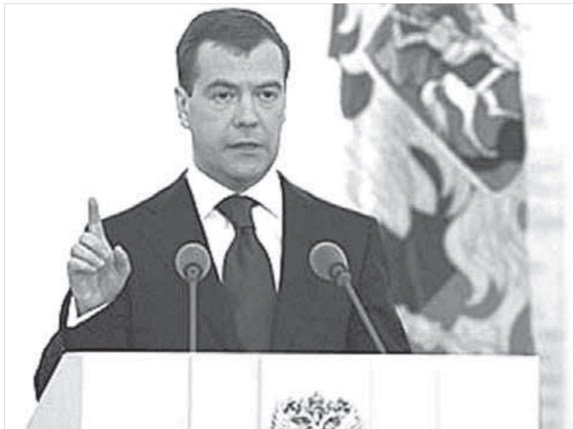
Мы сделаем все, чтобы мир стал более безопасным