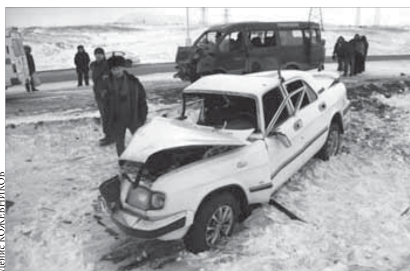
Кто виноват, покажет расследование