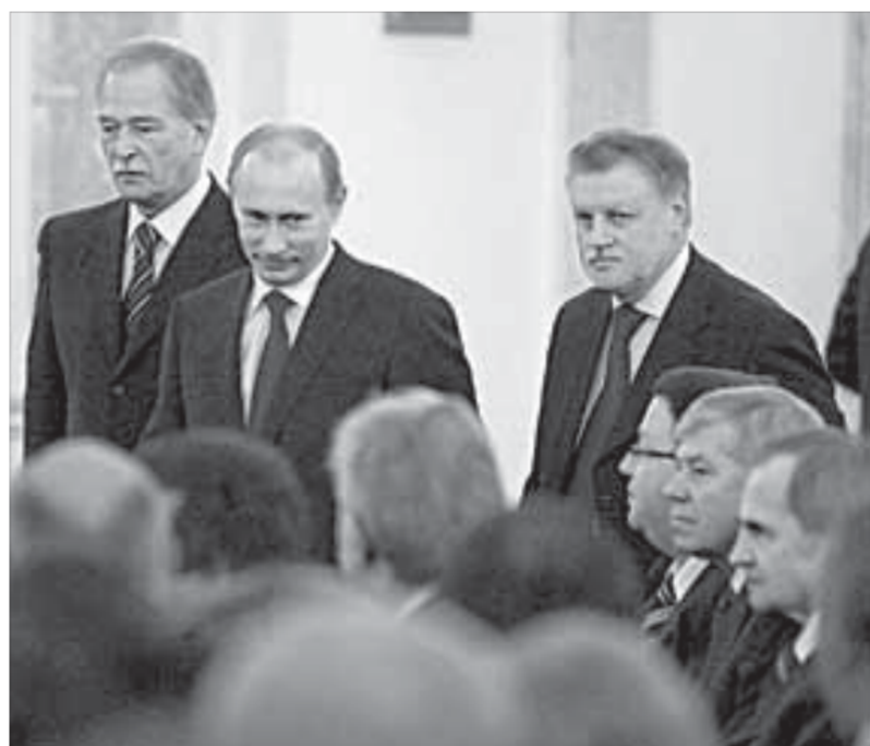
На выступлении присутствовала вся элита страны