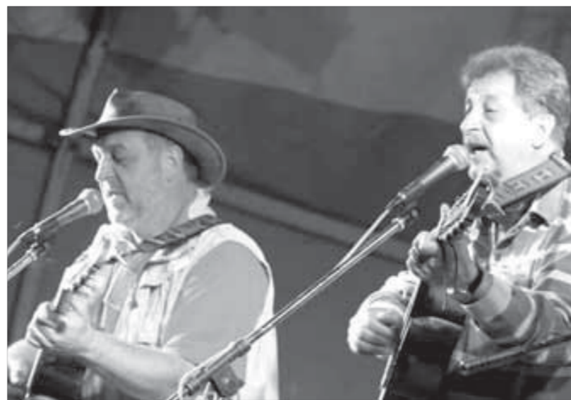
Мишуки вновь на сцене ГЦК

Билеты продаются в кассе Городского центра культуры: Норильск, Орджоникидзе, 15.