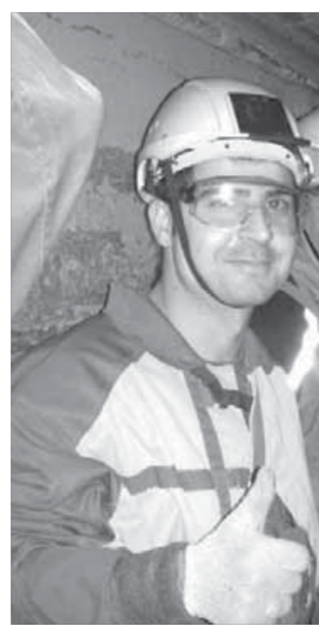
Вандер Кариока: "Все было о'кей!"

"Автобус" в клубах дыма трясет и заносит на поворотах. Кажется, едем уже вечность. Наконец останавливаемся.