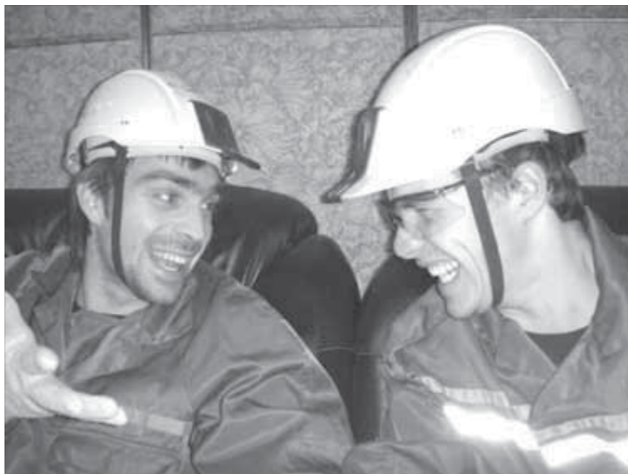
Будет что дома рассказать...

– Машина SOLA, – с гордостью показывает подземную технику главный инженер и тут же добавляет: – Близко не подходите.