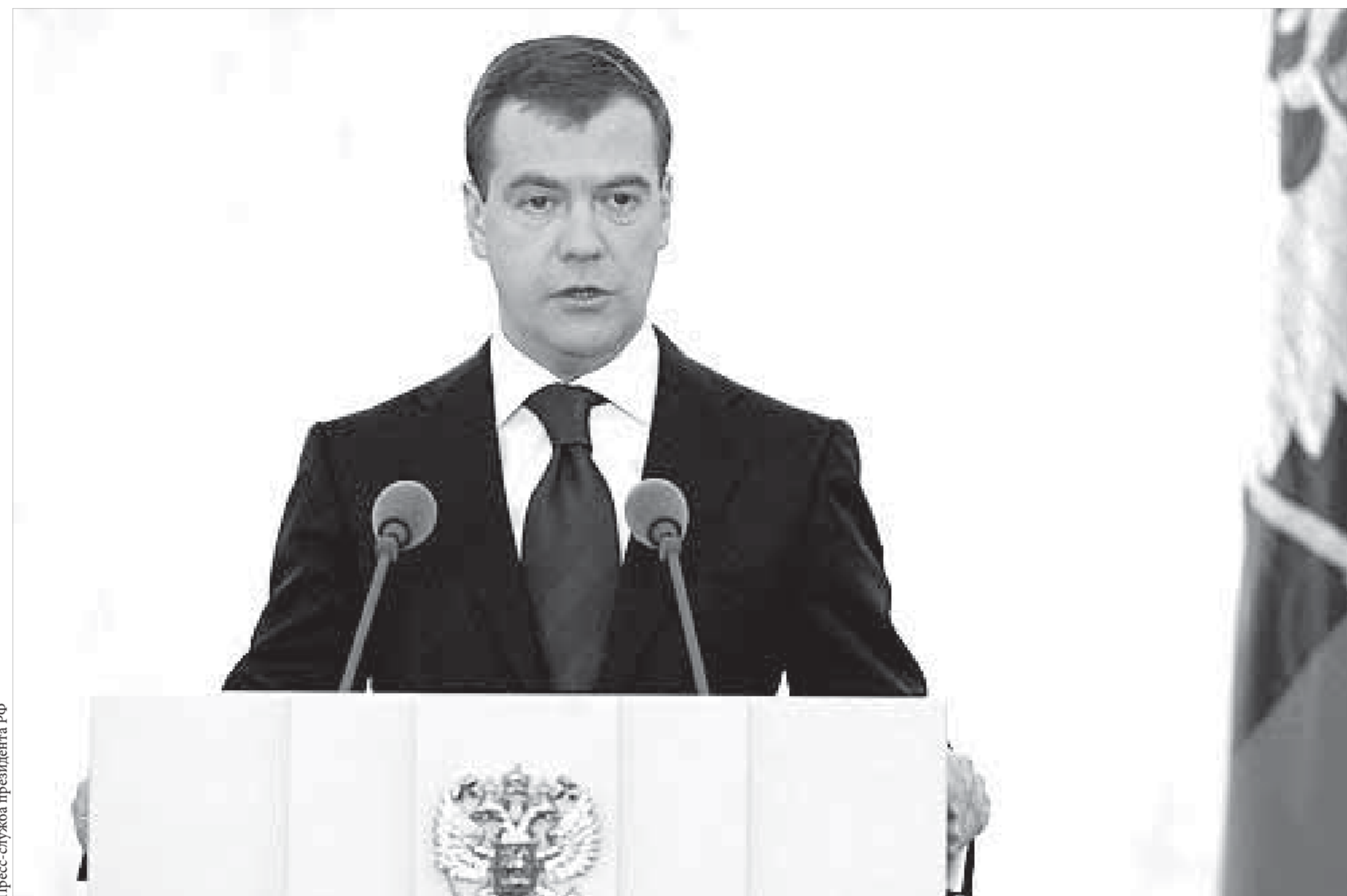
"Любое вмешательство повлечет ответные меры со стороны России"

Сегодня в Малом зале ГКК пройдет городской праздник "Осенний день призывника". Перед будущими воинами выступят представители администрации города, Заполярного филиала, церкви, председатели Комитета солдатских матерей и Союза локальных войн. Начало мероприятия в 12.00.