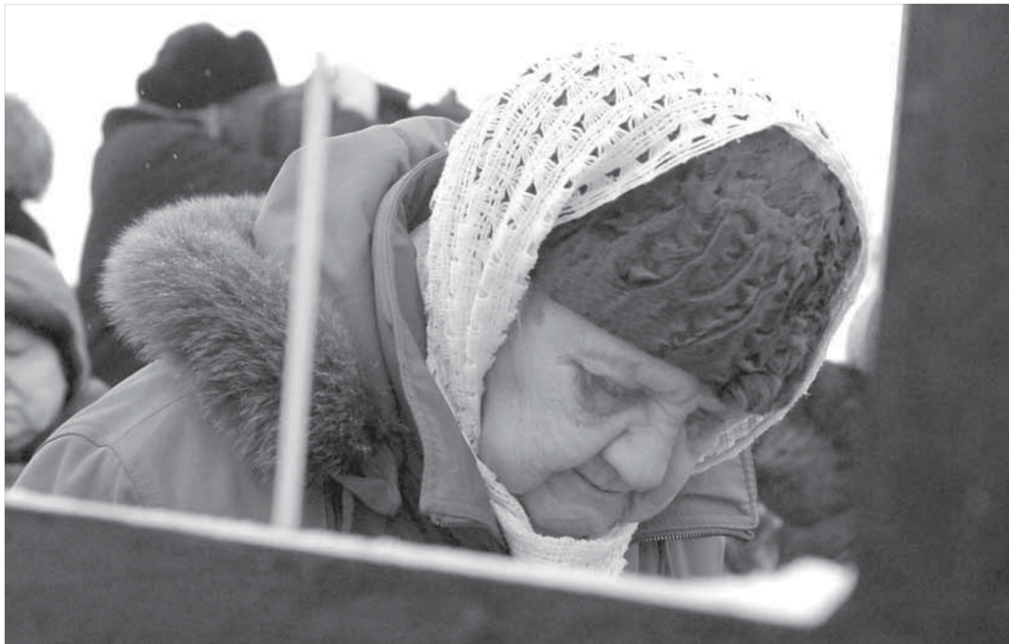
На счету ГУЛАГа миллионы искалеченных судеб