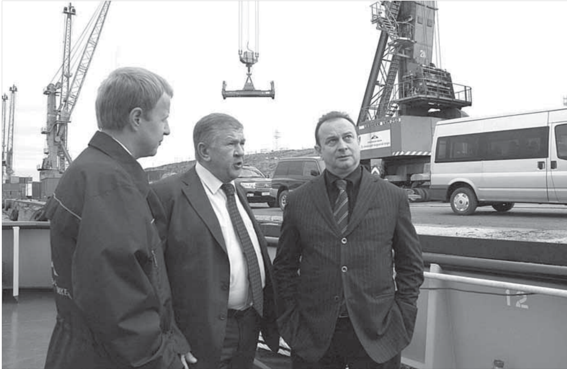
«Важно, чтобы на каждом участке работы каждый человек приносил максимальную пользу»