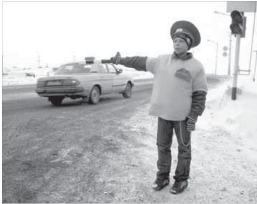
"Подрасту, стану постовым!"