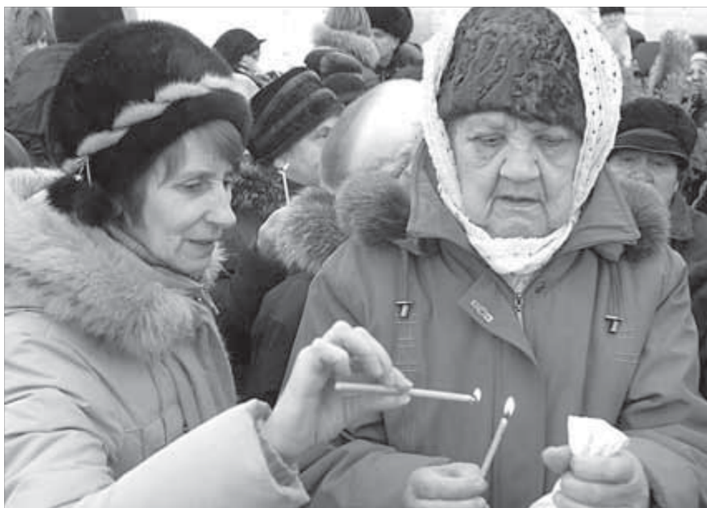
Живу и помню