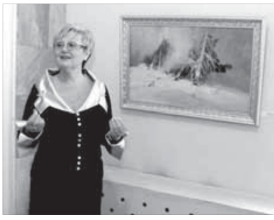
Любимая картина вдохновляет