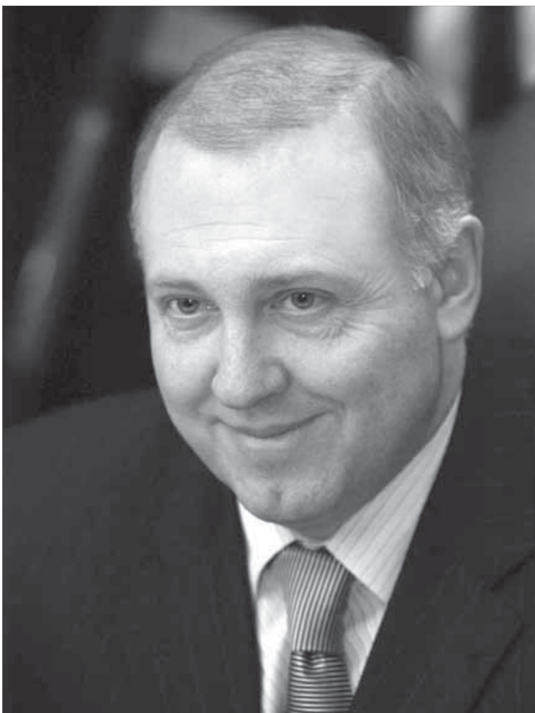
Градоначальника ждет "Признание"