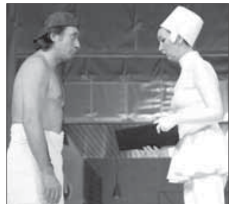
“А этот выпал из гнезда”