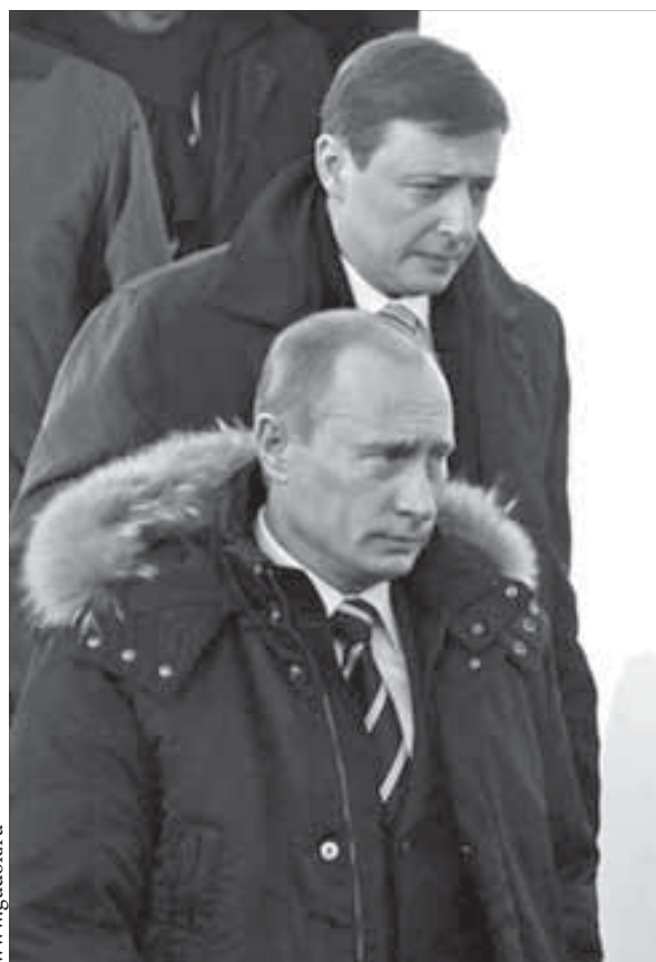
Что скажет Путин про ГЛОНАСС?

На будущей неделе Красноярск посетят сразу два важных федеральных чиновника – председатель правительства России Владимир Путин и первый вице-премьер Виктор Зубков. Первым, в понедельник, прилетает Путин.