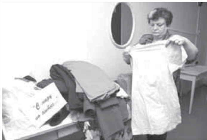
Вещи принимаются регулярно