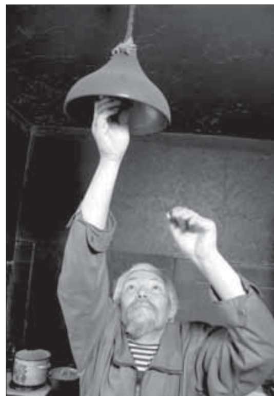
Да будет свет? Нет!