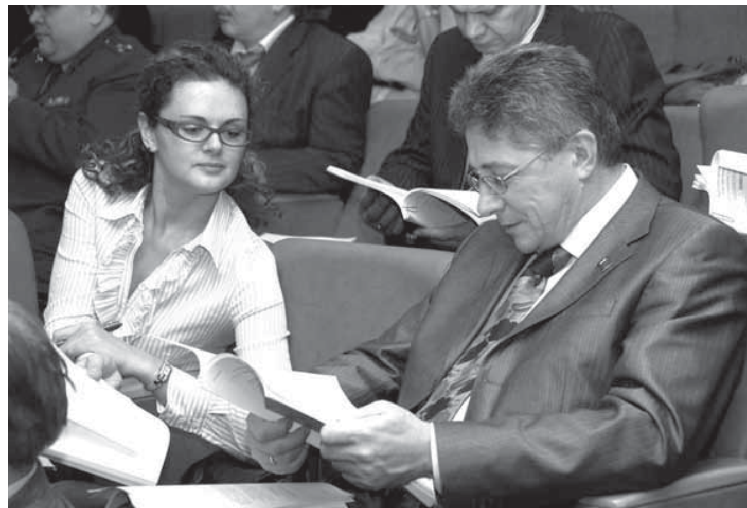
Как вам программа-максимум?