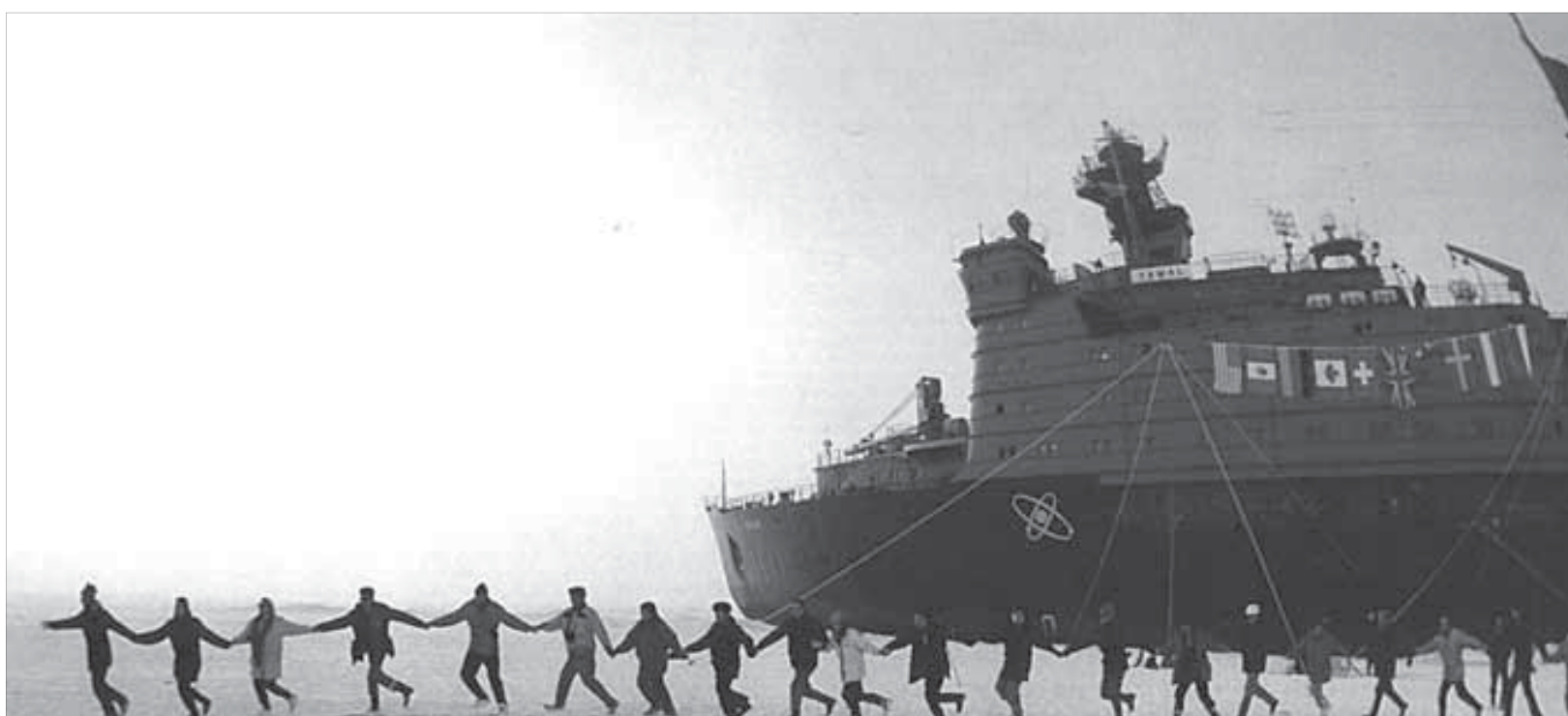
Арктика притягивает к себе людей со всего мира