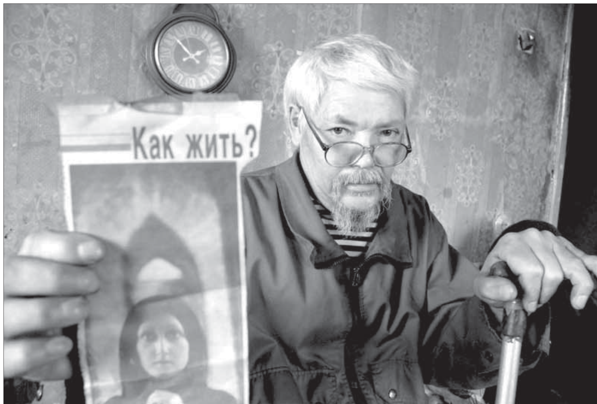
Вопрос не дает покоя

Футболисты "Норильского никеля-2" сразятся с чемпионом страны. Во втором раунде первого этапа Кубка России по мини-футболу в Глазове успешно выступила команда "Норильский никель-2". Молодежь заняла второе место и вышла в 1/8 финала. Соперником МФК в плей-офф будет чемпион России московское "Динамо". Первая игра пройдет в спорткомплексе "Кунцево" 22 октября.