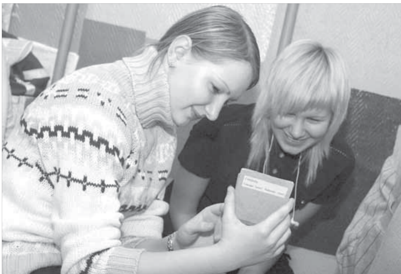
Ученики учим слова