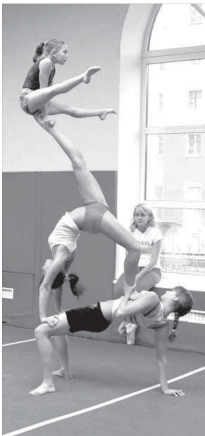
Это только разминка