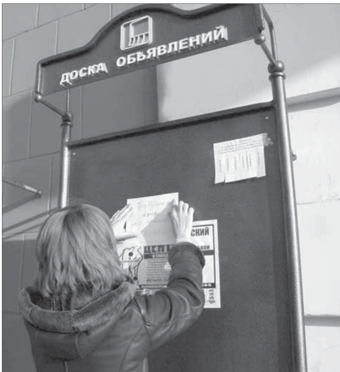
Сверху крепим скотчем, снизу - булавками