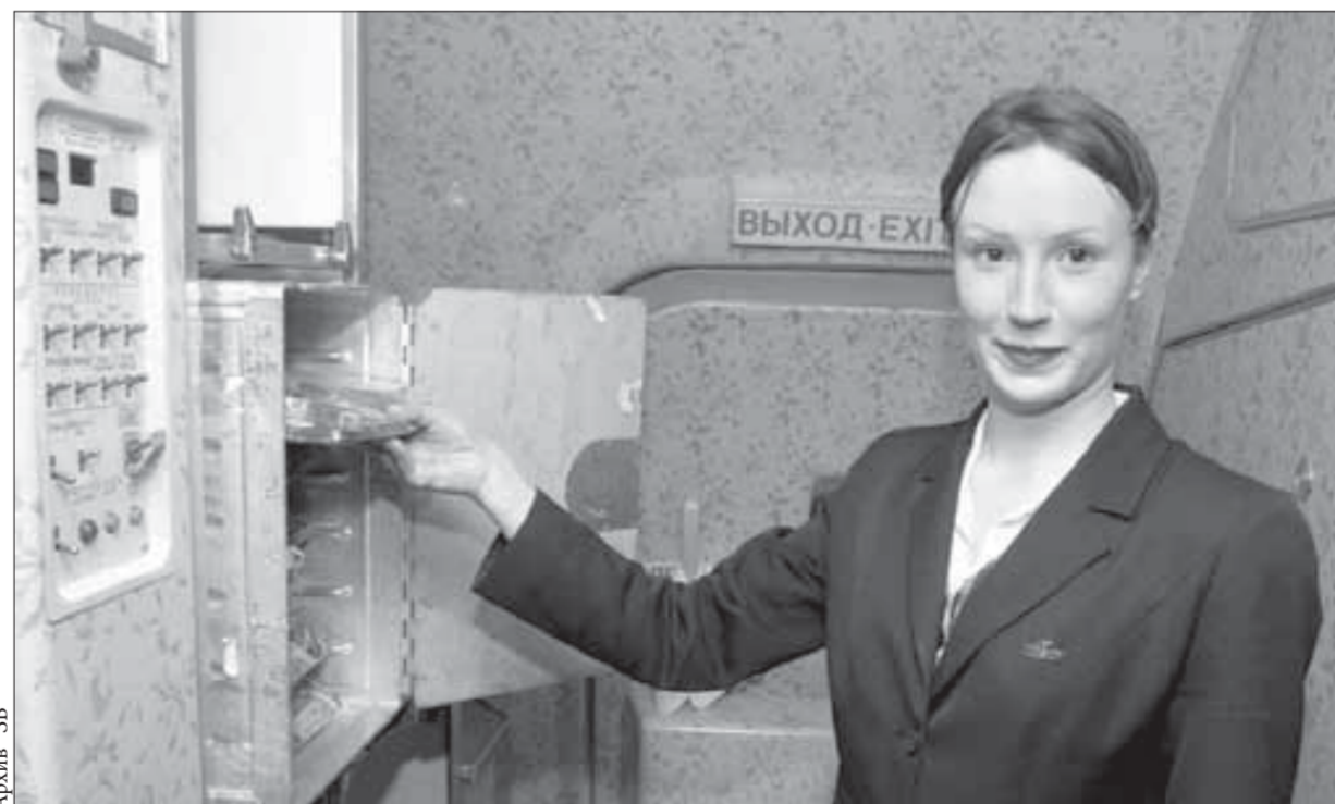
Соблюдение правил - залог здоровья пассажиров

Курс акций ОАО "ГМК "Норильский никель" - 1578 рублей. ОАО "Полюс Золото" - 468 рублей.