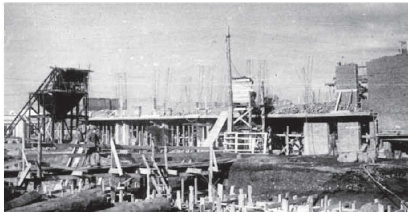
Строительство коксохимического завода (1947 год).