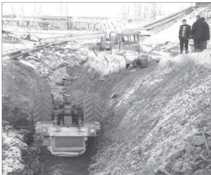
"Кировец" поднимали несколько часов

При выполнении очистительных работ в глубокий ров опрокинулся "Кировец". Машина несколько раз перевернулась и приземлилась на кабину. Машинист скончался на месте. Чтобы достать 16-тонный трактор, понадобилось обесточить ЛЭП и снять провода с двух пролетов. По предварительным данным, несчастный случай произошел из-за невнимательности машиниста: остановившись на краю обрыва, мужчина не выключил передачу скоростей, в результате чего многотонная машина тронулась с места.