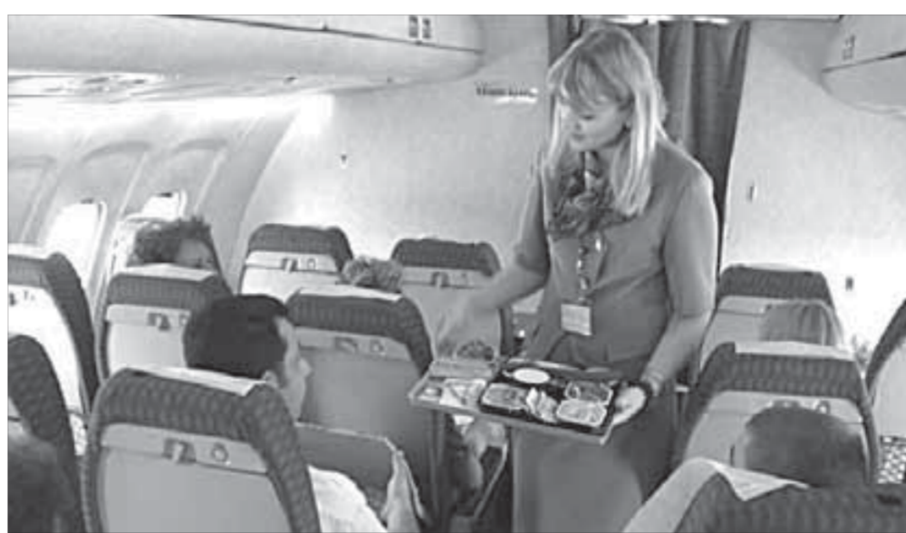
Довольные питанием есть всегда, недовольные – тоже