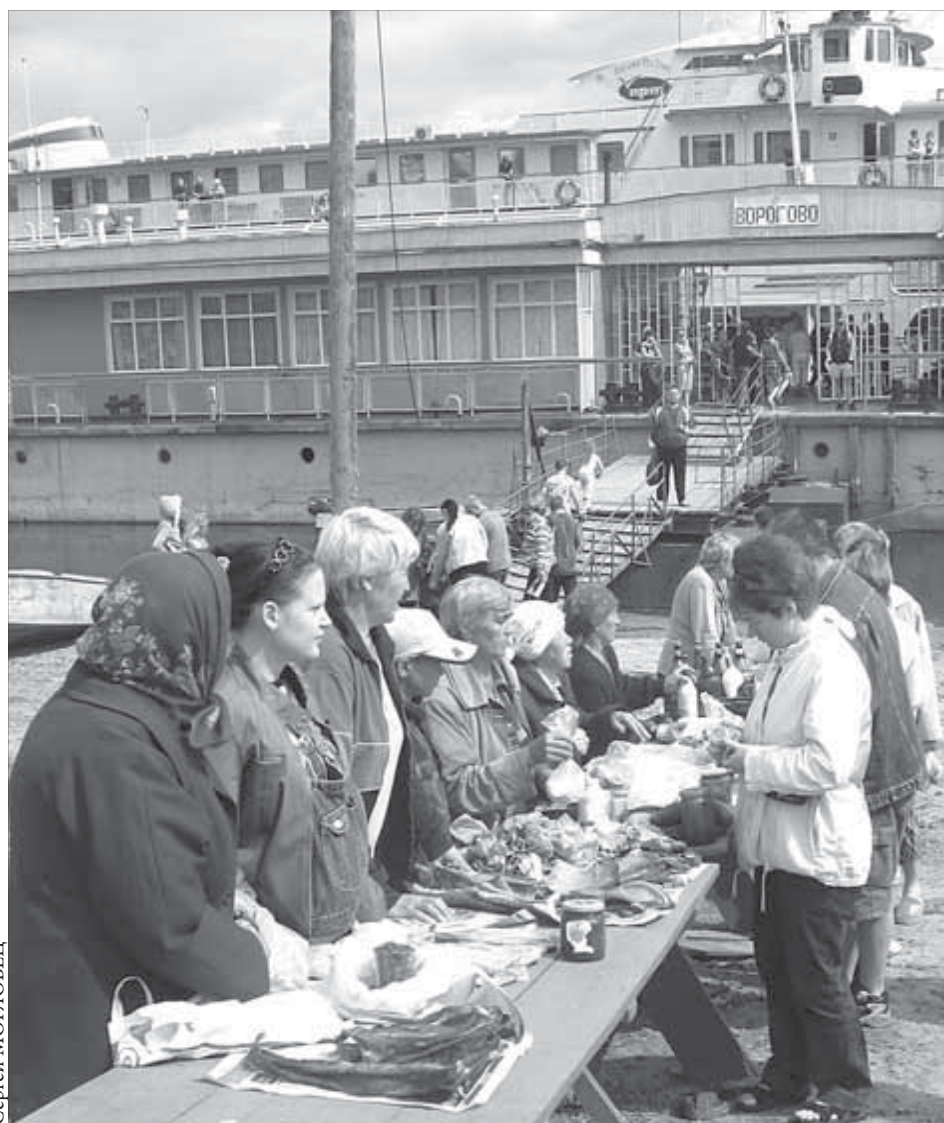
Копченую стерлядь в Ворогово продают по... 100 рублей за хвост