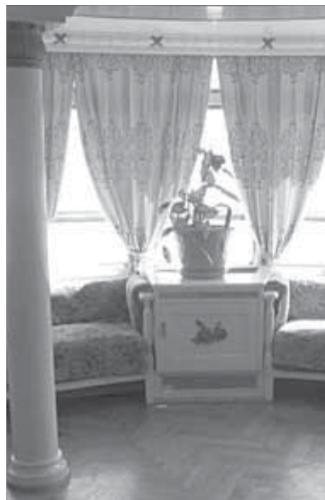
Интерьер кают-компании погружает в другую эпоху

Если норильчанин говорит: “Отдыхал на Юге” – он, как правило, имеет в виду Крым, Черноморское побережье или места еще более отдаленные – Анталию, Потайю, Хургаду. Между тем Таймыр почти как Северный полюс. Куда ни возьмешь отсюда билет, если только это не Хатанга или Диксон, обязательно попадешь на юг. Вы непременно доедете до находящегося Юга, даже если будете двигаться строго по норильскому меридиану.