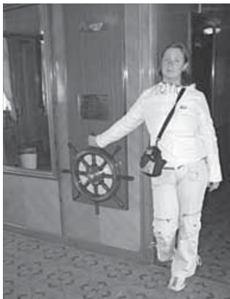
Почувствуй себя капитаном!