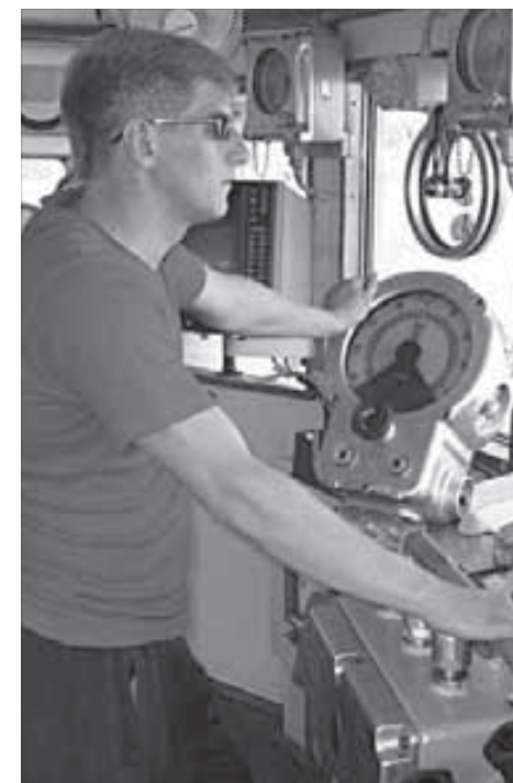
Рулевые несут вахту и днем и ночью

Почти идеальное состояние судна объясняется просто. Текучки кадров здесь нет: экипаж не меняется уже больше десяти лет. Енисейский пассажирский флот сосредоточен сейчас в поселке Подтесово и обслуживается его жителями. Весь экипаж, включая капитана, – подтесовские. Кроме флотской работы, другой в поселке нет. Люди держатся за свою работу, знают, что и на будущий сезон они выйдут на вахту именно на этом корабле.