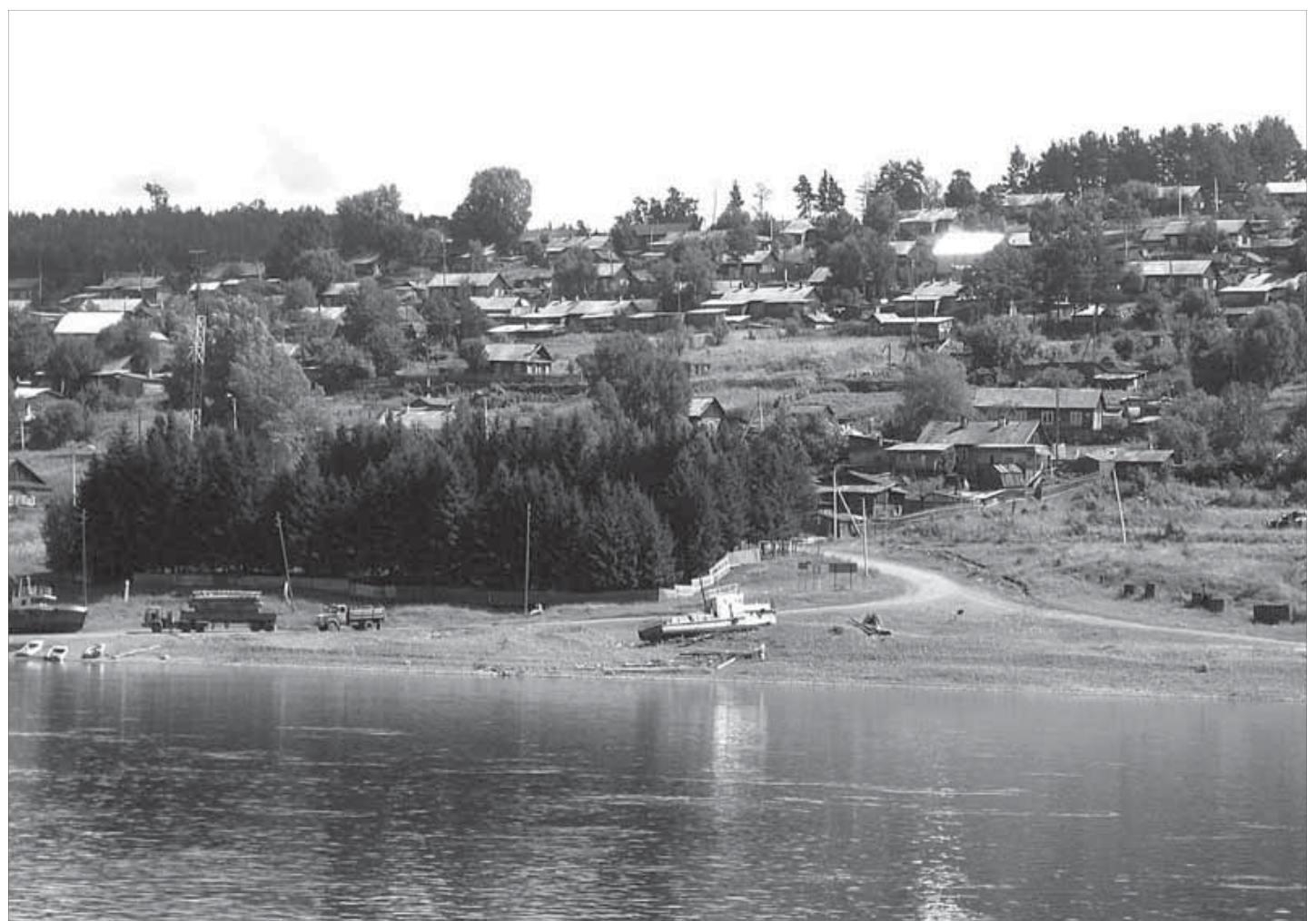
В селах на берегах Енисея неспешно течет жизнь, непонятная горожанам