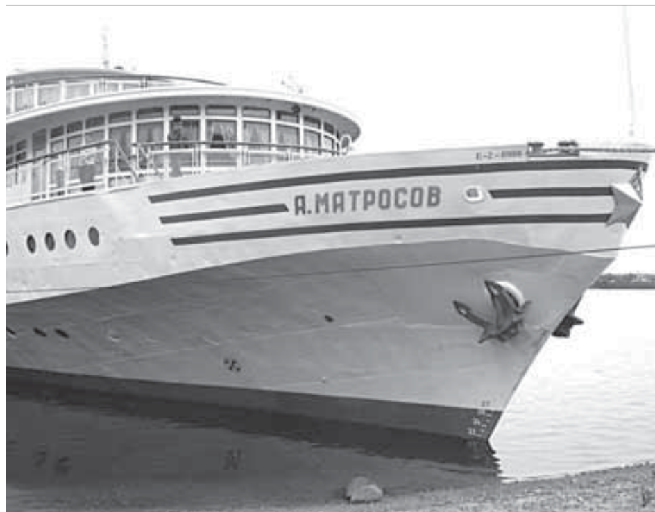
Флагман Енисейского пассажирского флота