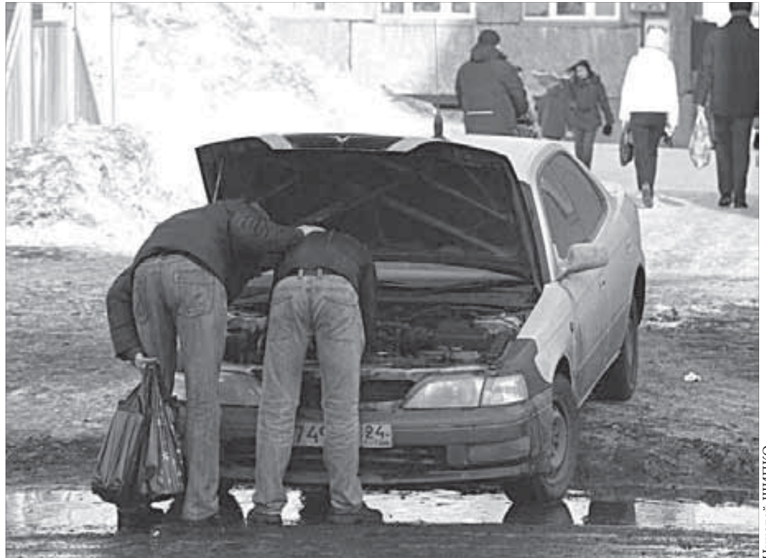
Обслужи машину в гараже – и не придется делать это на улице