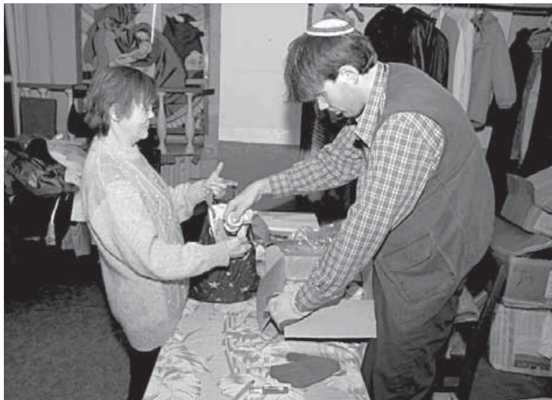
Продукты здесь раздают килограммами