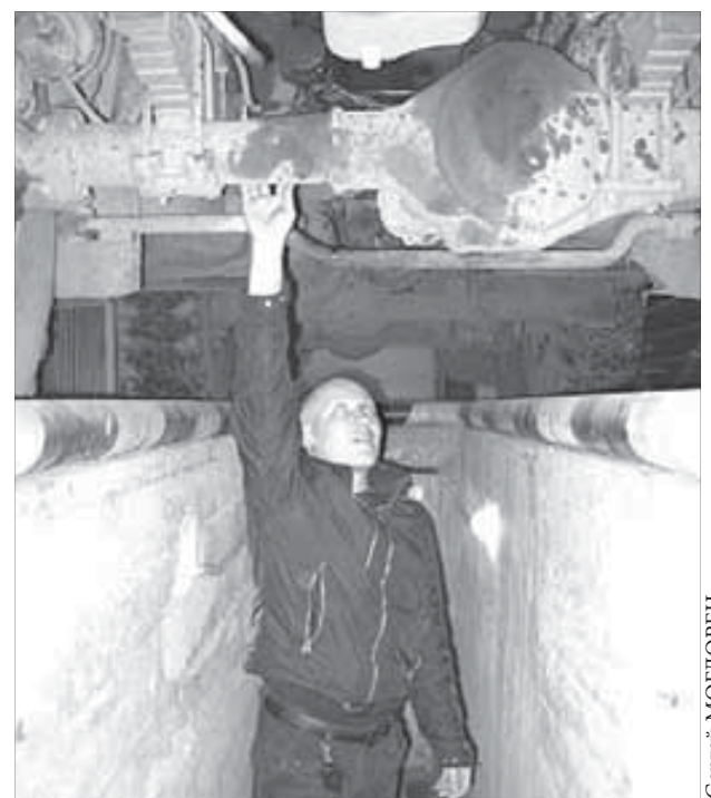
В пункте технической проверки автомобиля осматривают и сверху, и снизу