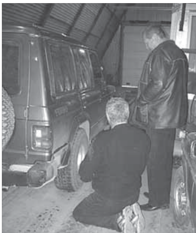
Подготовку к зиме хорошие водители ведут тщательно