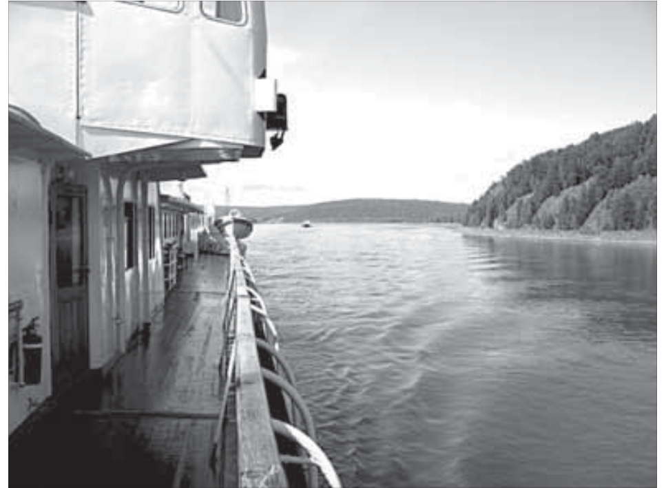
Если хочешь быть здоров, чаще смотри на бегущую воду

Рядом с пристанью села Ворогово торговлю ведут официально. Запрещен-