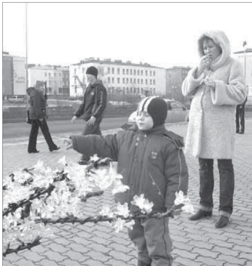
А листочки-то не настоящие...