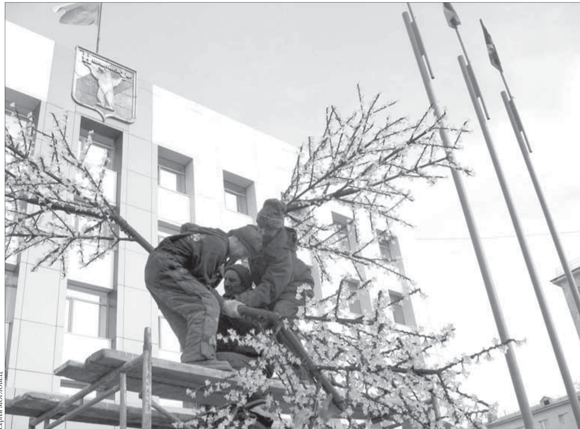
Тяжелая это работа – сажать деревья