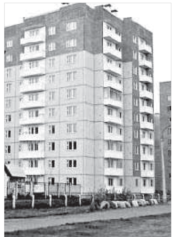
«Однушка» в Красноярске стоит полтора миллиона

Приходится также констатировать, что банки продолжают повышать ставки для заемщиков. На этой неделе ставки по ипотеке выросли в банках «Уралсиб», «Дельта-кредит» и «Жилфинанс». На минувшей неделе кредиты подорожали в «Юникредит-банке» и