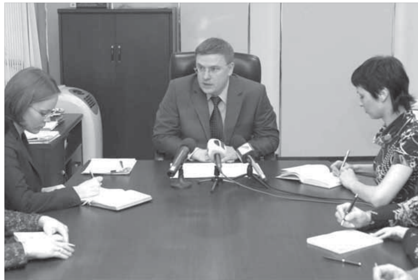
Сити-менеджер знает, на чем экономить

Он уже готов уйти на покой и перебраться на материк, но душа не отпускает с Севера. Кажется, вот закончит очередной объект, и все – можно уезжать! Но как же новые скважины? Еще есть к чему приложить руку. И квалификация и опыт здесь очень пригодятся.