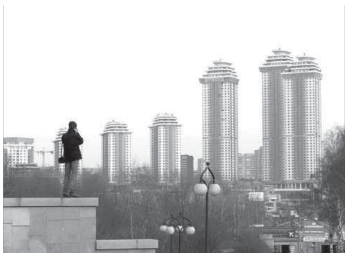
На элитное жилье в Москве большинство людей смотрят издали

«Альфа-банке». С 1 октября на два-три процента повышает ставки «Райффайзенбанк». Многие структуры перестали выдавать ипотеку без первоначального взноса. В большинстве случаев теперь заемщику придется накопить не менее 20 процентов от стоимости жилья.