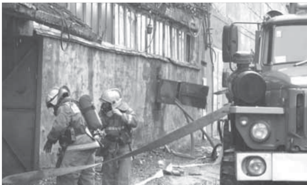
Основной показатель – оперативность

ка совместных действий служб экстренной помощи. Ведь именно от слаженности напрямую зависит исход борьбы с огненной стихией. Немаловажно и то, что в процессе учений горноспасатели и пожарные детально ознакомились с объектом. При подведении итогов действия и пожарных, и горноспасателей были оценены как высокопрофессиональные.