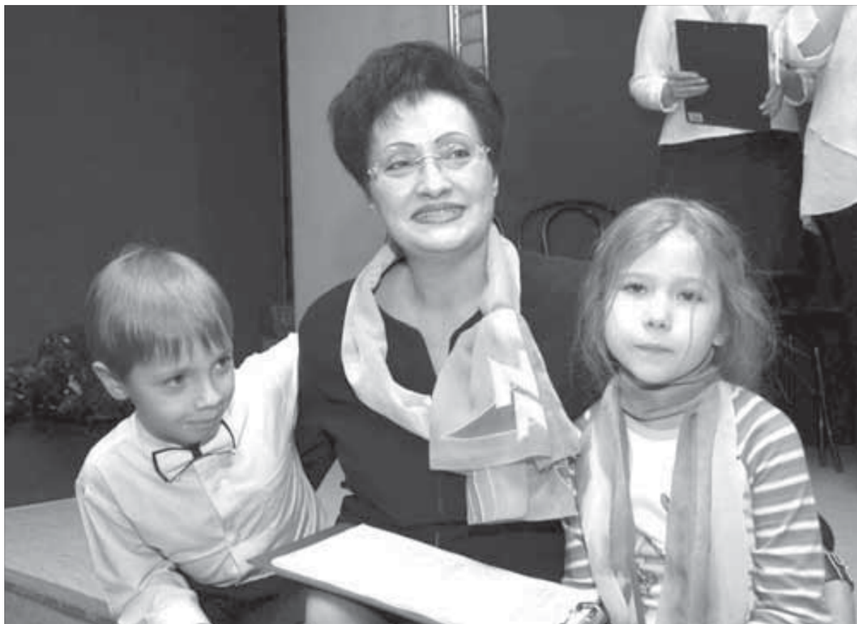
Взгляд в будущее компании

в цехах, на загородной базе отдыха, на газовом промысле, на городских концертных площадках. 65 программ подготовили талантливые сотрудницы компании и уже прикмушвшие к ним некомбинатские норильчанки.