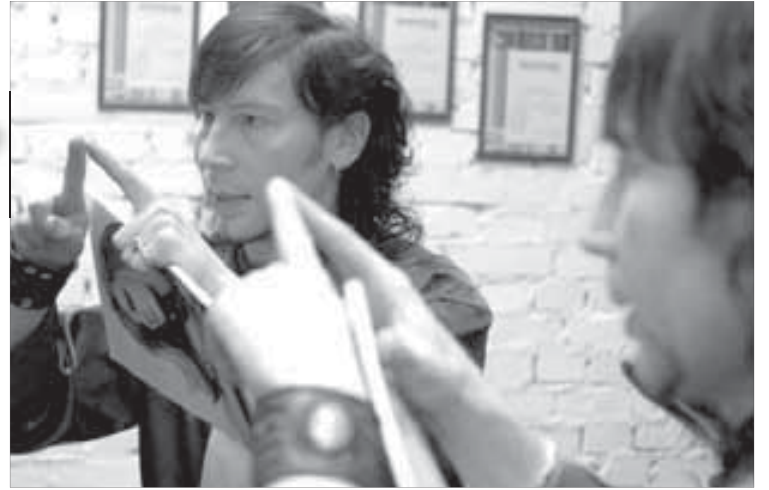
Иногда лучше объяснить на пальцах

Другая девушка сама нарисовала стрижку, которую хотела иметь. Она, естественно, не учла в рисунке ни строения черепа, ни густоты волос, ни типа лица. В итоге после обсуждения с ней оказалось, что она хочет совсем не то, что нарисовала. Пришлось вместе искать компромисс. Для меня главное – чтобы клиенту было комфортно. Но иногда приходится переубеждать, потому что я учи-