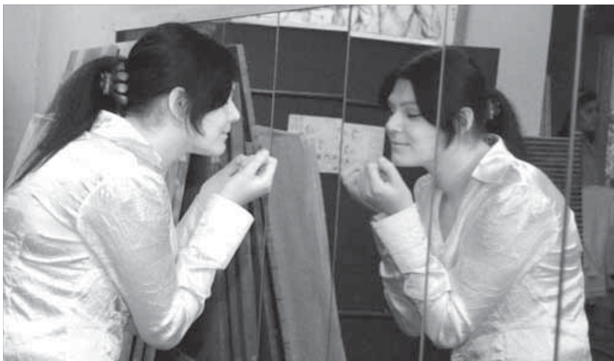
Они ждали этот день