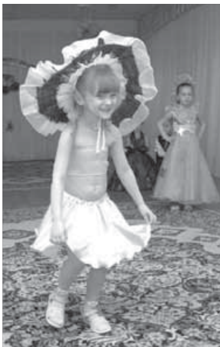
Посмотрите, как красиво