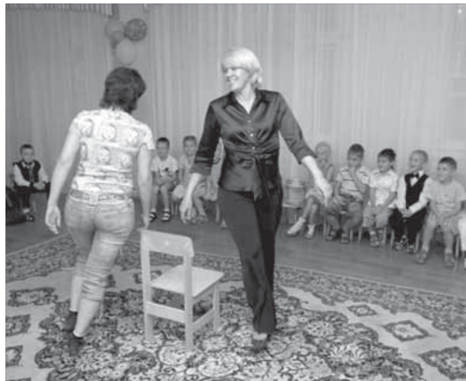
Воспитатели тоже играют