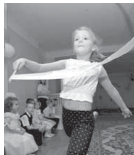
Выход с лентой