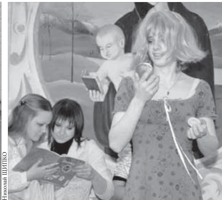
Студенты веселились от души