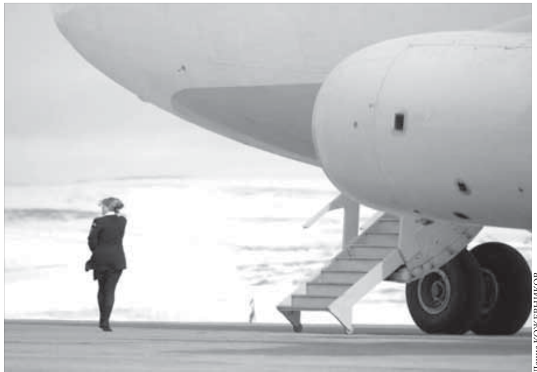
Может, и до нас долетят субсидии

В четверг инициатива была озвучена. И хотя Владимир Путин выступал не на заседании правительства, а на встрече с “единоборцами”, его пожелания надо рассматривать как руководство к действию кабинета министров.