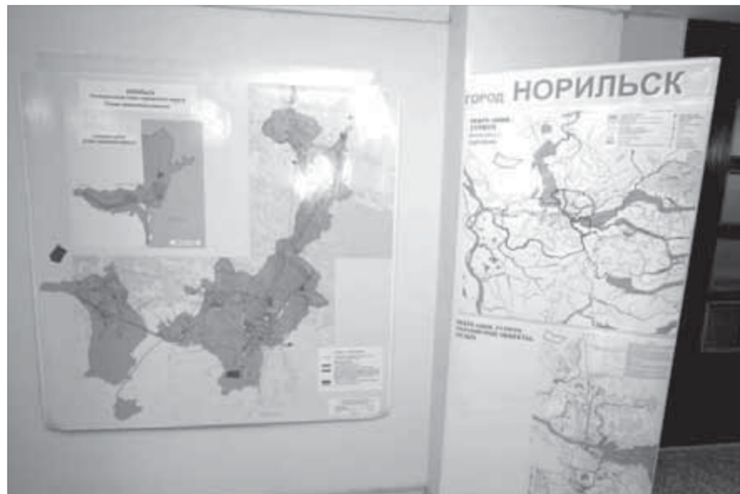
Мы здесь живем