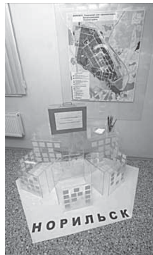
Чемоданчик уже не пустой

В выставочном зале представлен ситуационный план территории (стенд «Концепция»), карта Норильска, на которой, к сожалению, можно найти несколько опечаток (Листьянка, Наладная, Кларгон) и топографических ошибок (например, местоположение поселения Надежда).