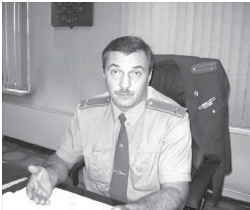
“Видишь, гололед? Сбавь скорость!”

– Почему не работали светофоры на нескольких перекрестках?