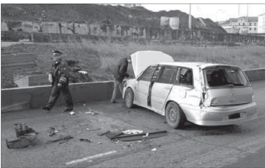
Новый вид автоакробатики – прыжки через газон?