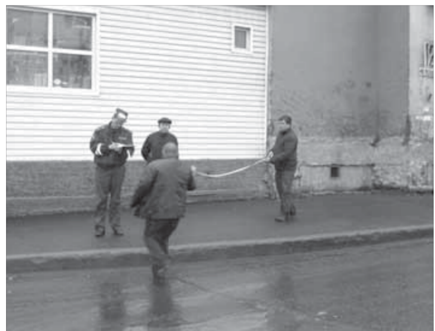
О сантиметрах до передней машины нужно было думать раньше