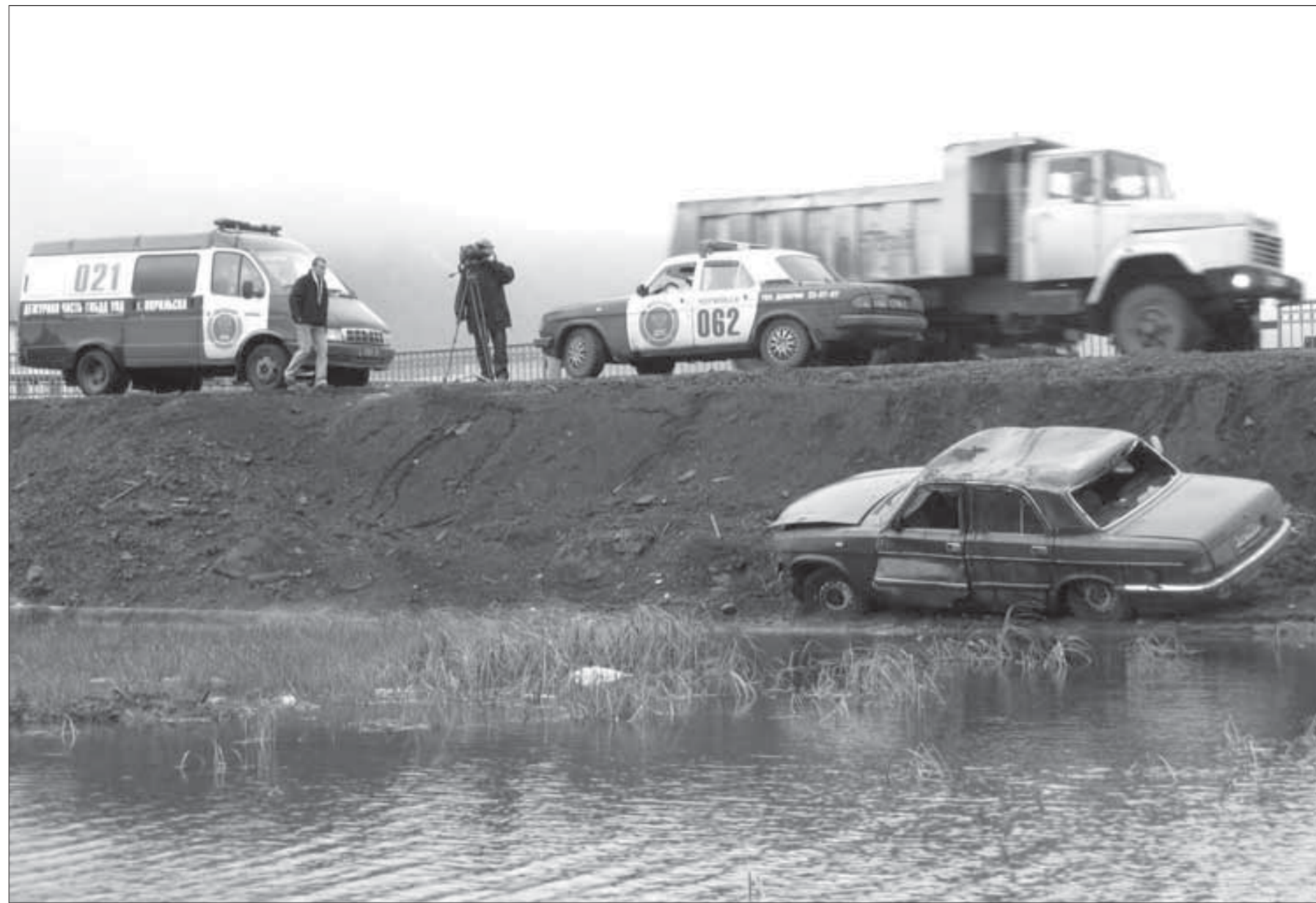
Полеты во хмелю оканчиваются жестким приземлением