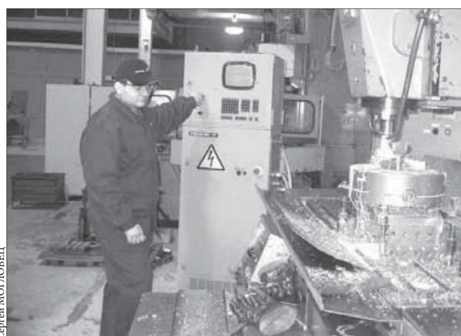
Все работы на предприятии автоматизированы

Курс акций ОАО «ГМК «Норильский никель» – 3425 рублей. ОАО «Полюс Золото» – 565 рублей.