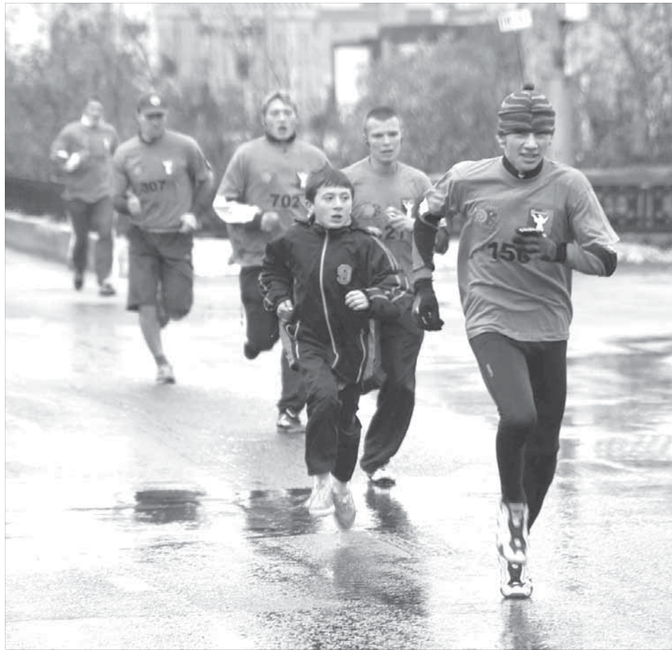
До шестнадцати и старше