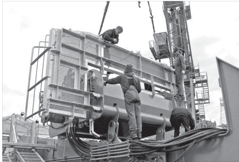
Русский с австрийцем –...

Изначально стратегия замены существующего парка порталных кранов Дудинки на мобильные LIEBHERR подразумевала экономию времени и средств на ежегодную эвакуацию порта во время паводка. К слову, Дудинский морской порт является единственным в мире, чья территория заливается паводковыми водами и который раз в год приходится почти полностью вывозить на высокое место. Из года в год производственникам приходилось тратить