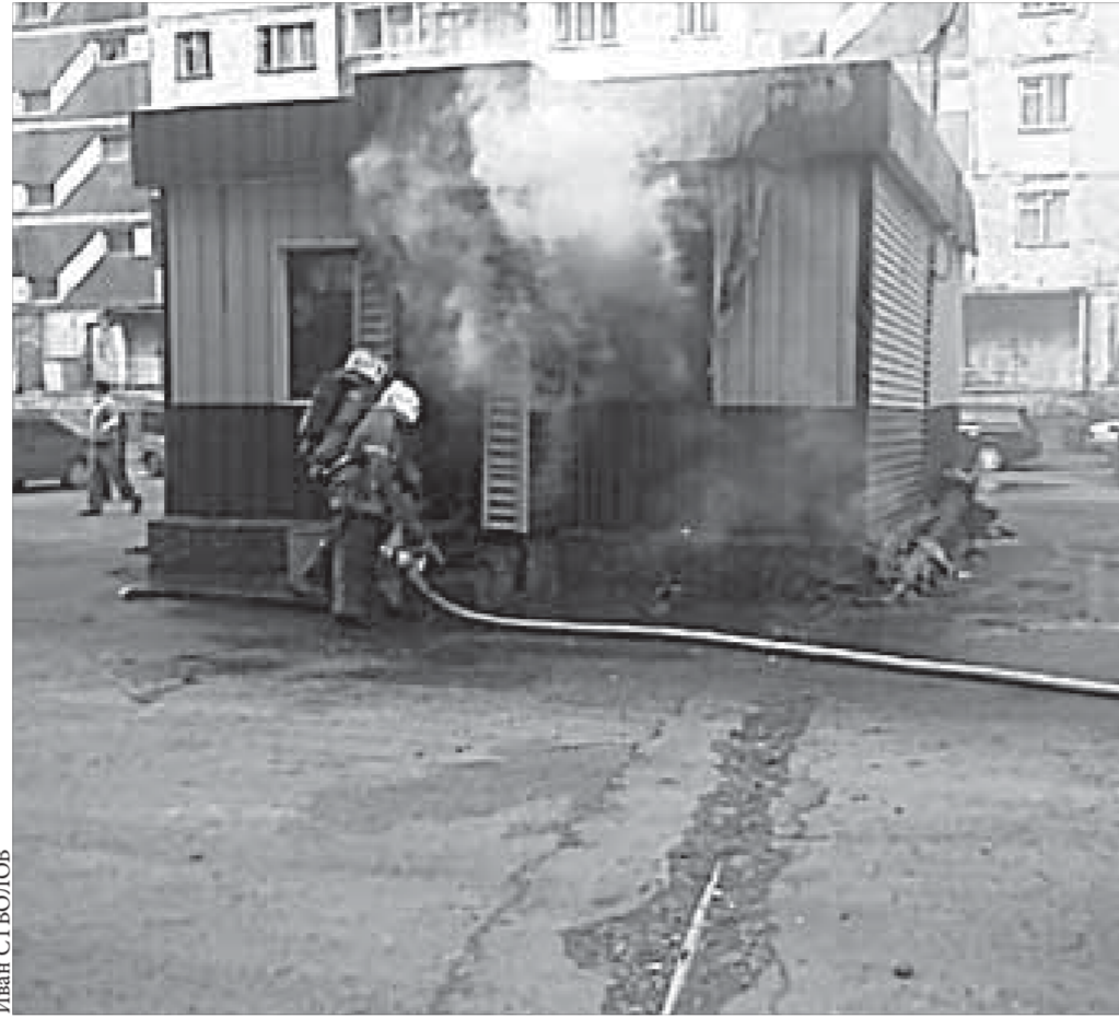
С пожаром справились быстро