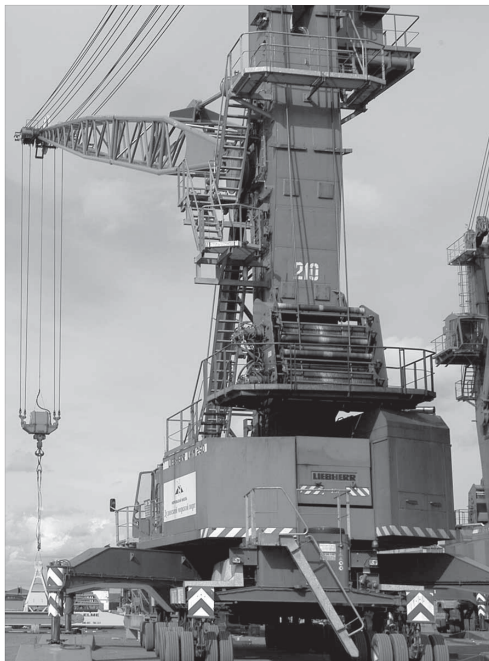
...– получится кран

Сейчас на морских причалах одновременно с обработкой нового судна собственного флота компании ведется и сборка двух новых кранов LIEBHERR. Как и в прежние годы, монтажом и отладкой занимается два представителя фирмы-изготовителя из Австрии, но теперь с ними на равных работают уже и русские