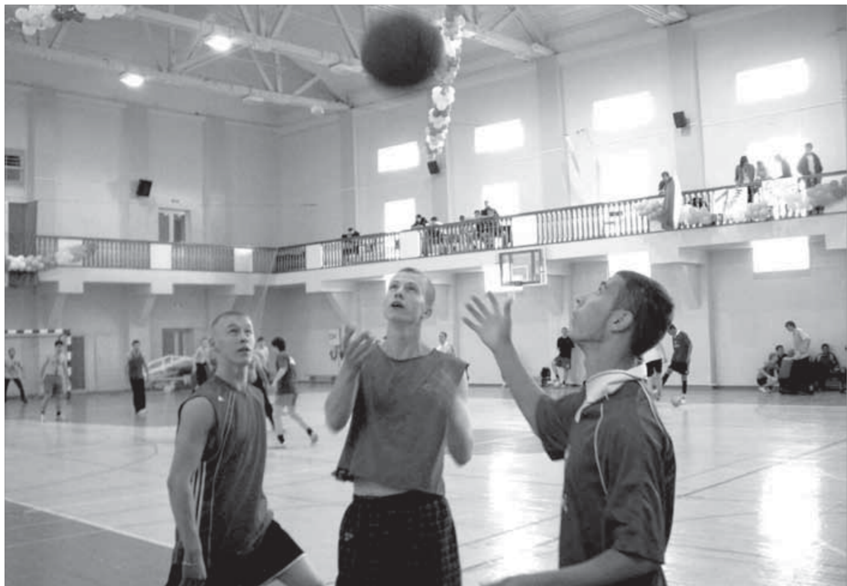
Кто берет мяч, тот берет матч