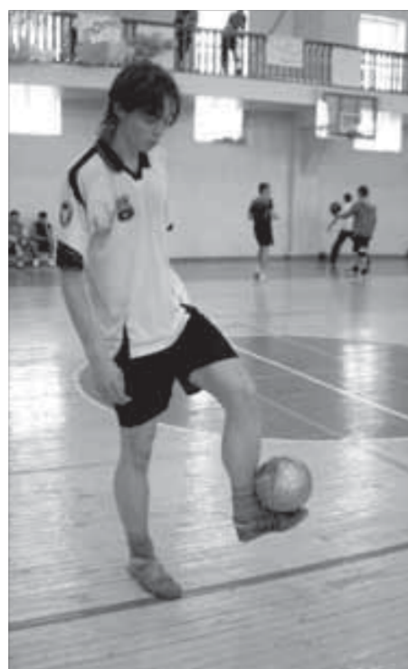
Разминка перед стартом

Третье место досталось донецкому "Шахтеру", оказавшемуся более удачливым в серии послематчевых пенальти с подмосковными "Мтыгищами".