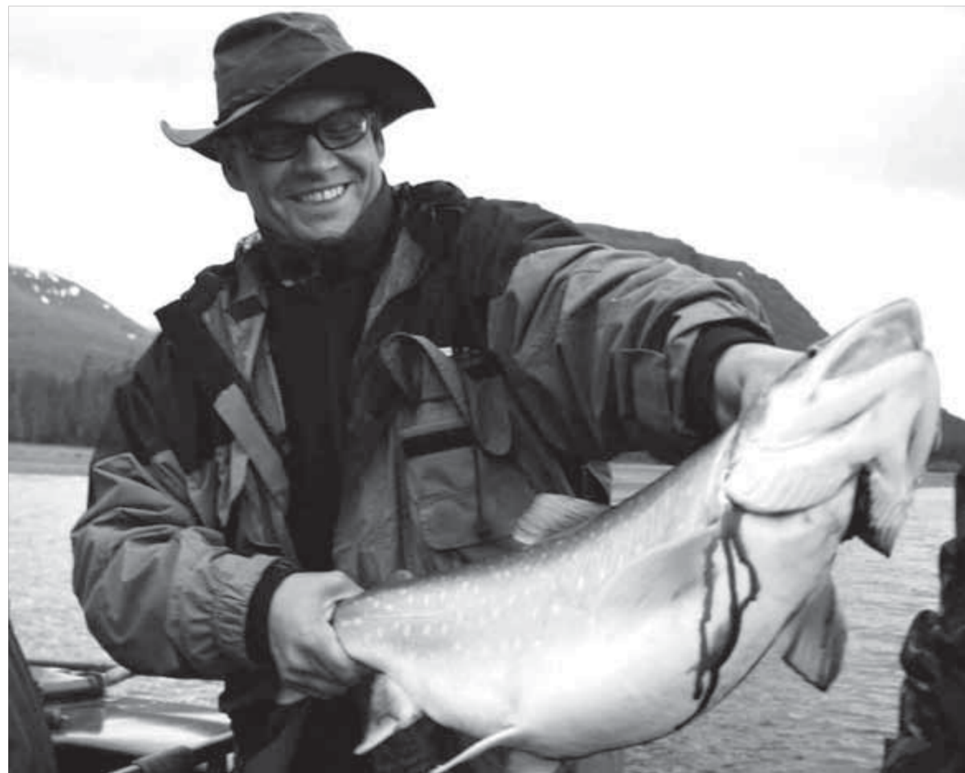
Времени хватает на все