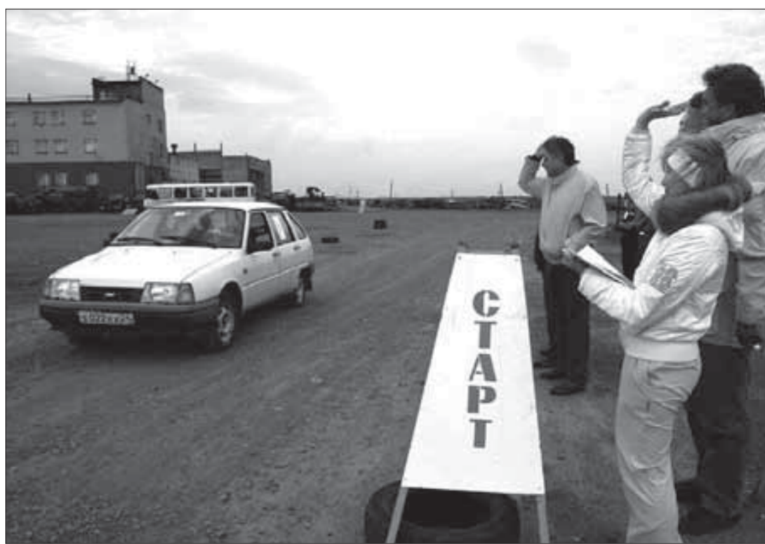
В погону за кубком