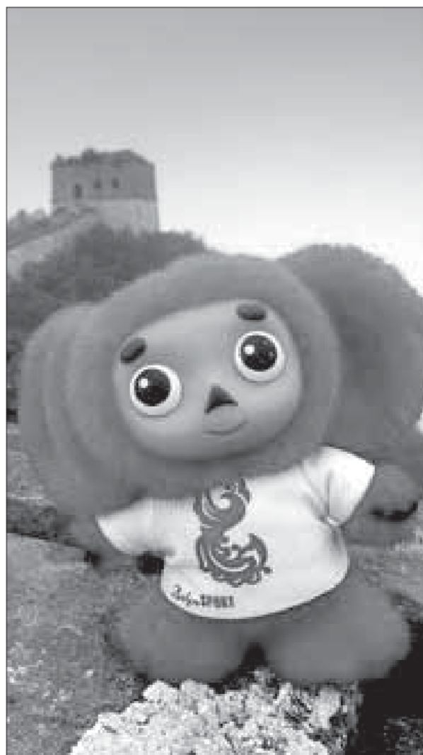
Талисман нашей сборной «взошел» на Великую Китайскую стену

На Олимпиаде в Пекине будет разыграно 302 комплекта медалей. В Играх примут участие 10 500 лучших спортсменов планеты. Соревнования пройдут в Пекине, Циндао, Гонконге, Тяньцзине, Шанхае, Шэньяне, Циньхуандао. В программу Игр включены легкая атлетика, бадминтон, баскетбол, бейсбол, бокс, волейбол, гребля, гребля на байдарках, велоспорт, конный спорт, гимнастика, тяжелая атлетика, стрельба из лука, гандбол, хоккей, дзюдо, теннис, борьба, парусный спорт, фехтование, футбол, водные виды спорта, современное пятиборье, софтбол, тхэквондо, настольный теннис, стрельба, триатлон и другие виды спорта. Российская делегация будет составлять 843 человека, из которых 467 спортсменов. Врачи и массажисты составят 80 человек. Средний возраст спортсменов – 26 лет. Они представляют 59 субъектов Российской Федерации. Наибольшее количество спортсменов делегируют Москва (121 человек) и Московская область (69 человек). Россияне выступят в 244 дисциплинах по 39 видам спорта. Перед нашей сборной поставлена задача попасть в первую тройку общекомандного зачета на Олимпиаде-2008. Президент национального Олимпийского комитета Леонид Тягачев отметил, за медали будут бороться 79–85 человек.