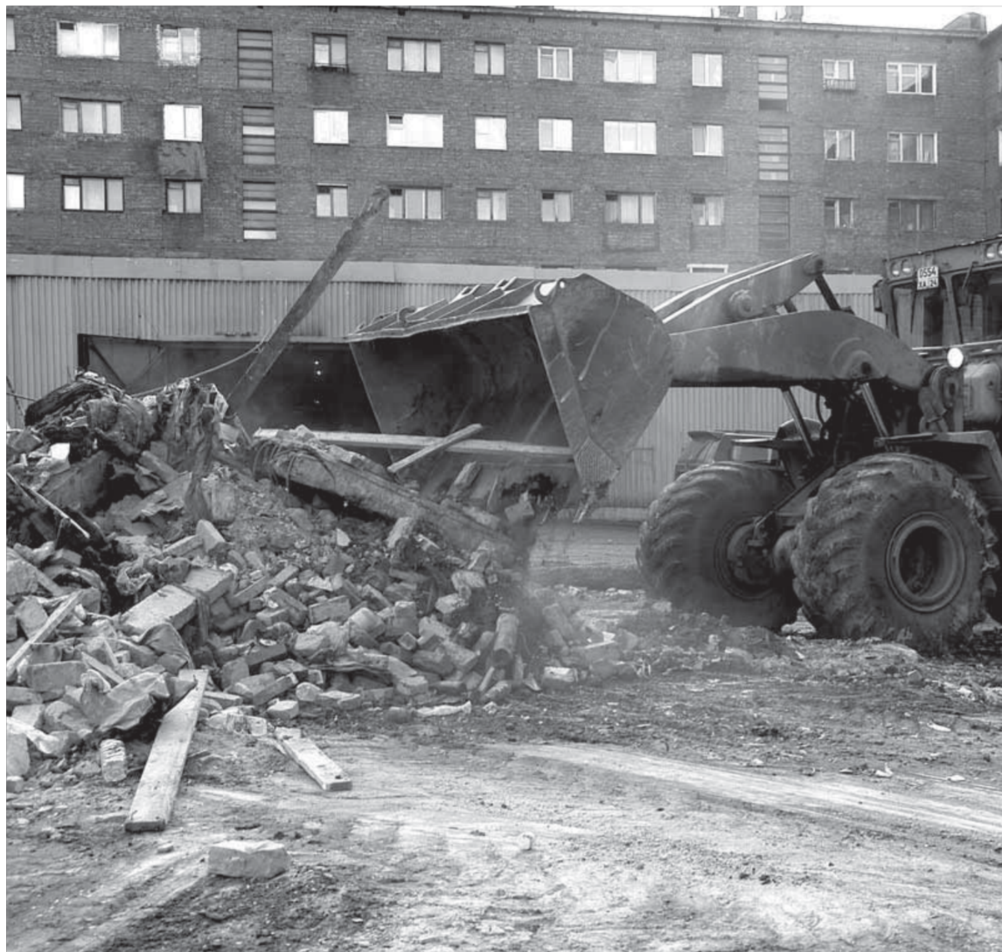
От мусоросборника осталась груда обломков

В городе началась кампания по демонтажу старых мусоросборников