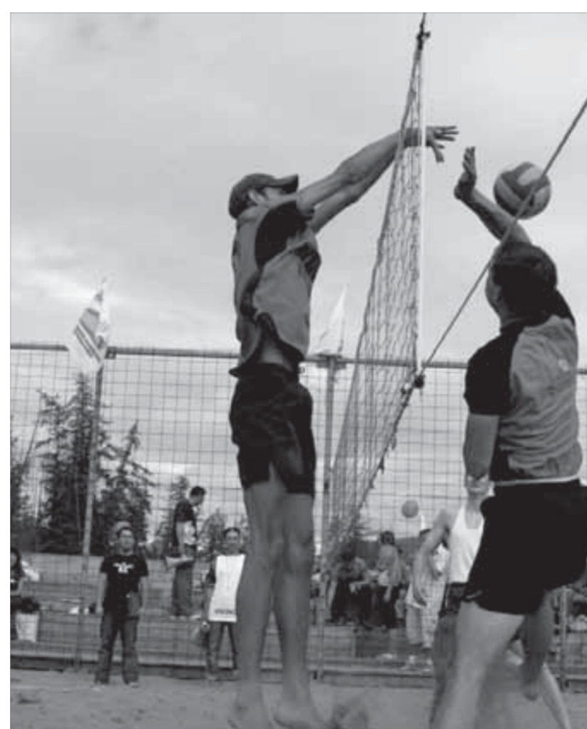
Хороший блок – победы залог

Фестиваль стартует 16 августа в 11.00 на автодроме норильской школы РОСТО (ДОСААФ). Подать заявку можно по факсу 43-29-40 или по телефону 49-14-50 с 13.00 до 15.00. Последний день приема заявок – 16 августа до 10.00. Фирмам такси, которые решат присоединиться к фестивалю, советуем заявки подавать заранее. На технический осмотр машин и административные проверки зарегистрированным участникам дадут всего лишь час.