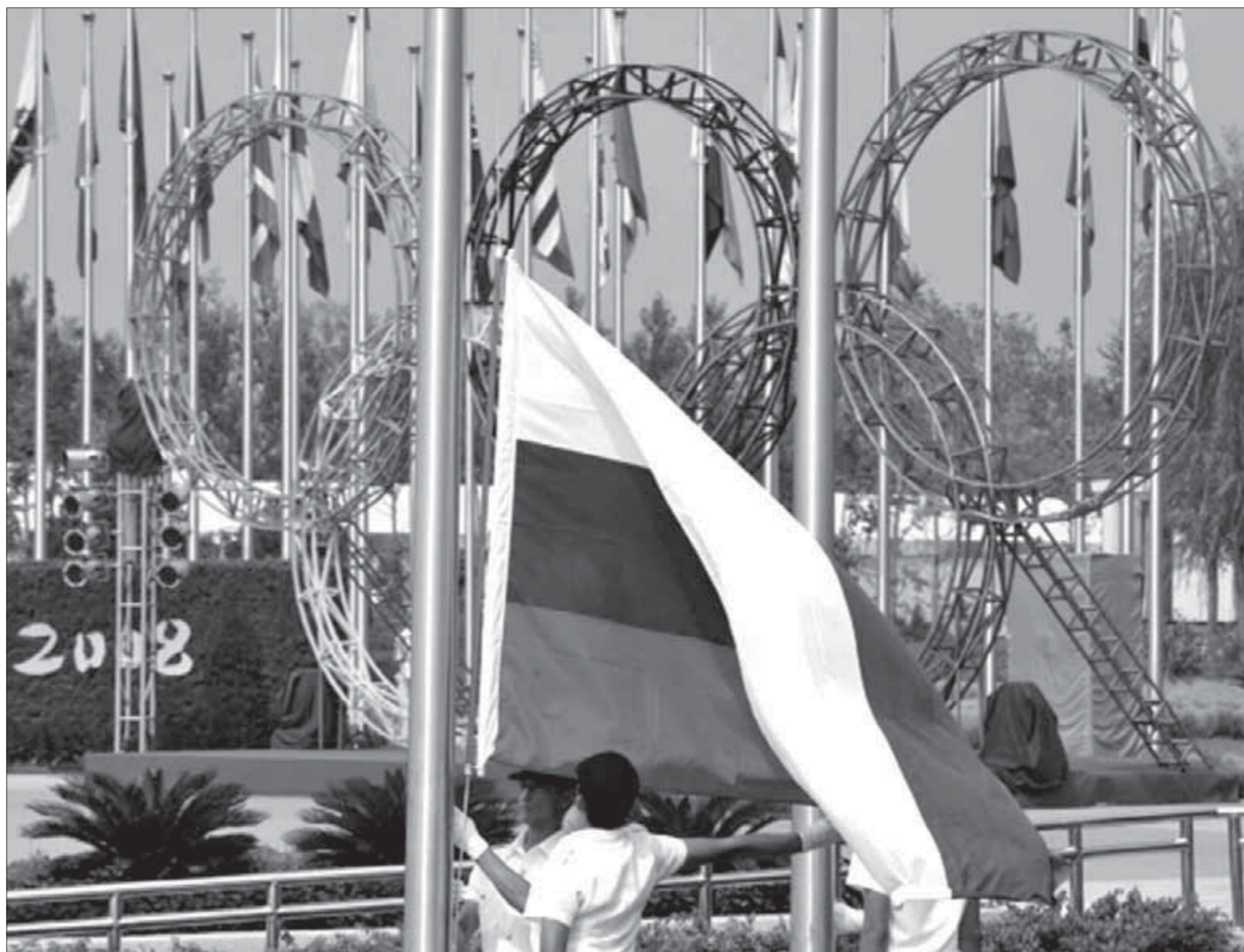
Церемония поднятия российского флага в Олимпийской деревне

Дудинское вокальное трио «Сулускан» и ансамбль песни и танца «Хэйро» примут участие в этнокультурном фестивале «Дети одной реки». Цель этого праздника талантов – показать богатство и многообразие культур коренных народов Севера, а также роль великой сибирской реки Енисей в развитии межэтнических и культурных связей региона. В этом году встречу «Детей одной реки» будет столица Эвенкии Тура. В прошлом году этнокультурный фестиваль проходил в Туруханске. По его итогам переходящий символ – бубен – вручили представителям Эвенкийского района.