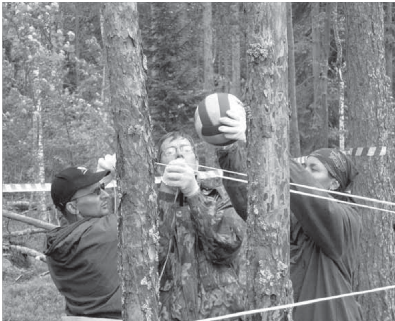
А теперь эстафета

Пока спасатели буксировали на середину озера плоты и гребцов, остальные робинзоны рассаживались на берегу. Старт дали из ракетницы. И сразу стал