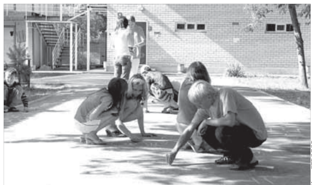
Пространство можно украсить самим