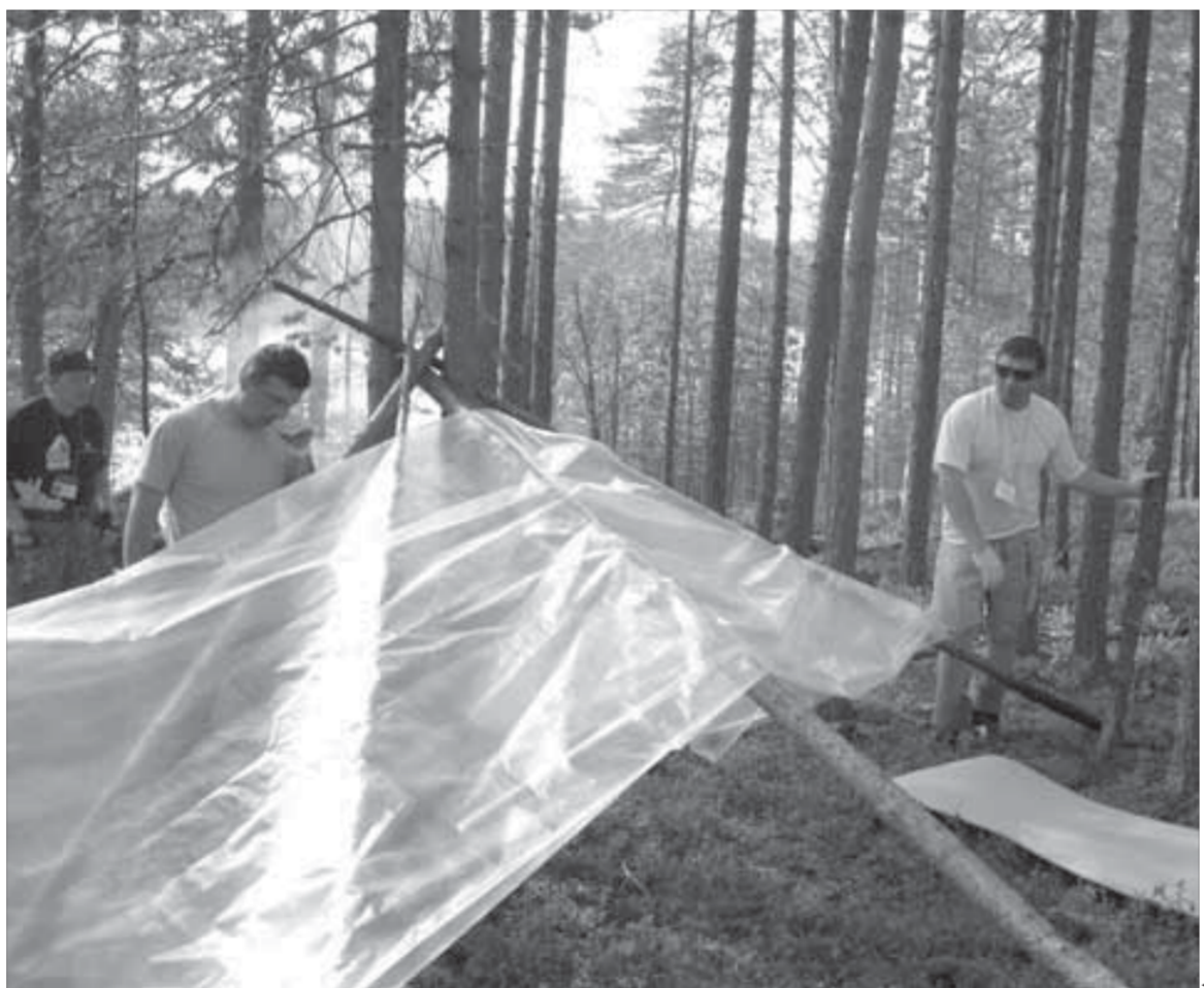
Витгам строили все вместе

Спешно снимаем лишнюю одежду и вывешиваем ее на сучки и ветки – просушиться от пота. Осматриваемся: нам явно достался самый маленький и самый "голодный" остров. Кто-то из робинзонНов шутит: "Назовем его Голодным?" Решаем над названием подумать позже. Однако, действительно, ни ягод, ни грибов, никакого зверья мы не обнаруживаем. Спутываем пару теремов, они в истерике улетают туда, где нет людей. На земле замечаем скорлупу от разбитых яиц, поблизости явно было гнездо. Прямо посредине острова, длина которого порядка километра, ширина – метров 200, замечаем следы присутствия людей. Стоит пара лавок, очаг, обожженный камнями, чем не место для лагеря? РобинзонНовы-мужчины держат совет: из чего и как соорудить крышу над головой? Я тем временем замечаю, что команда "НИИстовых" (студенты НИИ) высаживается на соседнем острове. Между нашими временными жилищами максимум километр по воде, но в полной тишине слышно, как переговариваются люди. В дальнейшем мы сможем даже подслушивать разговоры "НИИстовых".