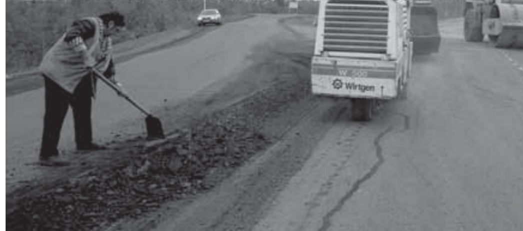
Деньги вкладывают в дороги

По краевой программе развития и модернизации улично-дорожной сети Норильск в виде субсидий получил около 20 миллионов рублей. Они используются в том числе для ремонта проезжей части юго-западной обьездной дороги и уличного освещения.