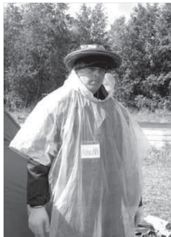
Чем не капуста?

Наконец настал день высадки шести команд на необитаемые острова Онежского озера. Однако вначале нам предстояло пройти несколько серьезных испытаний: провести пару часов в теплой одежде, подвергнуться досмотру и принудительному купанию в озере.