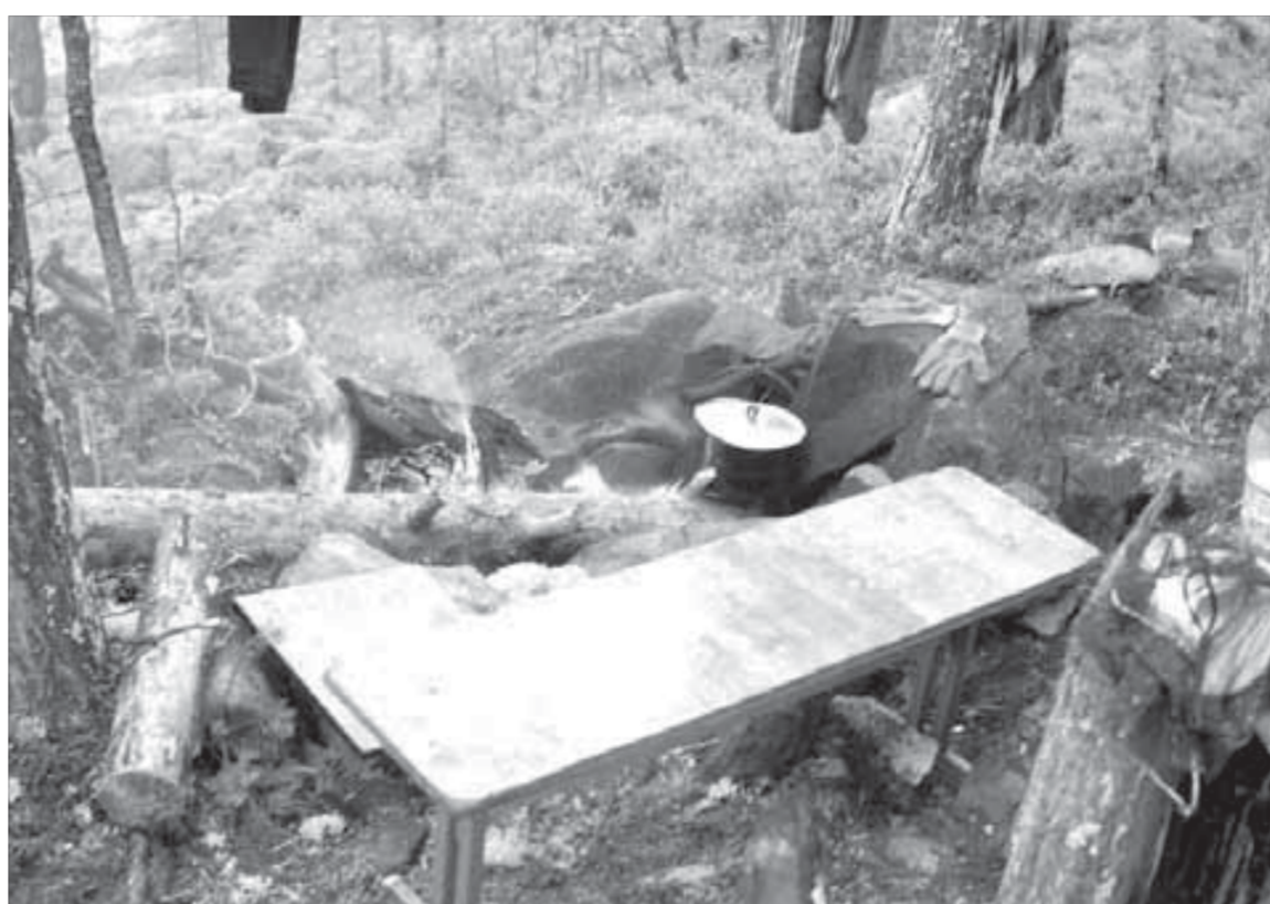
На острове нашлись даже скамейки

Подплываем к острову и в этот момент вспоминаем об интриге – выкинут за борт или нет? Но никто нас в воду не бросает. Лодка бьется о прибрежные огромные валуны, пассажиры выгружаются. Первым делом осматриваем место высадки. Видно, что остров тщательно изучили до нас. Деревья у брошенного костровища повязаны красно-белой пластиковой