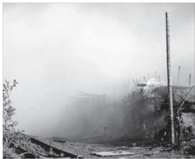
Пламя быстро охватило большинство построек

На месте происшествия продолжает работать комиссия Западно-Сибирской транспортной прокуратуры и Западно-Сибирского следственного управления на наличие признаков состава преступления по статье “Нарушение правил безопасности движения и эксплуатации воздушного транспорта”, которая предусматривает наказание в виде лишения свободы на срок до двух лет.