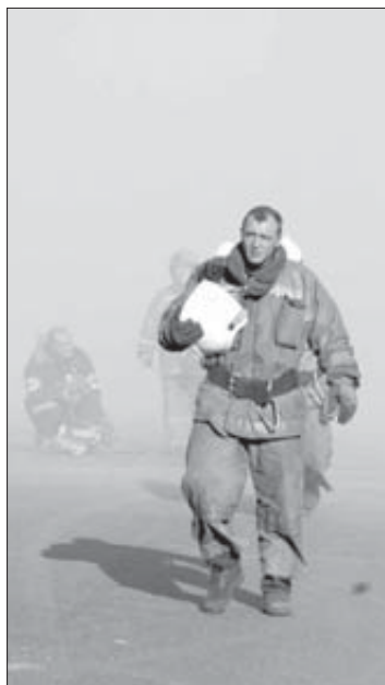
Одни возвращались, другие уходили