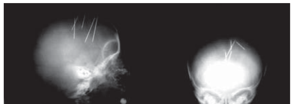
В голове ребенка врачи обнаружили иголки