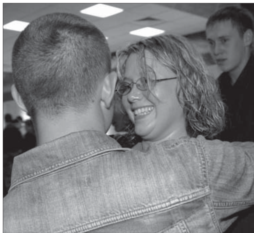
На игре будет весело