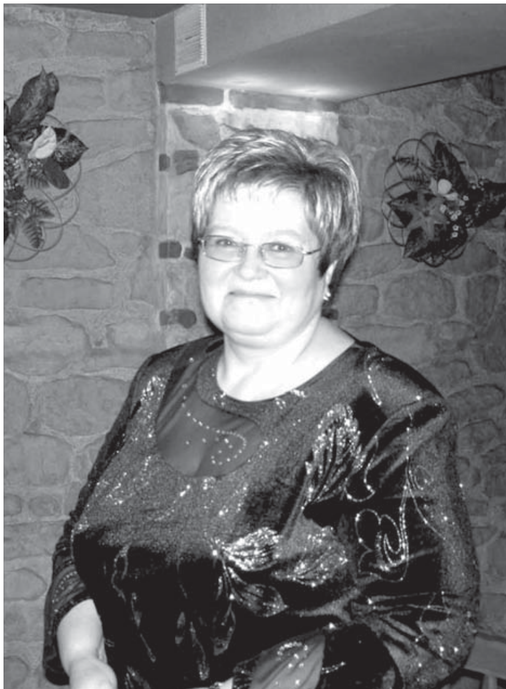
Когда рядом она, мир становится теплее