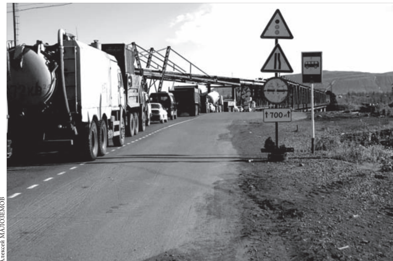
Узкая полоса затрудняет движение