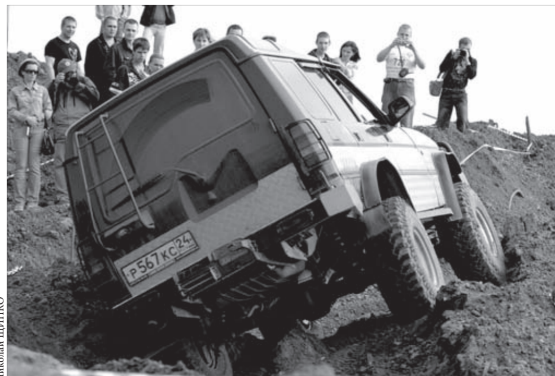
На такую горку и пешком зайти нелегко