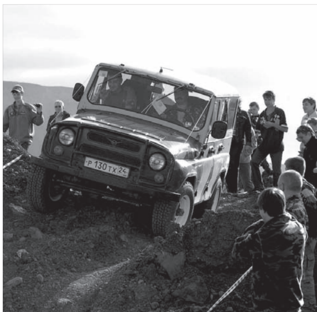
УАЗу советских времен грязь месить привычно

Организаторы надеются, что подобные соревнования получатся провести и на День шахтера, ведь зрителей такие действия привлекают.