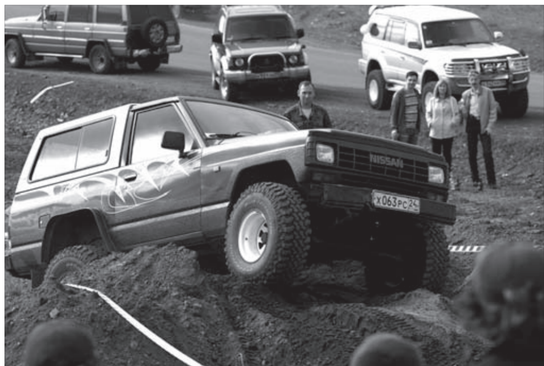
На ровной дороге не интересно