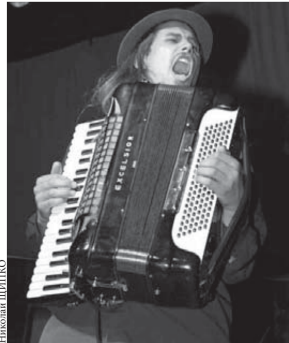
Американец с русской душой?