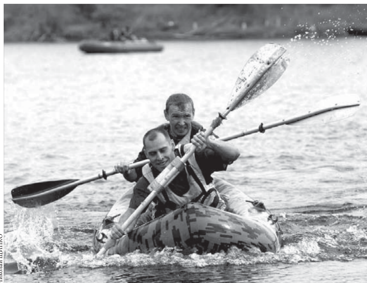
На День города нужно быть первым

В дни празднования 55-летия города и Дня металлурга в норильском роддоме на свет появились девять детей: четыре мальчика и пять девочек. Все мамы "юбилейных" новорожденных получили подарки от главы Норильска.