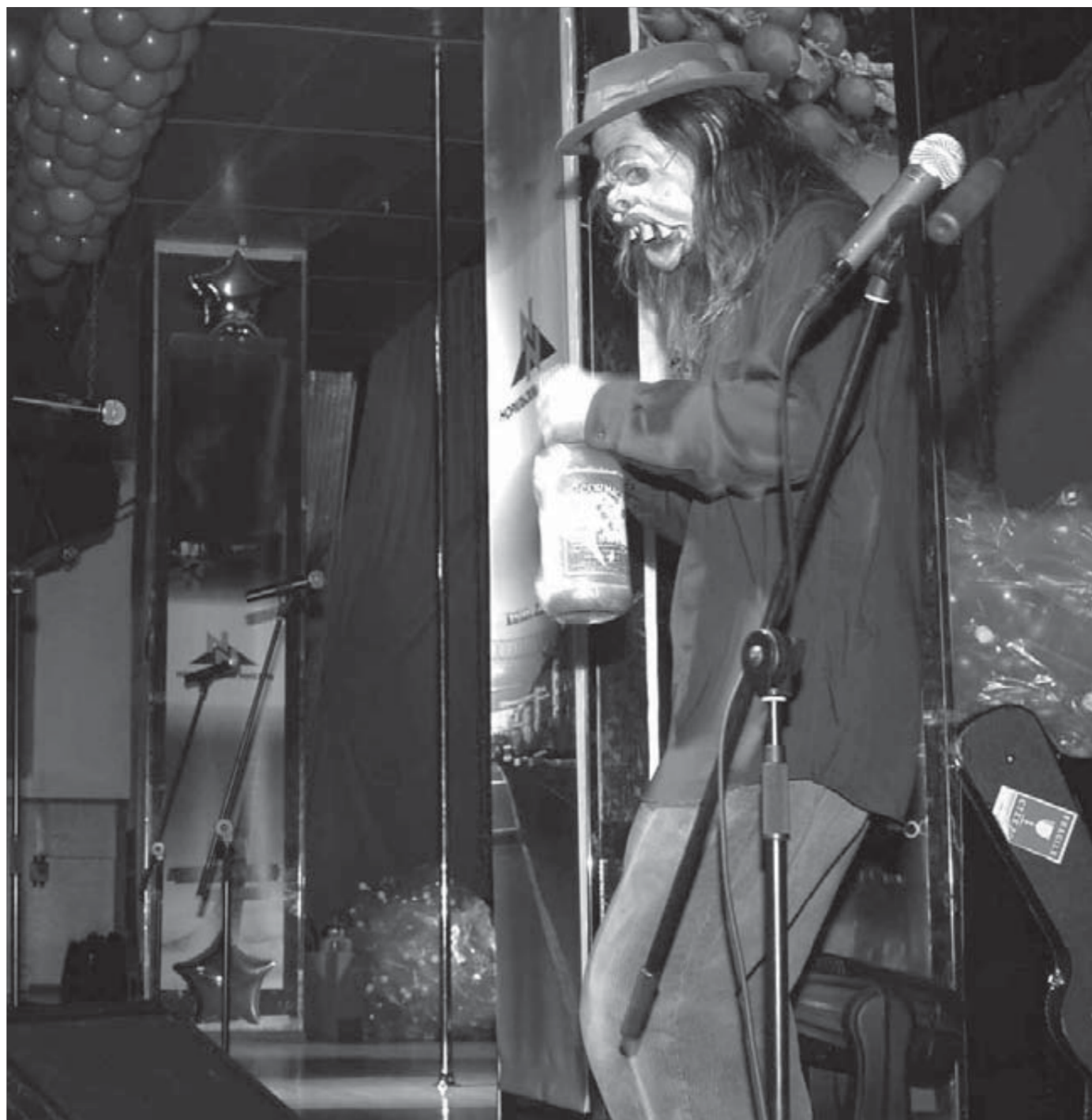
Если кто-то и испугался "страшного" Джейсона, то это были не зрители "АРТА"

Хорошо бы, как в фильме "День сурка", просыпаясь, каждый день видеть афишу: "Сегодня в Норильске выступает Джейсон Уэбли".