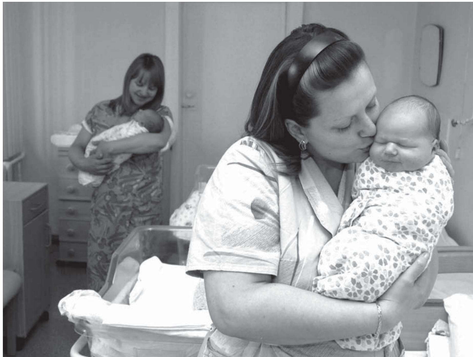
Лучший подарок к празднику

На открытой площадке перед киноконцертным комплексом "АРТ" для поваров летних кафе 2 августа пройдет конкурс "Праздник шашлыка". Конкурсанты должны будут приготовить по 10 порций шашлыка из свинины и столько же – по оригинальному рецепту. Победители будут награждены дипломами и ценными призами. Заявки на участие в конкурсе принимаются до 25 июля в управлении потребительского рынка и услуг администрации Норильска (Ленинский пр., 23а, каб.111. Тел. 48-45-58, факс 48-45-56).