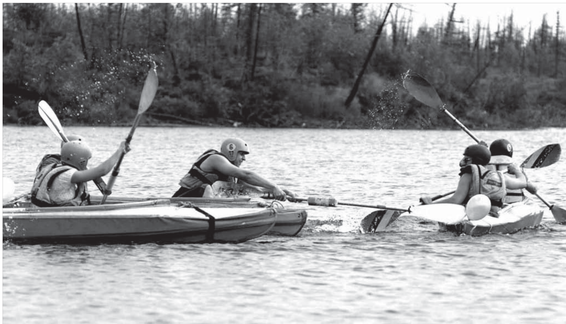
Абдаж на тундровом озере