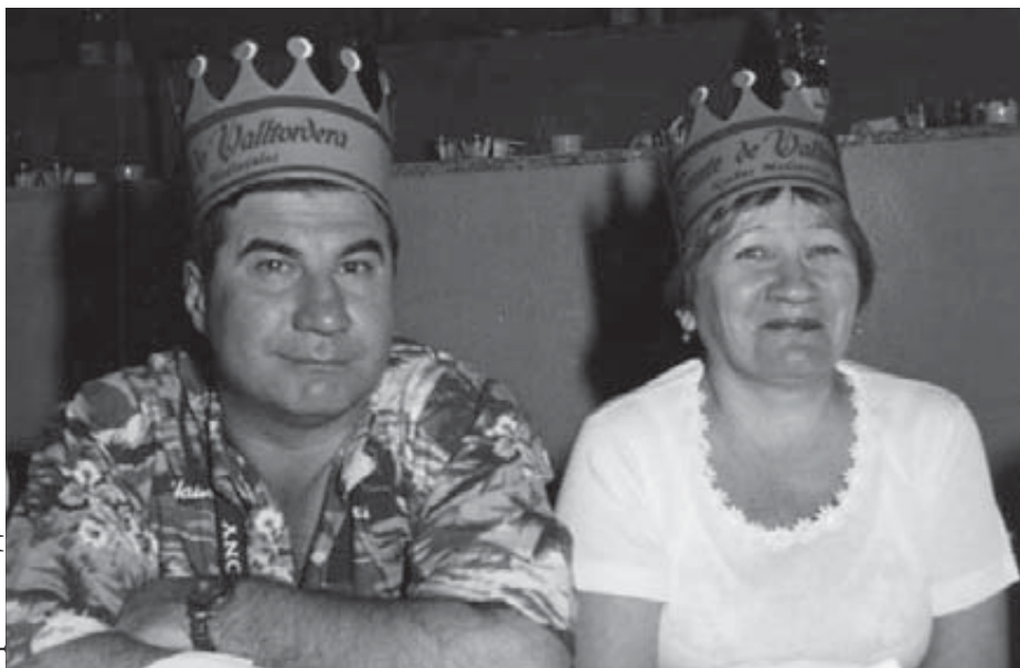
В Испании на рыцарском турнире. Король и королева с медного завода