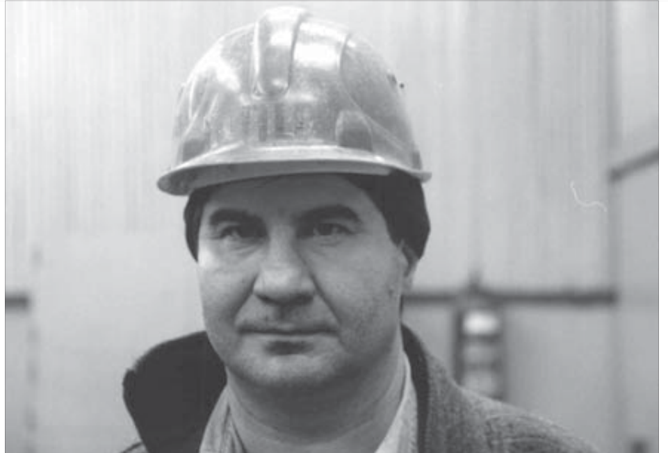
Бригадир суров, но потому он и бригадир