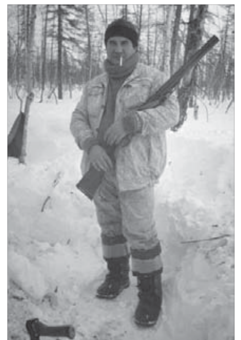
На охоте в окрестностях Норильска