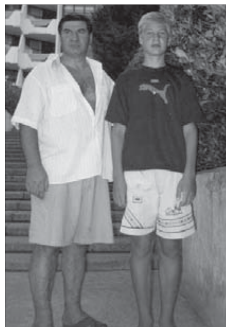
С сыном в санатории “Заполярье”