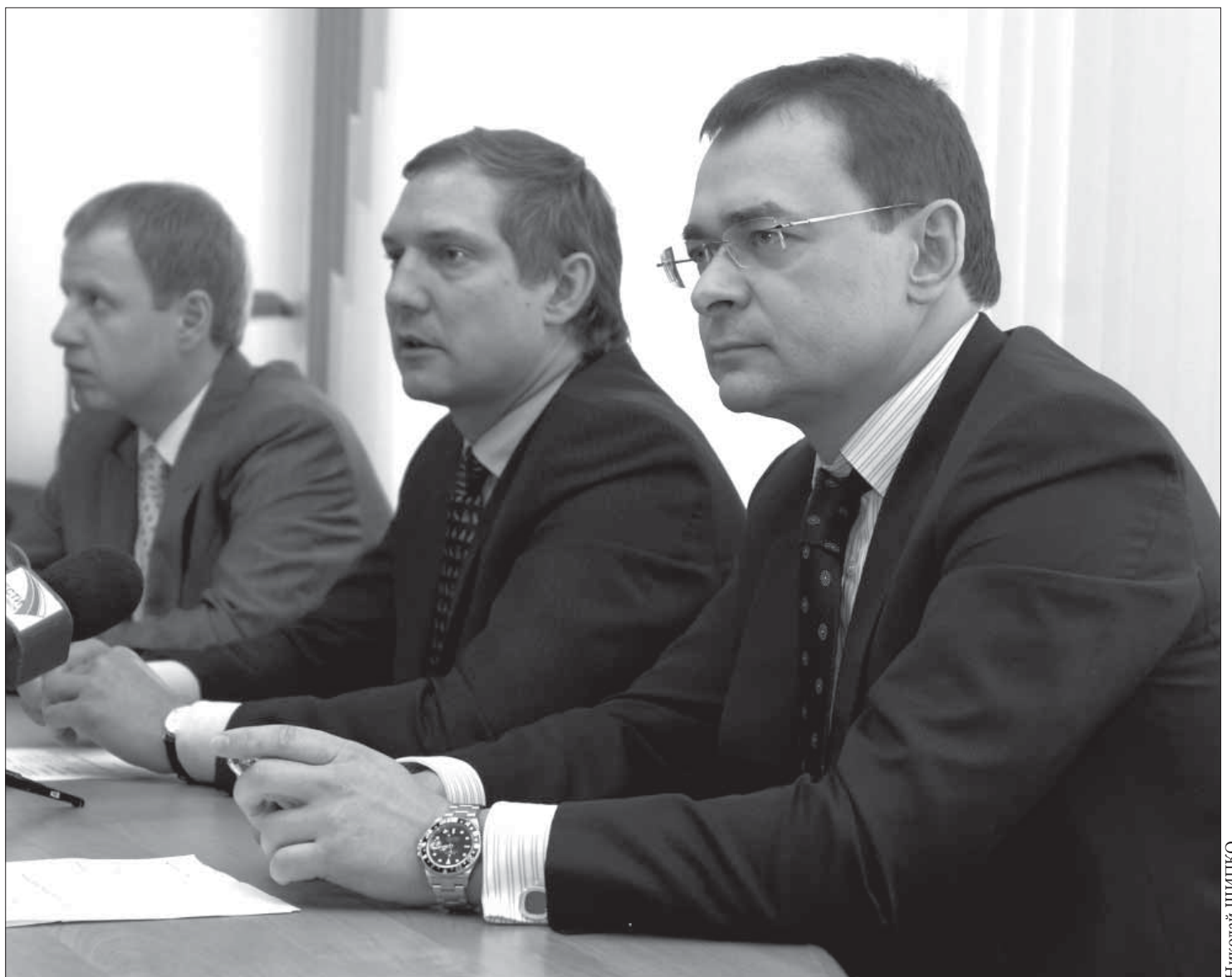
Приоритетными для "Норильского никеля" будут социальные вопросы и вопросы кадрового обеспечения

В фанпарке будут презентованы клуб экстремальных путешествий Федора Конохова "Навигатор", комплекс бревенчатых избушек для пикников, выполненных в традициях столбистов, а также экстремальный аттракцион "Зипрайдер" – полет с вершины склона в специальном оборудовании. Сегодня в мире существует четыре таких аттракциона, красноярский в России будет первым.