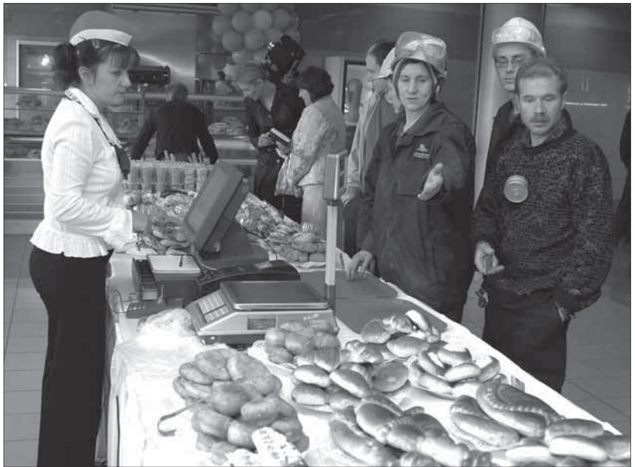
Выбор вкусностей был оценен

Местные кулинары подарили заводчанам к празднику четыре новых торта – “Смуглянка”, “Нектар”, “Бархатный” и “Апельсиновый рай”. В их приготовлении использованы только натуральные продукты: сливки, желейные фрукты и другие ингредиенты. Торты расходятся на глазах.