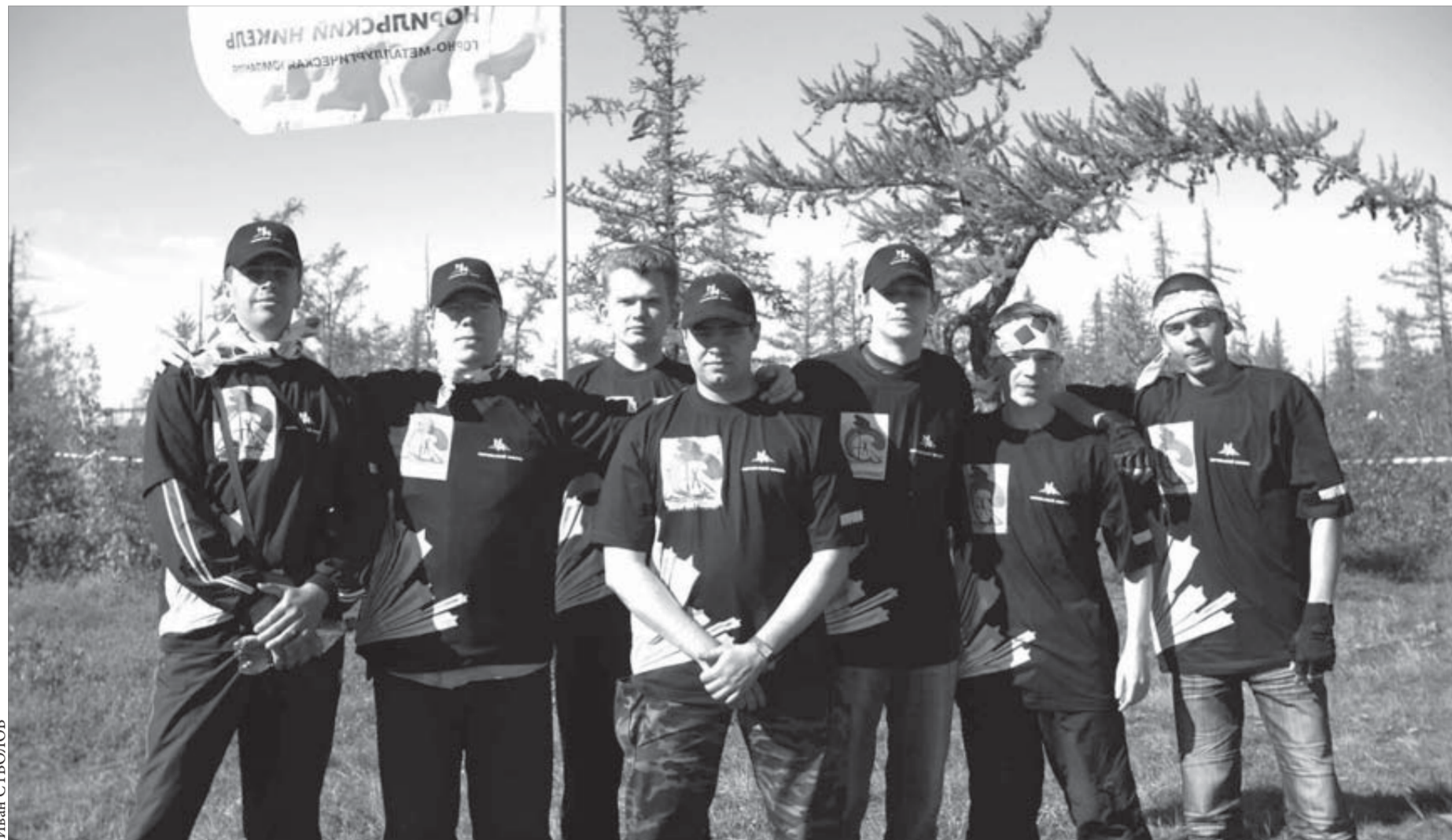
На широкие плечи мужчин-РобинзоННов ляжет тяжелая часть работы

По информации Управления ЗАГС Таймырского муниципального района, местные жители стали чаще усыновлять и удочерять детей-сирот. За шесть месяцев этого года 10 детей обрели семью и новых родителей. По сравнению с данными за аналогичный период прошлого года количество усыновленных детей в районе возросло на 25%, а в сравнении с 2006 годом этот показатель увеличился в два раза.