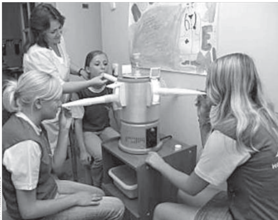
Лечебная часть в “Премьере” на высоте

Солнце, море и вода – лучшее, что может дать южный климат для северянина. Правда, тут же оговариваются медики, оно должно быть в разумных пределах. Тогда и польза организму будет. А у них, врачей, для оздоровления детских организмов припасена еще масса возможностей. Кислородный коктейль, например.