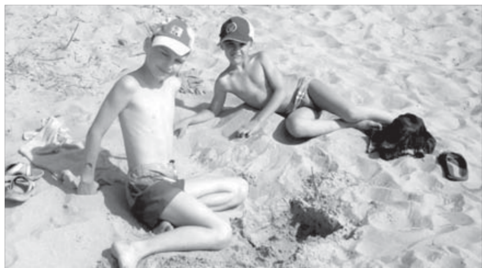
А после процедур – все на пляж!

В культурно-оздоровительном центре “Премьера” 18 июля готовятся три вида выплат. В июне 2008 года на основании решения комиссии по Коллективному договору схема оказания материальной помощи реформирована. В соответствии с утвержденным порядком бывшим работникам предприятий группы компании – неработающим пенсионерам, постоянно проживающим на территории муниципального образования “Город Норильск” и Таймырского Долгано-Ненецкого муниципального района, будет выплачиваться единовременная материальная помощь.