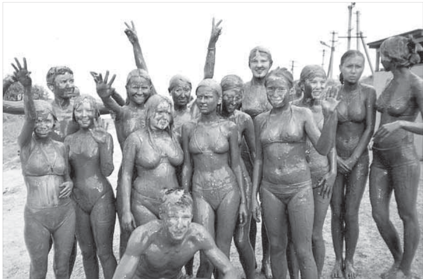
Мы отмоемся и скоро вернемся