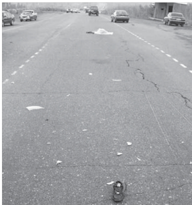
При столкновении девушку отбросило на несколько метров