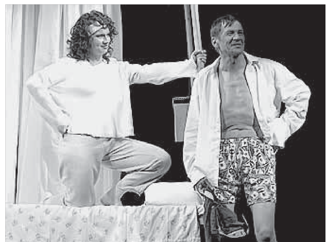
Фрагмент спектакля “Аделаида”

Представляет гастроли Минусинского драматического театра