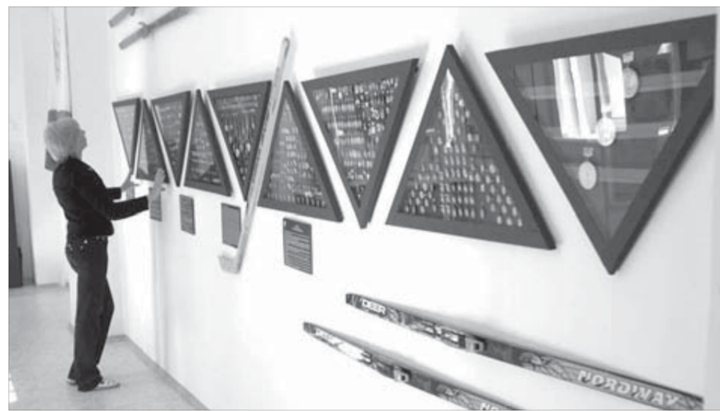
Все готово к приему посетителей