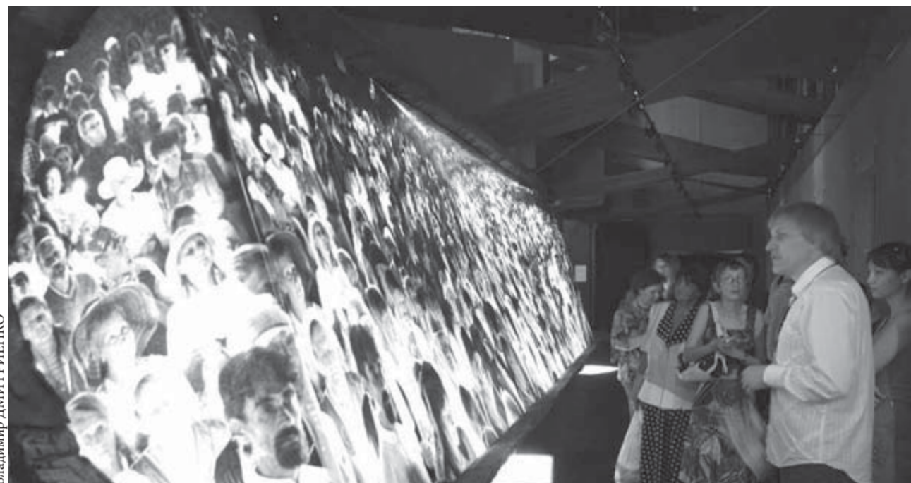
Тунгусский феномен изменил жизнь миллионов людей на планете

Если бы Тунгусского метеорита не было, его надо было бы выдумать