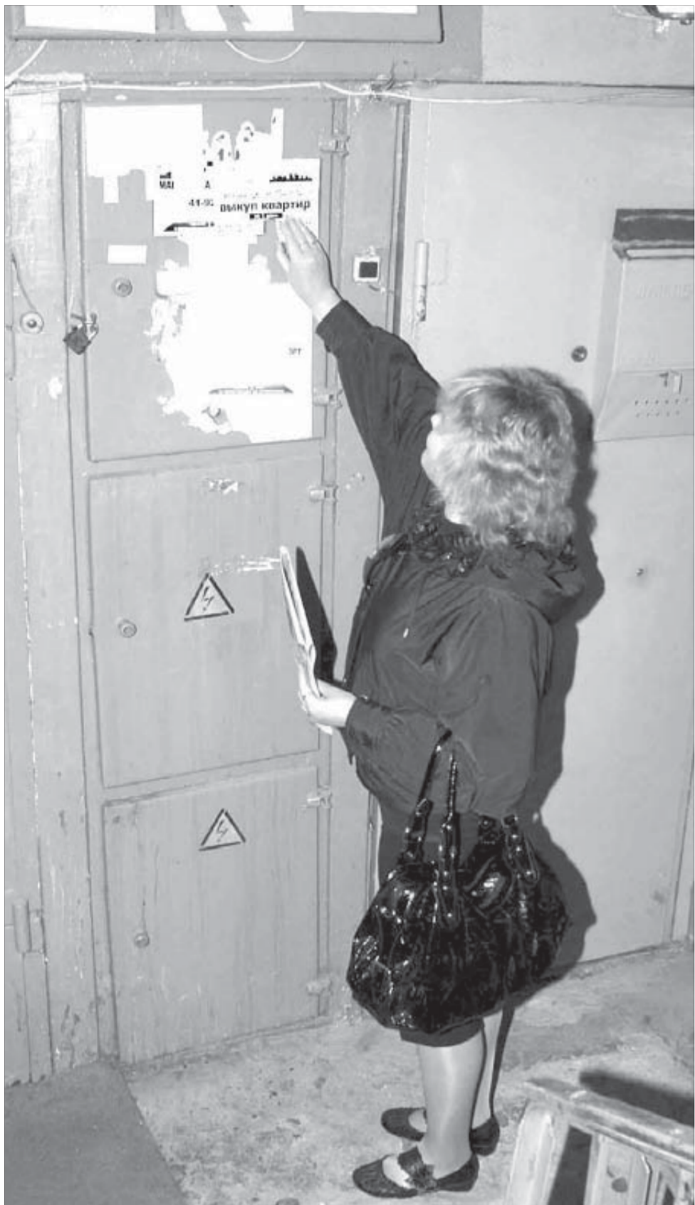
Дешево квартиры не хотят продавать

концертными программами, проводил творческие встречи на никелевом и механическом заводах. Выступал он и на 70-летнем юбилее Норильского горно-металлургического комбината три года назад. Сценой его стали... ступеньки управления Заполярного филиала компании, а зрительным залом — вся Гвардейская площадь.