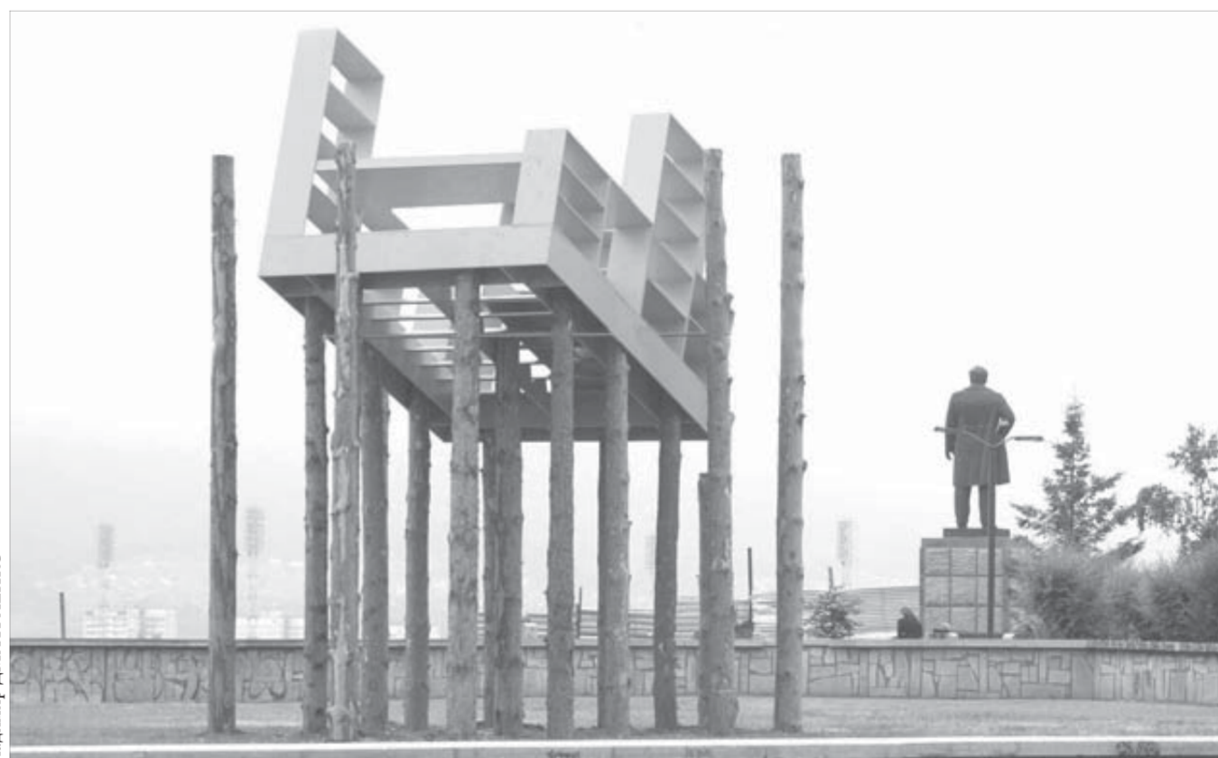
Кабинет инопланетян, по мнению голландцев, выглядел именно так

Курс акций ОАО "ГМК "Норильский никель" – 5974,6 рубля. ОАО "Полюс Золото" – 1359 рублей.