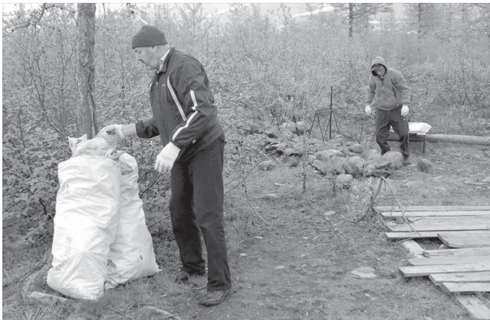
Если не мы, то кто?

В Красноярском филиале Почты России подведены итоги благотворительной акции "Месяц добра". Во втором полугодии 2008 года 67 социальных учреждений края и 38 ветеранов войны будут получать популярные газеты и журналы за счет спонсоров. Жители Норильска оформили благотворительную подписку не только на периодические издания, но и на сборники произведений русских и зарубежных классиков по каталогу книжного клуба "Терра". У нас в городе активное участие в акции приняли никелевый завод, ООО "Блэк Даймонд", военный комиссариат и другие учреждения. Всего в крае оформлено 800 подписных изданий для социально незащищенных слоев населения.