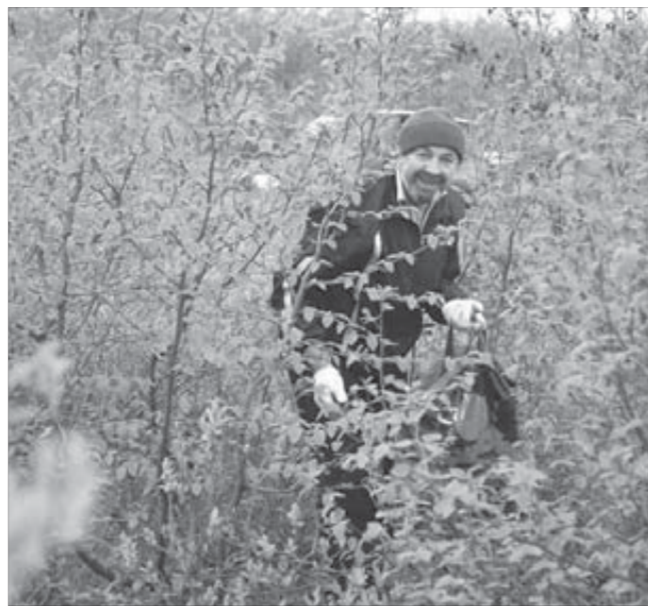
Соломаха без дела не оставался