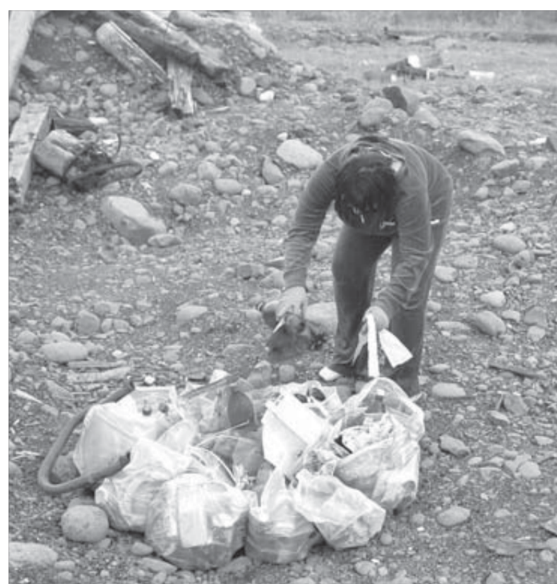
Этот мусор оставили любители шашлыка