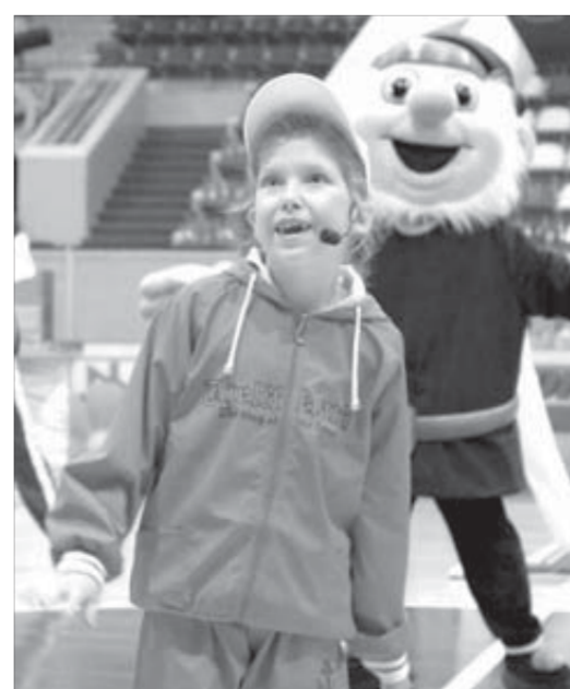
Вроде все привычно, а столько эмоций!

В течение месяца каждый тошевец сможет показать свои спортивные навыки и способности. Ребята будут участвовать в состязаниях по волейболу, мини-футболу, дартсу. Пройдут турниры по шашкам и шахматам. Школьники примут участие и в юбилейном легкоатлетическом забеге, приуроченном к 55-летию Норильска. Закрытие спартакиады пройдет 25 июля.