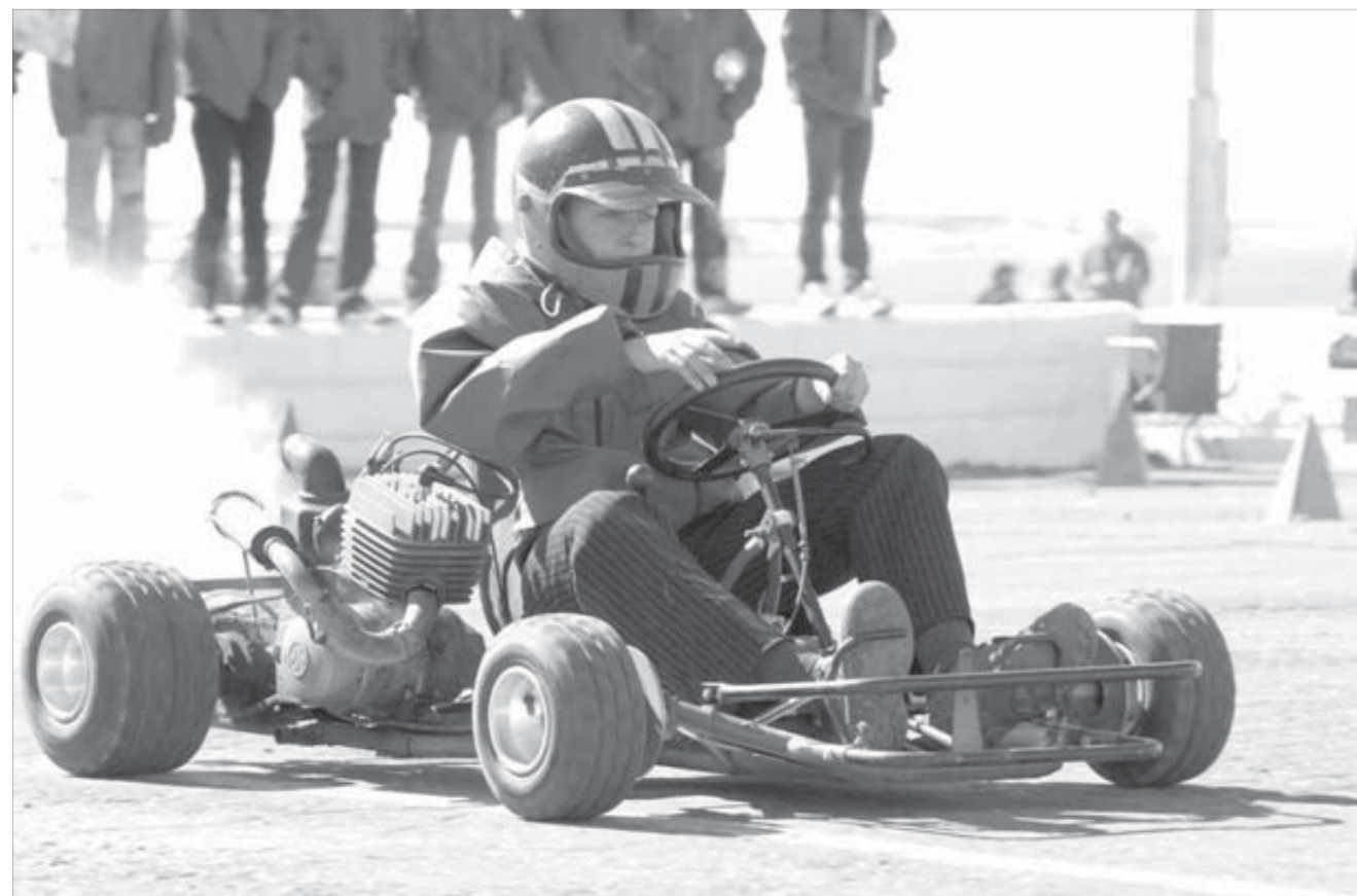
Карт хоть и маленький, но мощный

– Развитие в Дудинке карт-движения говорит о том, что это действительно необходимо для дудинских ребят, – отметил глава города и подчеркнул, что картингисты могут смело рассчитывать в дальнейшем на помощь городских властей.