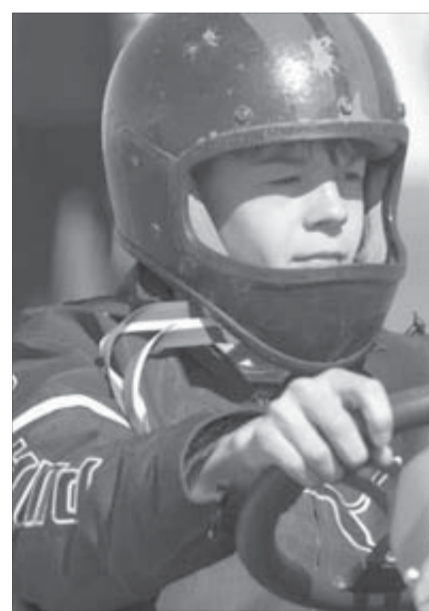
Главное – разумный риск

Надев рабочие перчатки, депутат горсовета снова будет мастерить лавочки и рассказывать интересные случаи из истории слетов.