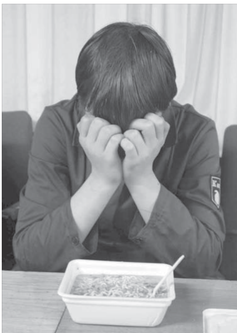
Обед – и снова на работу