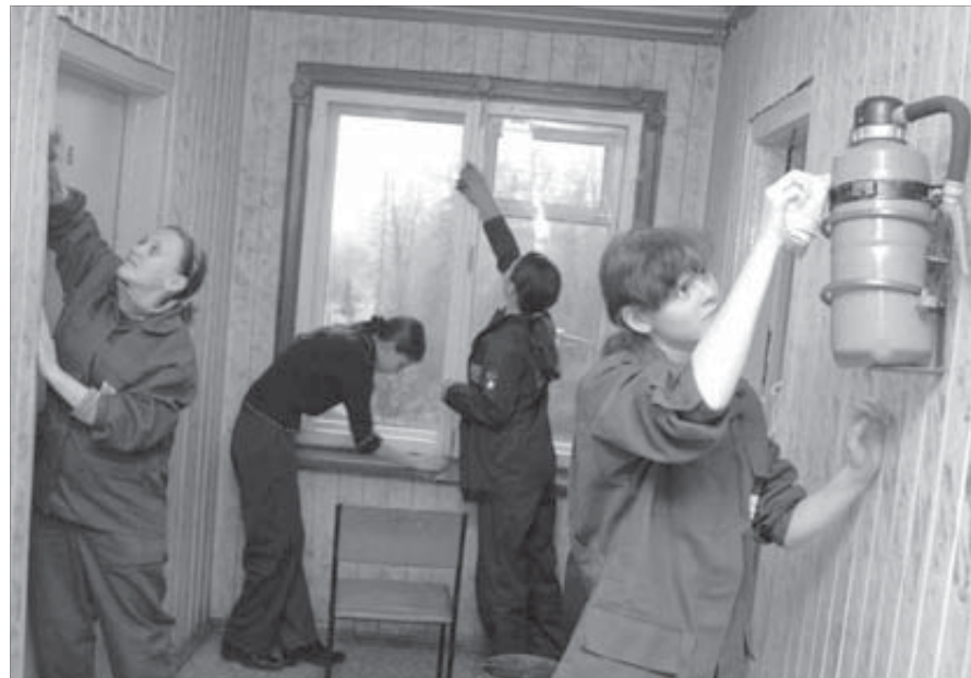
Чистота и порядок должны быть везде