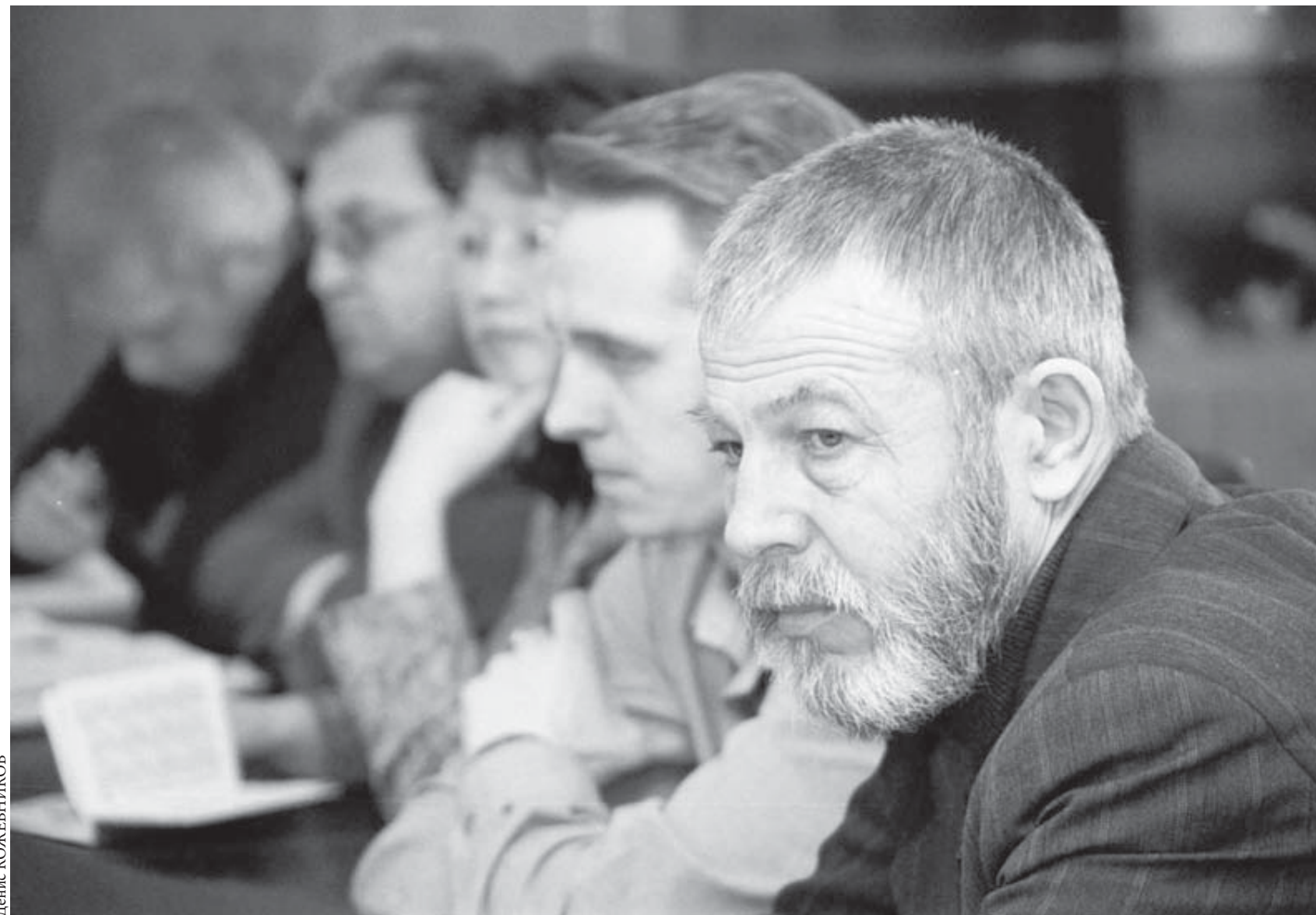
Он видит в людях искренность, порядочность, мужество, доброту

Сегодня в кайерканском детском саду №75 «Зайчонок» отпразднуют новоселье. На сегодняшний день в «Зайчонок» ходят только 36 малышей, остальные пока отдыхают на материке или продолжают оформление. Всего детский сад рассчитан на 210 детей, которых разделят на 12 групп. Напомним, что помимо стандартного коллектива педагогов и воспитателей в штат детского сада вошли дефектолог, психолог и логопед.