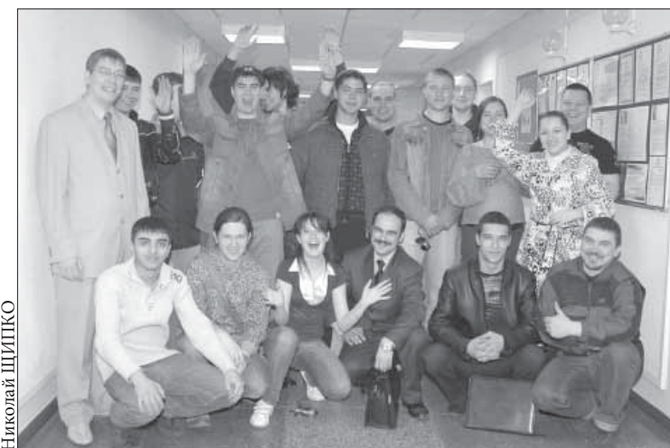
К РобинзоНаде готовы!

В Карелию участники «РобинзоНады-2008» отправятся 14 июля, вернутся обратно 26-го. На это время сотрудники Заполярного филиала «Норильского никеля» оформят отпуск, а студентов освободят от практики. Решение остальных вопросов по организации поездки и финансированию команд берет на себя корпоративный университет «Норильский никель».