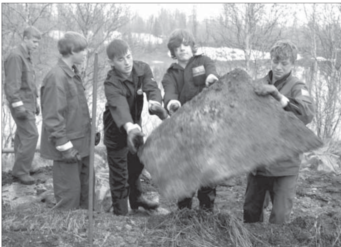
Дети на турбазе убирают за взрослыми