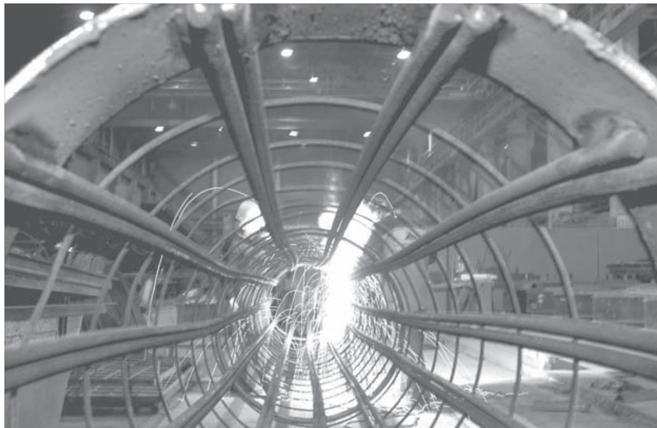
На заводе светит свое солнышко

Когда вы идете по территории завода "Стройкомплект", напрашивается сравнение с домом. В одном цехе здесь вяжут и варят – арматуру, в другом раскраивают – сосны и листовники. Производство относится к разряду вспомогательных, но его работники гордо говорят: "Без нас комбинат не проживет ни дня". Сегодня "Стройкомплект" отмечает свое 50-летие.