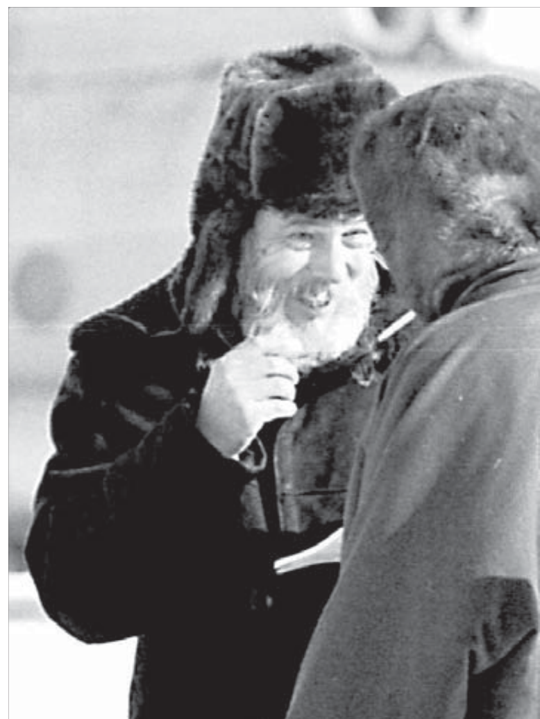
Найти общий язык с жителями тундры для него нетрудно