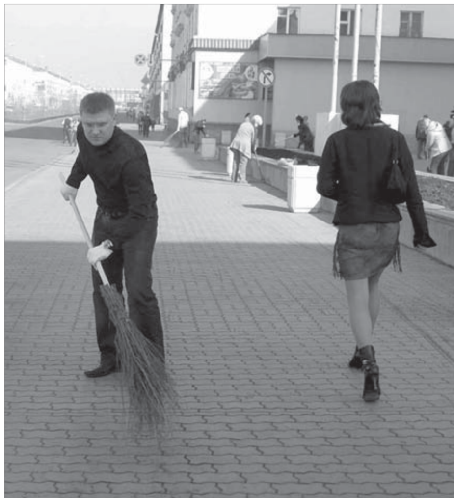
Алексей Текслер: "Сидеть сложа руки неопозволительно"