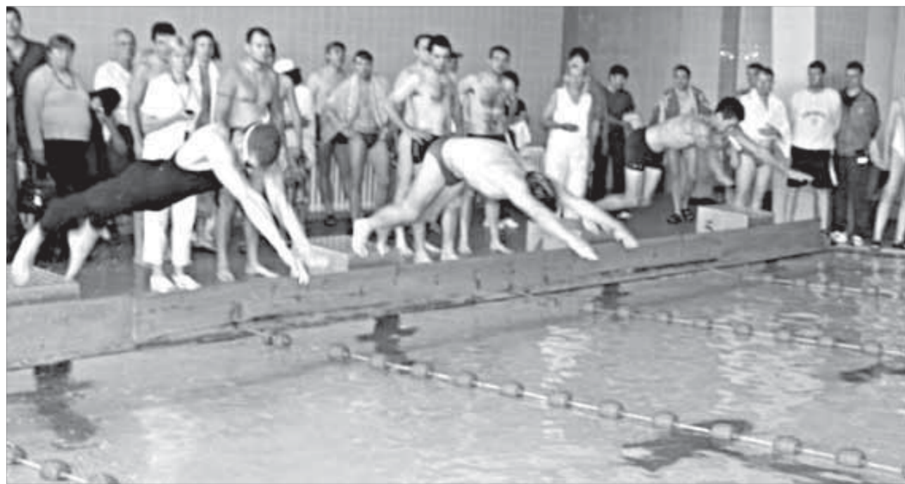
Глубокое погружение – залог успеха