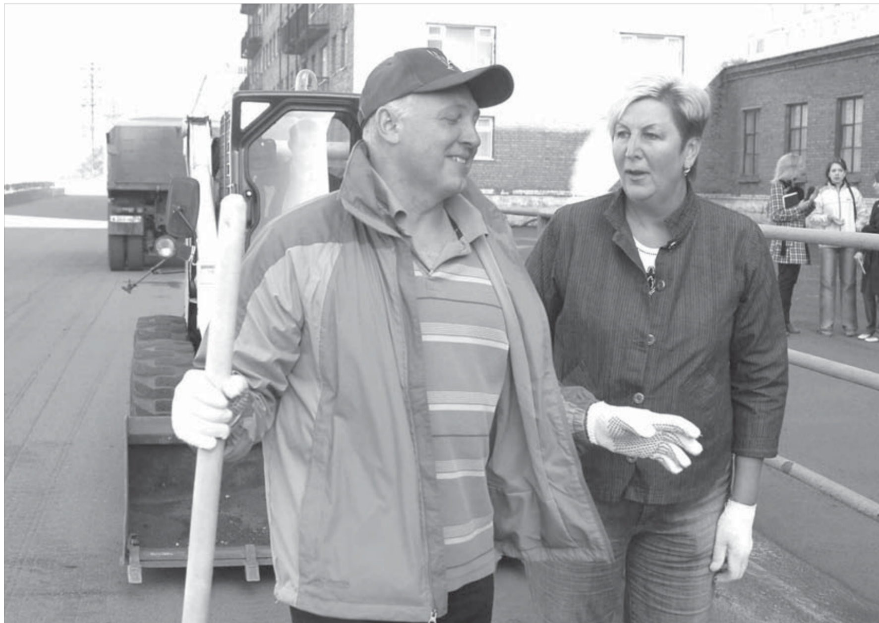
Выхожу один я на дорогу, а там такое...

В Красноярске возбуждено уголовное дело о повреждении памятника истории и культуры. Решение было принято краевой прокуратурой после проверки соблюдения законности реставрационных работ в здании Речного вокзала. Речной вокзал является памятником архитектуры регионального значения более 20 лет. Сейчас же здание принадлежит ООО "Дива". Прокурорская проверка установила, что в здании проводятся работы по реконструкции объекта культурного наследия, то есть затрагиваются несущие конструкции помещения, хотя разрешение на производство ремонтно-реставрационных работ выдавалось службой только на несущие конструкции кровли и замену чердачного перекрытия. В Арбитражный суд Красноярского края направлено исковое заявление ООО "Дива" о приостановлении на объекте культурного наследия "Речной вокзал" всех видов работ, не связанных с противоаварийными работами.