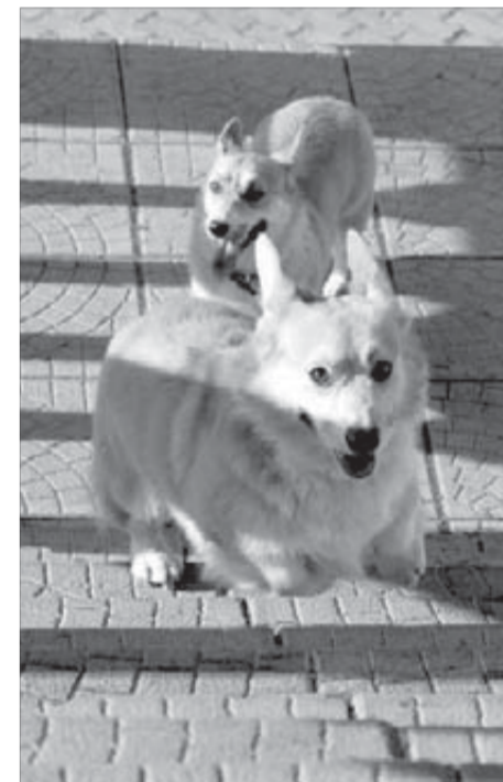
Корги – тоже овчарки. Только маленькие

Большая часть опрошенных ничего не слышала о правилах содержания животных, которые, между прочим, были приняты 30 марта 2001 года избранными норильскими депутатами городского совета. Тем не менее эти правила есть, они действуют на всей территории муниципального образования "Город Норильск". Хотя, если судить по одной площадке у "Черного тюльпана", хозяева животных не только не соблюдают уста-