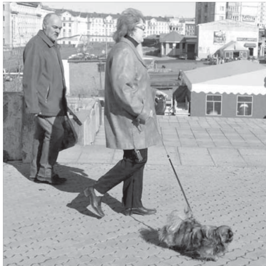
Маленькие собачки не самые опасные

Помощь и консультации специалисты управления потребительского рынка и услуг оказывают бесплатно. Телефоны для контакта 48-45-62, 46-90-28, 37-26-12, 39-27-45.