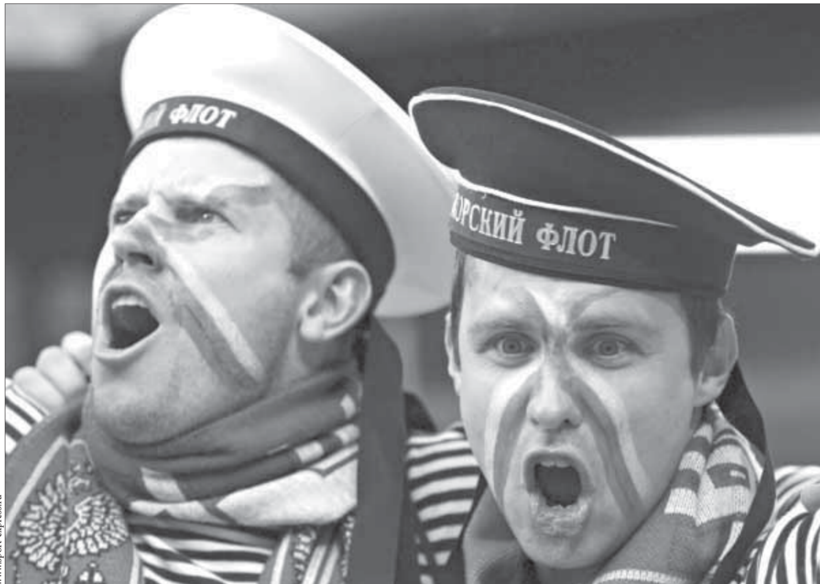
Все пропоем, но флот не опозорим

Из самолета Ту-154, выполнявшего рейс по маршруту Москва - Красноярск, пытался выпрыгнуть пьяный пассажир. Во время полета 40-летний мужчина выпил слишком много спиртных напитков и решил покончить жизнь самоубийством. Он попытался открыть запасной люк и выпрыгнуть из него. Бортопроводники, работавшие в самолете, помешали самоубийце. При этом одного из своих спасителей пьяный пассажир избил. После приземления на борт самолета был вызван наряд милиции, который доставил пассажира в дежурную часть. За свое поведение дебошир был привлечен к административной ответственности, а избитый стюард потребовал еще и уголовного наказания.