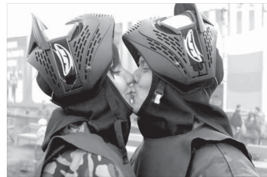
И на пейнтболе есть место чувствам

Первое место досталось команде “Витязь”, второе – “Шаровой молнии” (ОАО “НТЭК”). Замкнула тройку призеров команда “Основная площадка”. Победители получили кубки и дипло-