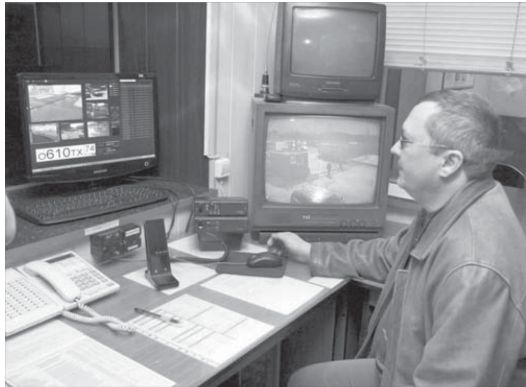
Система автоматического видеонаблюдения в действии

Принцип действия радаров основан на законах физики. Радиолокационный измеритель скорости излучает электромагнитный сигнал,