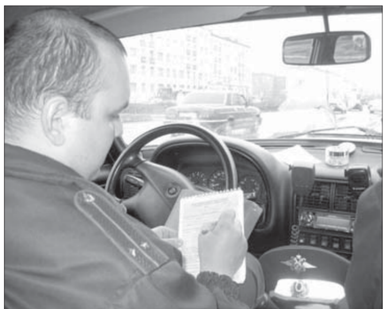
Пачка штрафных квитанций таяла на глазах