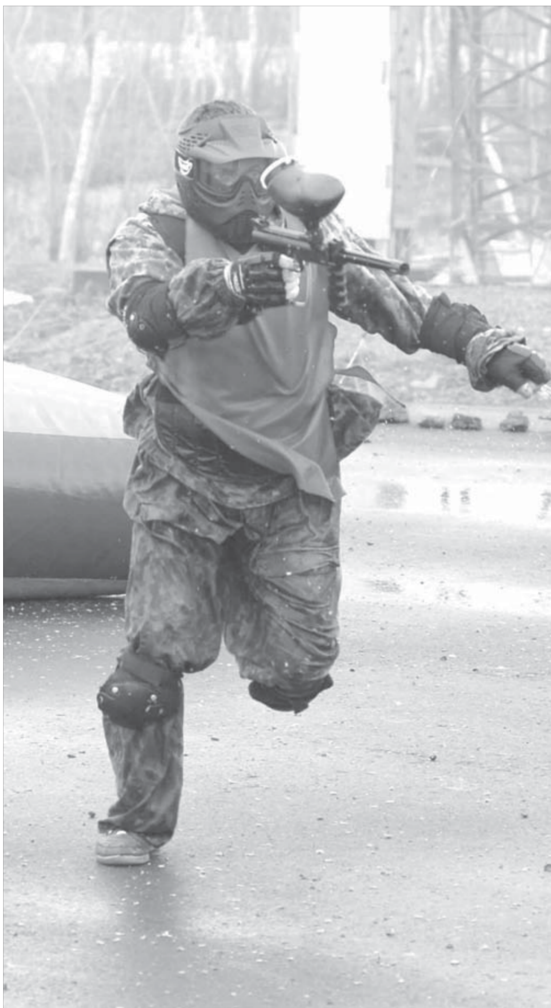
Бежать надо быстро, стрелять – метко. Тогда “выживешь”