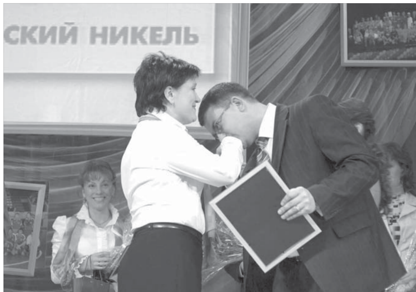
Дамы еще и ручки целовали