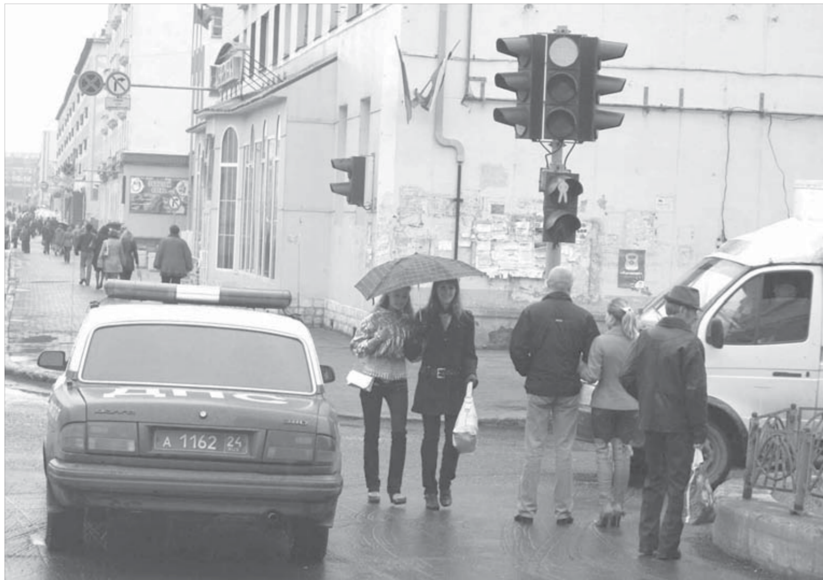
Мимо патрульной машины ГИБДД на запрещающий сигнал светофора потоком шли люди