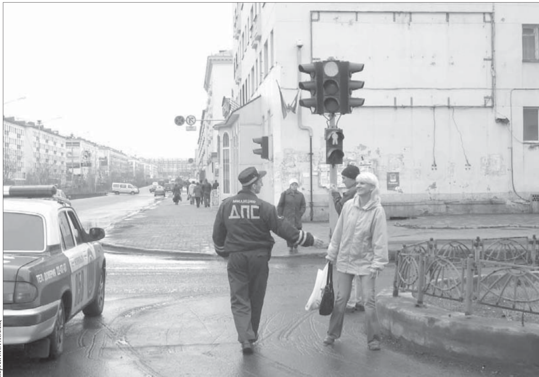
Система автоматического видеонаблюдения по-норильски

С 1 июля на Таймыре начнет работу трудовой отряд старшеклассников Красноярского края (ТОС). В него войдут 20 школьников из Хатанги, 10 из Караула, а также 49 юношей и девушек из Дудинки. В основном это ребята из малообеспеченных семей, подработки, состоящие на учете в органах внутренних дел, а также дети-сироты. В общей сложности зарплата тосовца составит более пяти тысяч рублей. Помимо этого старшеклассник получит трудовую книжку с первой записью.