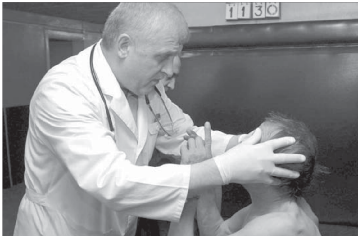
"Покажи-ка доктору глазки..."

Мощность норильского медвытрезвителя неизменна уже много лет – 21 койко-место. Матрасы для особо невменяемых граждан лежат прямо на полу – чтобы в пьяном бреду не упали с кровати и не разбились. Имеется и особое приспособление – "пьяный трон", а если говорить протокольным языком – кресло для принудительного удержания особо буйных клиентов. Крепкое металлическое кресло действительно напоминает своим видом трон. Ноги буйна фиксируются ремнями к его ножкам, а руки – к подлокотникам. Но применяют это приспособление в исключительных случаях.