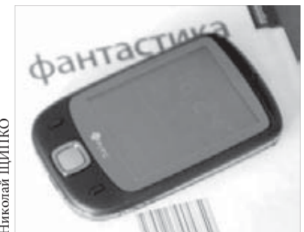
"ЗВ" фантастика станет реальностью

Свой юбилей город будет отмечать в середине июля. Городские власти уже несколько месяцев разрабатывают программу празднования. "Заполярный вестник" также решил принять самое активное участие в подготовке празднования и напомнить горожанам некоторые вехи в истории Норильска. Компания "Билайн" была выбрана в качестве партнера не случайно.