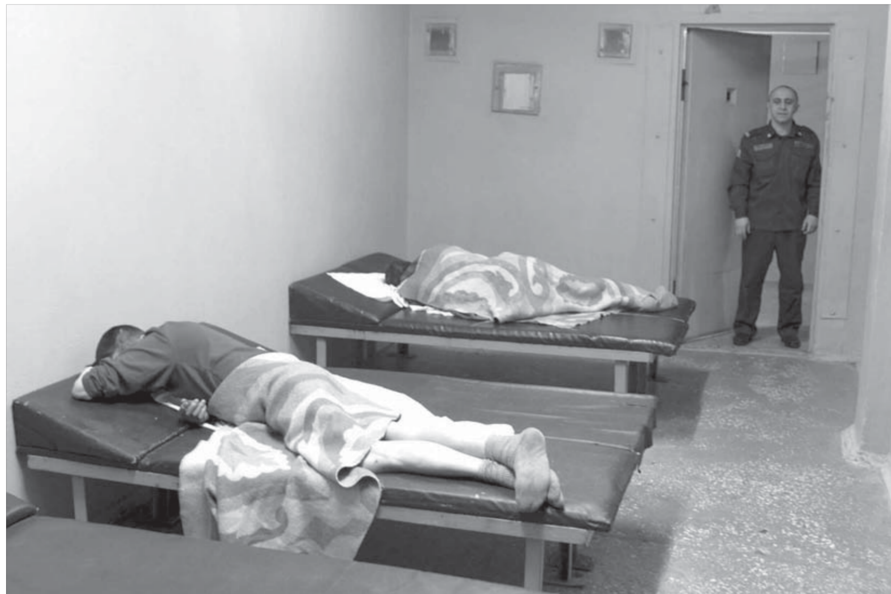
Сегодня в палатах просторно – ложись хоть поперец кровати