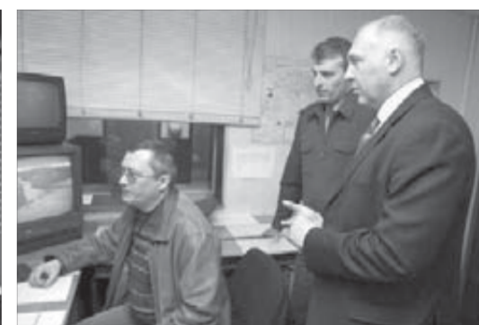
Видеосистемы работают, но видно на них не все