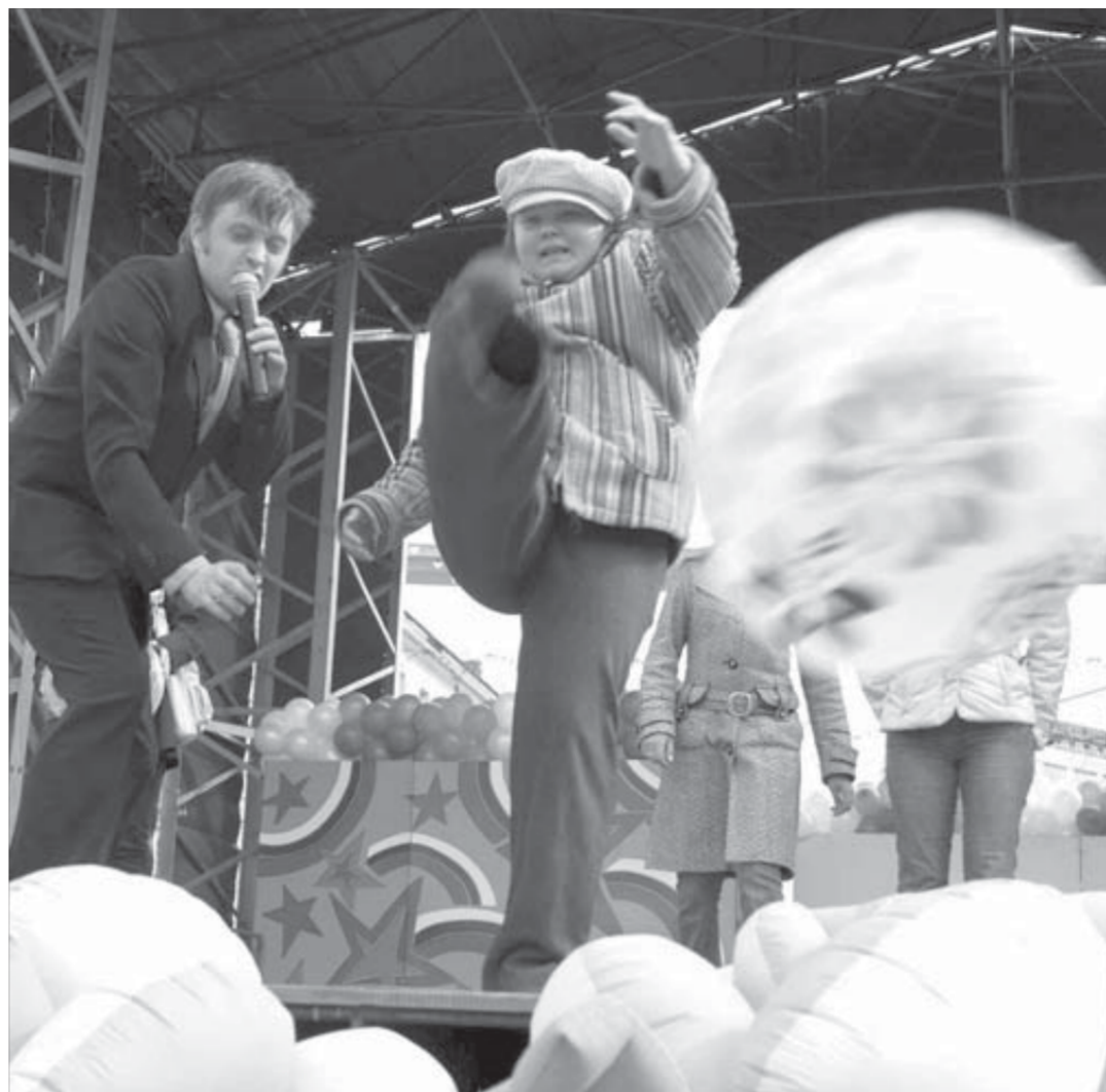
На сцене “зажигали” кавэзнички и любительницы футбола

А потом началась дискотека. Кто-то пустился в пляс под современные хиты. Кто-то наблюдал со стороны, дожидаясь шашлык. Выездная торгов-