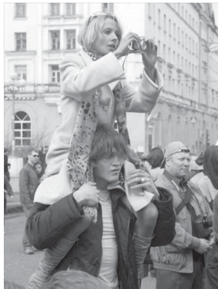
Высоко сижу – далеко гляжу