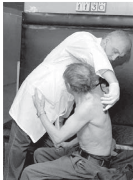
Для постоянных клиентов медвытрезвителя нет скидок и дисконтных карт

службе - сначала в Афганистане, а потом еще в трех горячих точках. - Как вы относитесь к Дню России? - спросили мы служивого-ветерана. - Хорошо отношусь. Если б не одно но... И прочел нам неожиданно грамотную (для человека, пьющего пиво из горла на бетонной ступеньке) лекцию об отторгнутых, по его мнению, у России областях, отошедших к Казахстану, Украине и т. д. - Я из казаков, - сказал нам бывший военный. - И в каких границах была Российская империя, знаю хорошо. Я за День России, но в прежних границах. После восьми часов вечера на норильских улицах почти не осталось людей. Киоски и палатки свернули и так не особо бойкую торговлю, а на проезжую часть вышли люди в оранжевых жилетах с метлами. Спросили у таксиста, подвозившего нас в медвытрезвитель, почему, по его мнению, народу на улицах почти нет? - Так холодно, - ответил он.