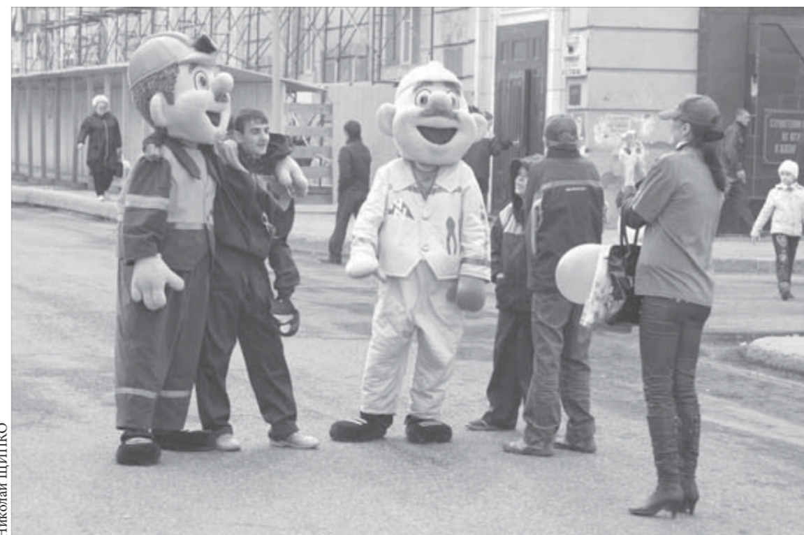
Ростовые куклы пользовались популярностью