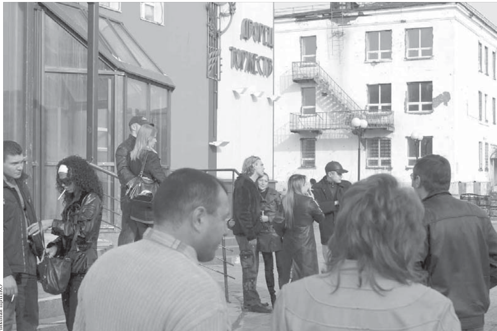
К 9.00 женихи и невесты собрались у загса

В Красноярске появился специализированный перевозчик – детское такси, в котором несовершеннолетние могут ездить без сопровождения взрослых. Весь автопарк новой таксофирмы разрисован яркими мультяшными героями, а внутри оборудован специальными детскими креслами. Водитель при необходимости может сопроводить малыша до школы, секции или побывать с ним на прогулке. Руководитель фирмы гарантирует, что таксисты не будут курить в присутствии детей, а также включать "тирёмную" музыку. Оплата в детском такси договорная.