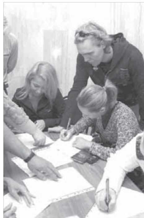
Сначала нужно написать заявление

В Талнахский загс заявления на 8 августа принесли пока пять пар, в Кайерганский – четыре. У них вчера все было спокойно.