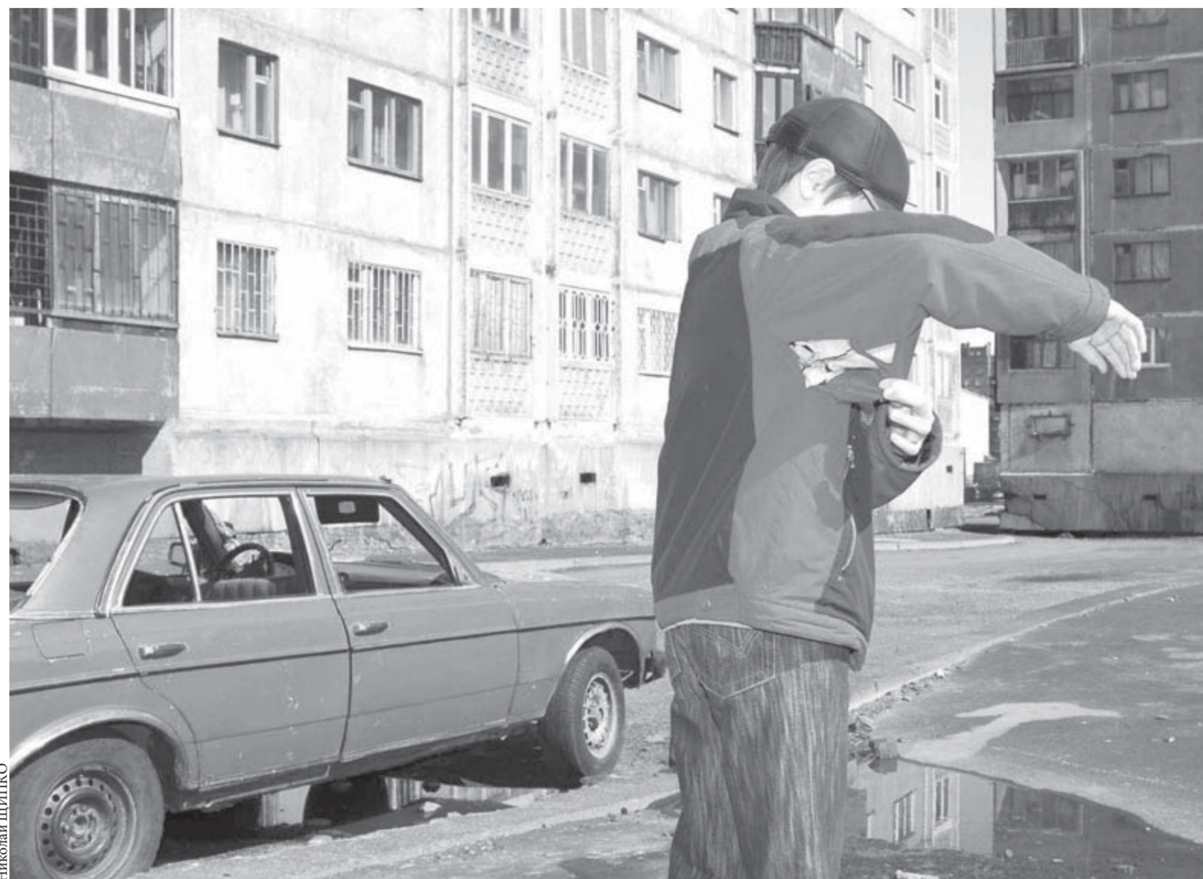
Рука спасена. Но куртка – на выброс

Подписчикам самых востребованных многотиражных федеральных изданий ФГУП «Почта России» предоставляется скидка в размере 25% от базового тарифа, действовавшую в первом полугодии 2008 года. А подписчикам многотиражных областных, краевых и республиканских изданий сохраняются скидки, предоставленные им в первом полугодии.