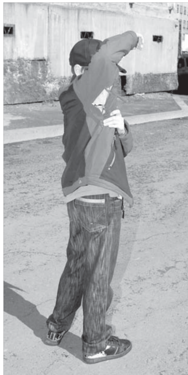
По этой улице Паша теперь ходит боится

Это уже не первый случай в Норильске, когда собаки беспричинно набрасываются на людей