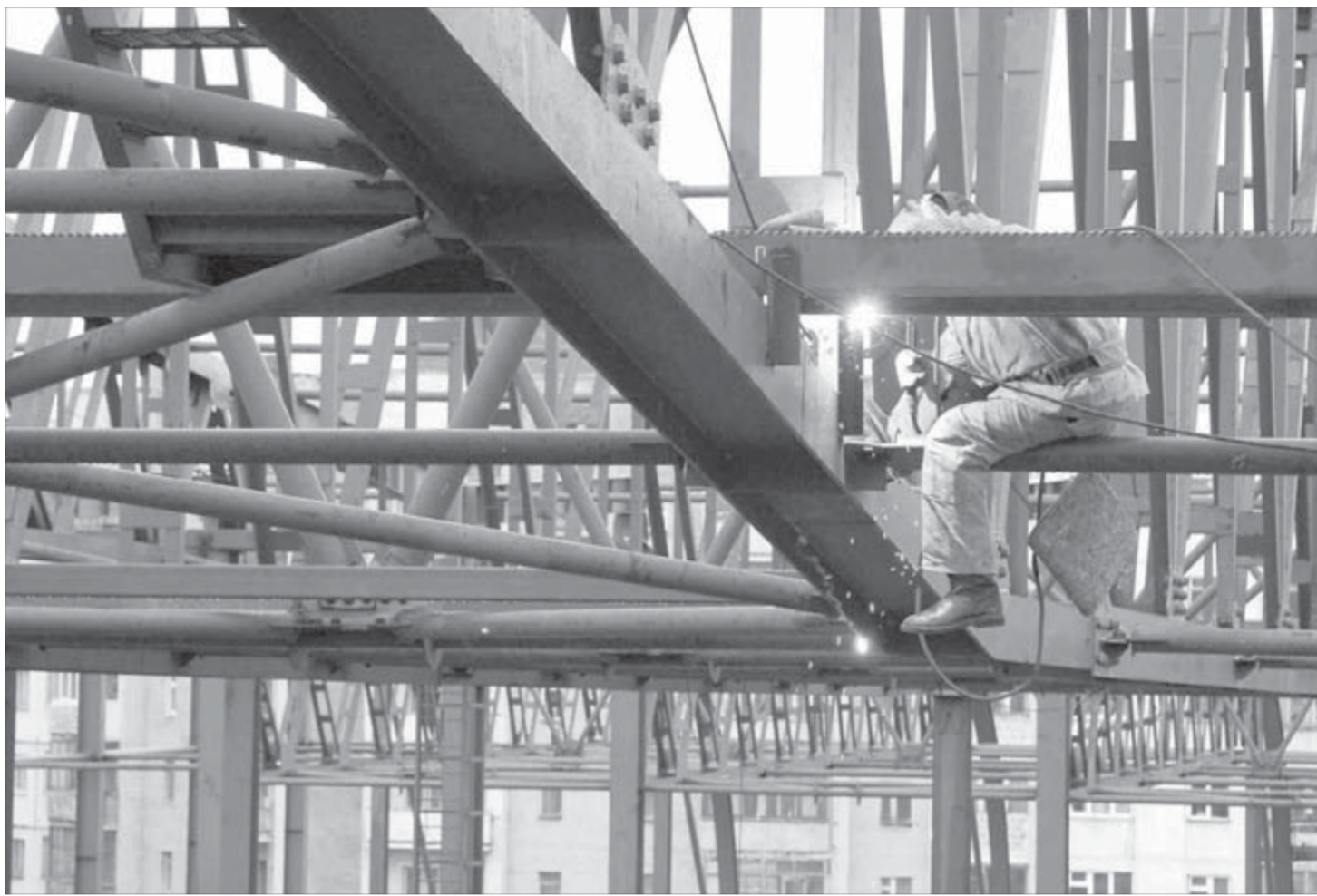
"Арена-Норильск": работа кипит и искрит

Напомним, по самому первому проекту генеральным подрядчиком строительства должна была стать финская фирма Skanska – ведущая мировая компания в области строительных услуг. Но она не взяла на себя ответственность за устройство свайного фундамента на вечной мерзлоте – сказывался недостаток подобного опыта. Проект пришлось перерабатывать и искать нового генподрядчика. Им стала московская фирма "Альбион М".