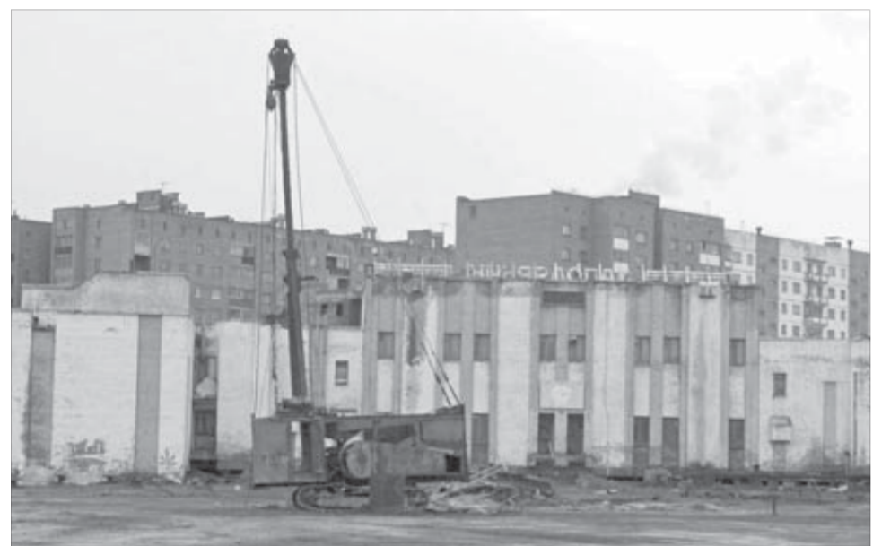
"Заполярьник": тишь да гладь

Напомним, что новые примерные сроки сдачи объектов в эксплуатацию определены: "Арена-Норильск" – до лета 2009 года, купол над "Заполярьником" – конец 2009-го – начало 2010-го.