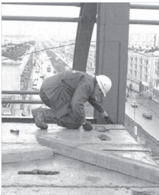
С этой точки до земли 24 метра