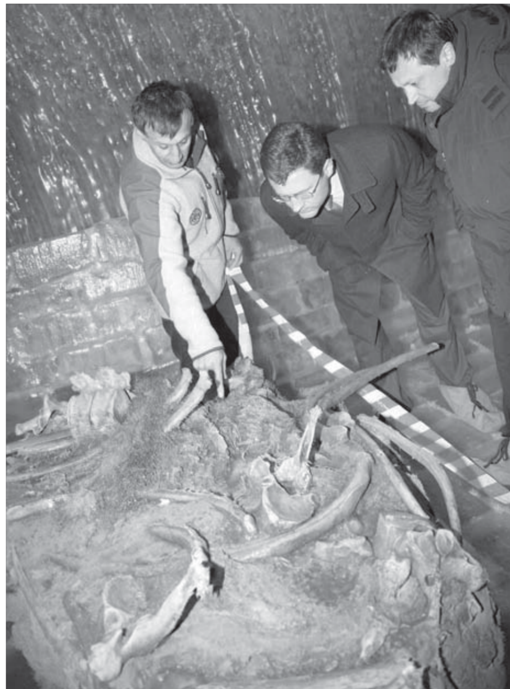
Заместители красноярского губернатора с интересом изучают останки древнего зверя

В Диксоне погода остается нелетней. Поселок Сындыаско тоже не готов принять вертолет, дежурящий в аэропорту на случай поездки в это отдаленное село. Совещание в