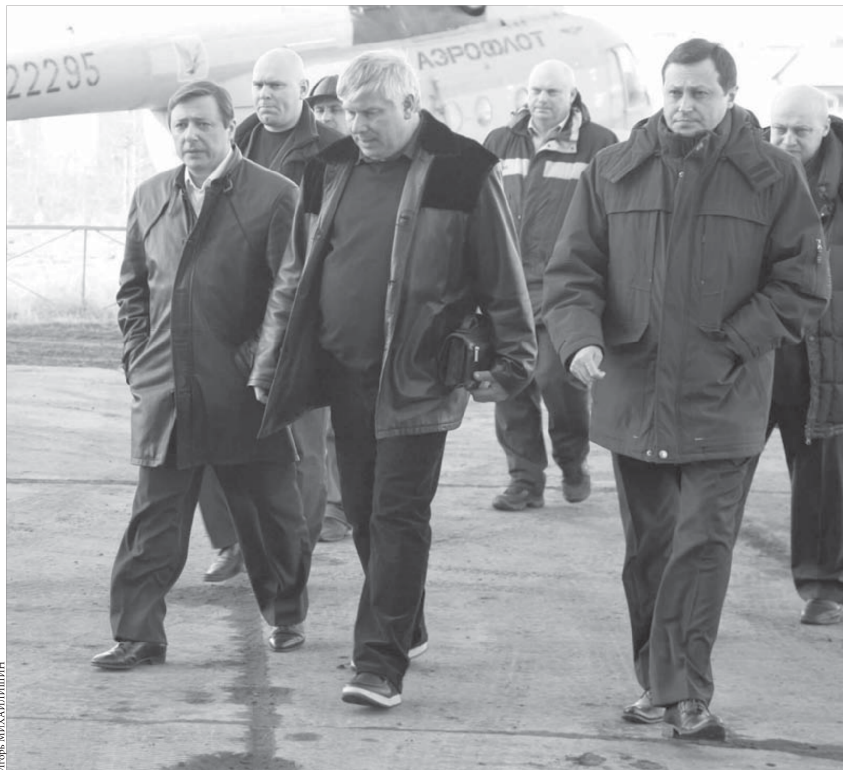
Губернатор Хлопонин и его команда настроены решительно. Проблемы Северов надо решать

Со дня на день ледоход дойдет до Дудинки, об этом "Заполярный вестник" сообщили в Заполярном транспортном филиале "Норильского никеля" (Дудинский морпорт). За сутки, прошедшие с пятницы, уровень воды в Енисее упал на 1 метр 10 сантиметров и составил 12 метров 72 сантиметра. Ледоход остановился в 40 километрах от Дудинки, в районе поселка Потапово.