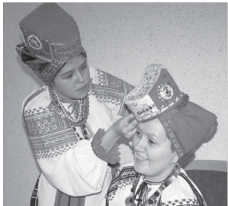
Наряд – дело серьезное

Оригинальные вещи, бытовавшие на Руси в конце XVIII – начале XIX веков, студенты собирают в этнографических экспедициях. Там же записывают фольклор: старинные малозвестные песни и частушки. Этим летом едут в Карагузский район Красноярского края. Нынешняя экспедиция станет третьей по счету.