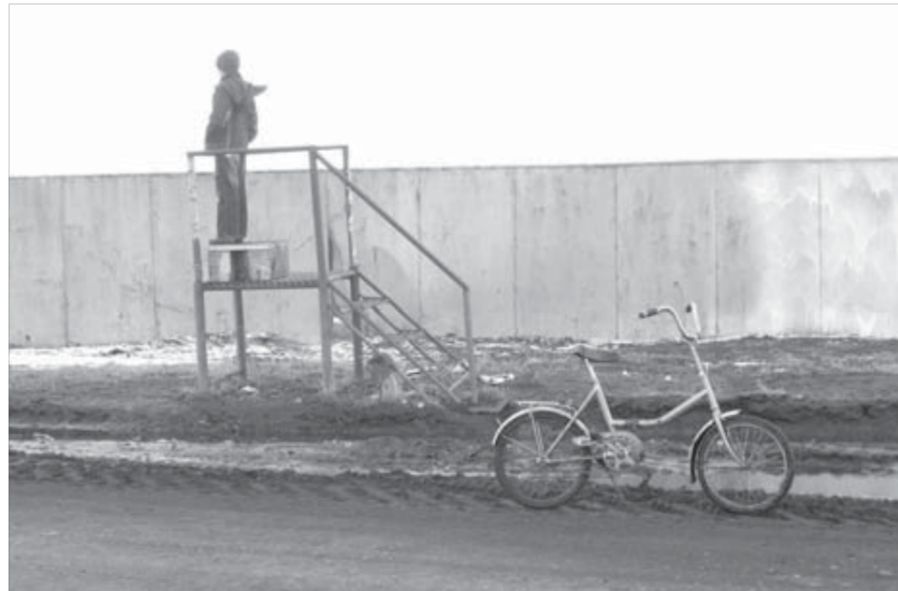
Какой он, этот никогда невиданный материк?

Хороша ли в Норильске жизнь? Это смотря с какой стороны взглянуть. С Севера или с Юга.