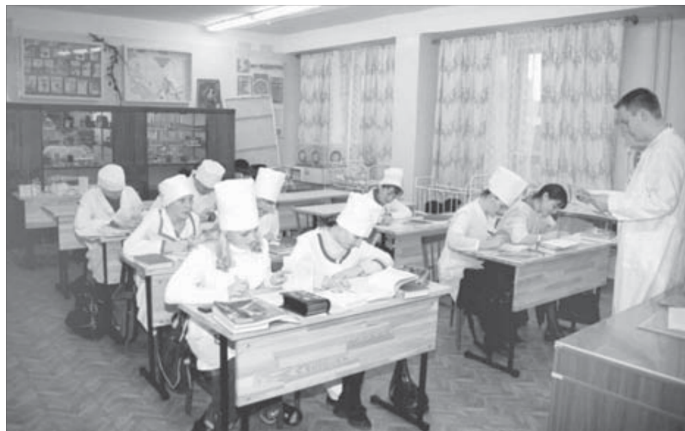
За этими столами занималось не одно поколение медсестер