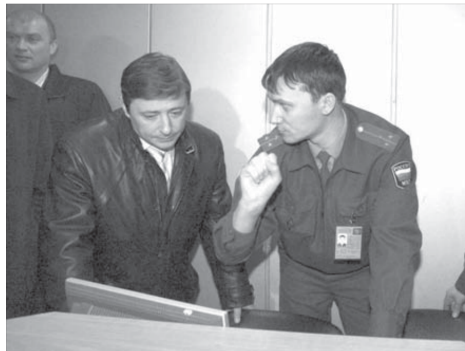
Систему «Таймыр» установят теперь и в Красноярске

Более подробная информация о конкурсе размещена на интернет-портале «Красноярский край» www.krskstate.ru .