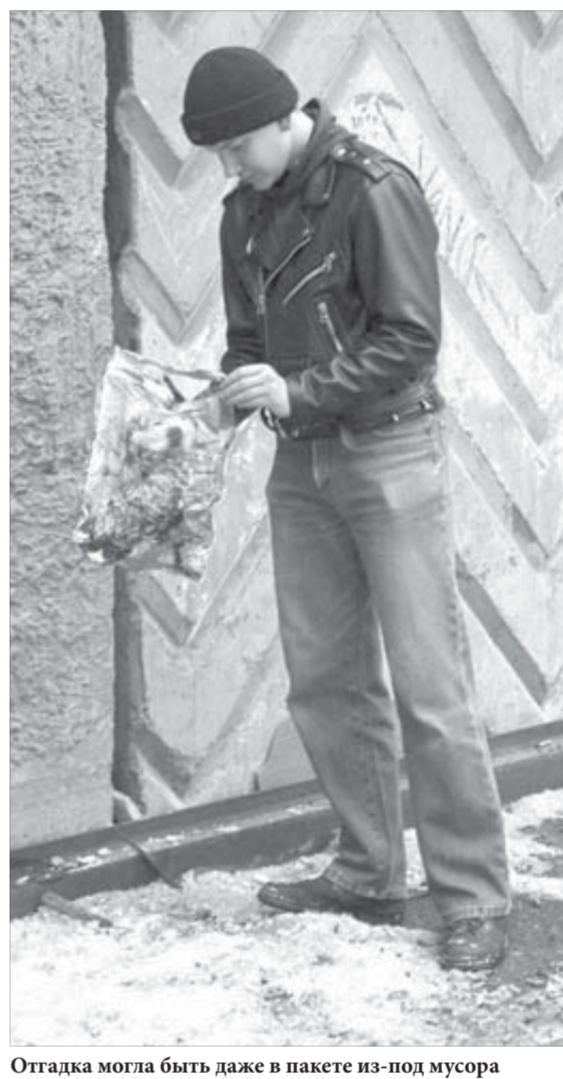
Отгадка могла быть даже в пакете из-под мусора

Весело живут в "Единой России". За партию, в которой даже не лидеры, а просто сочувствующие обладают такими светлыми головами и незаурядной ловкостью рук, я спокоен!