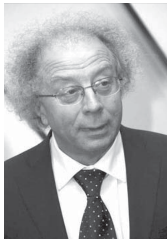
Генеральный директор прилетел на юбилей с командой ветеранов