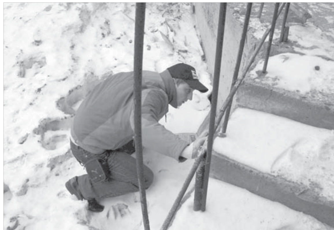
"Молодогвардейцы" и по подвалам лазили, ища ответы