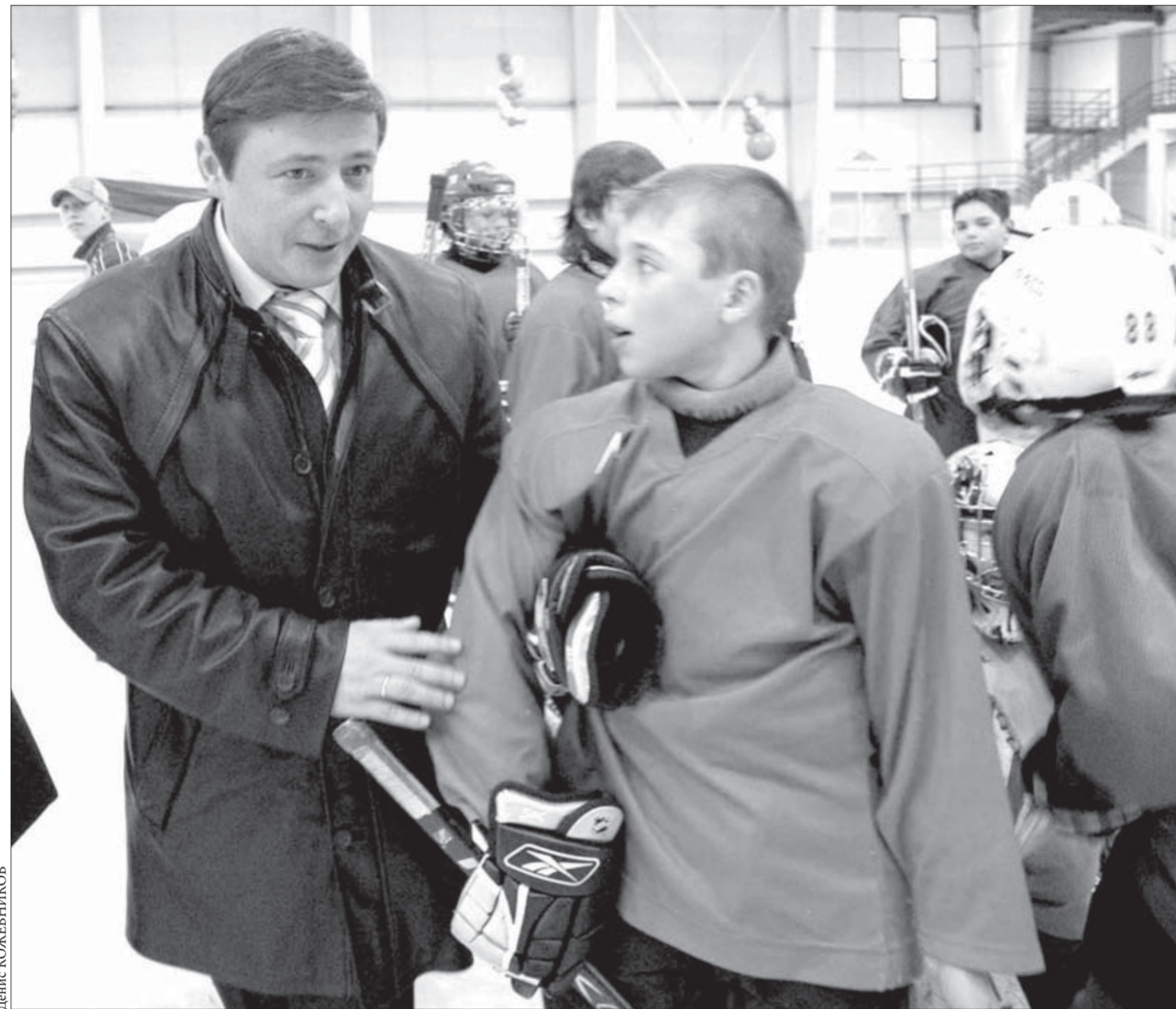
С утра губернатор отправился на каток