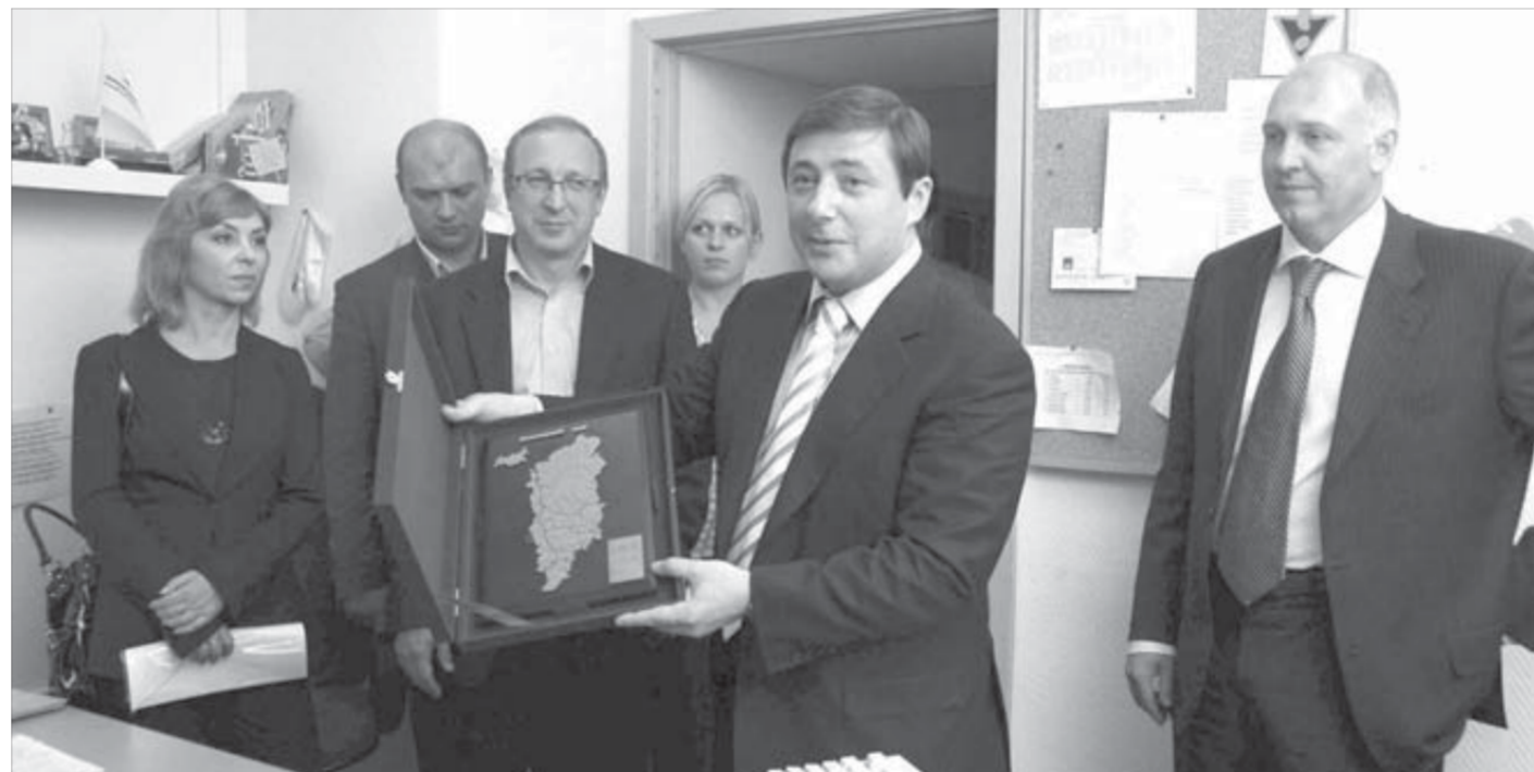
Подарок юбилярам из «Северного города»