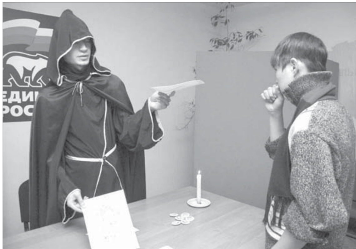
Мастер часто ставил участников в тупик