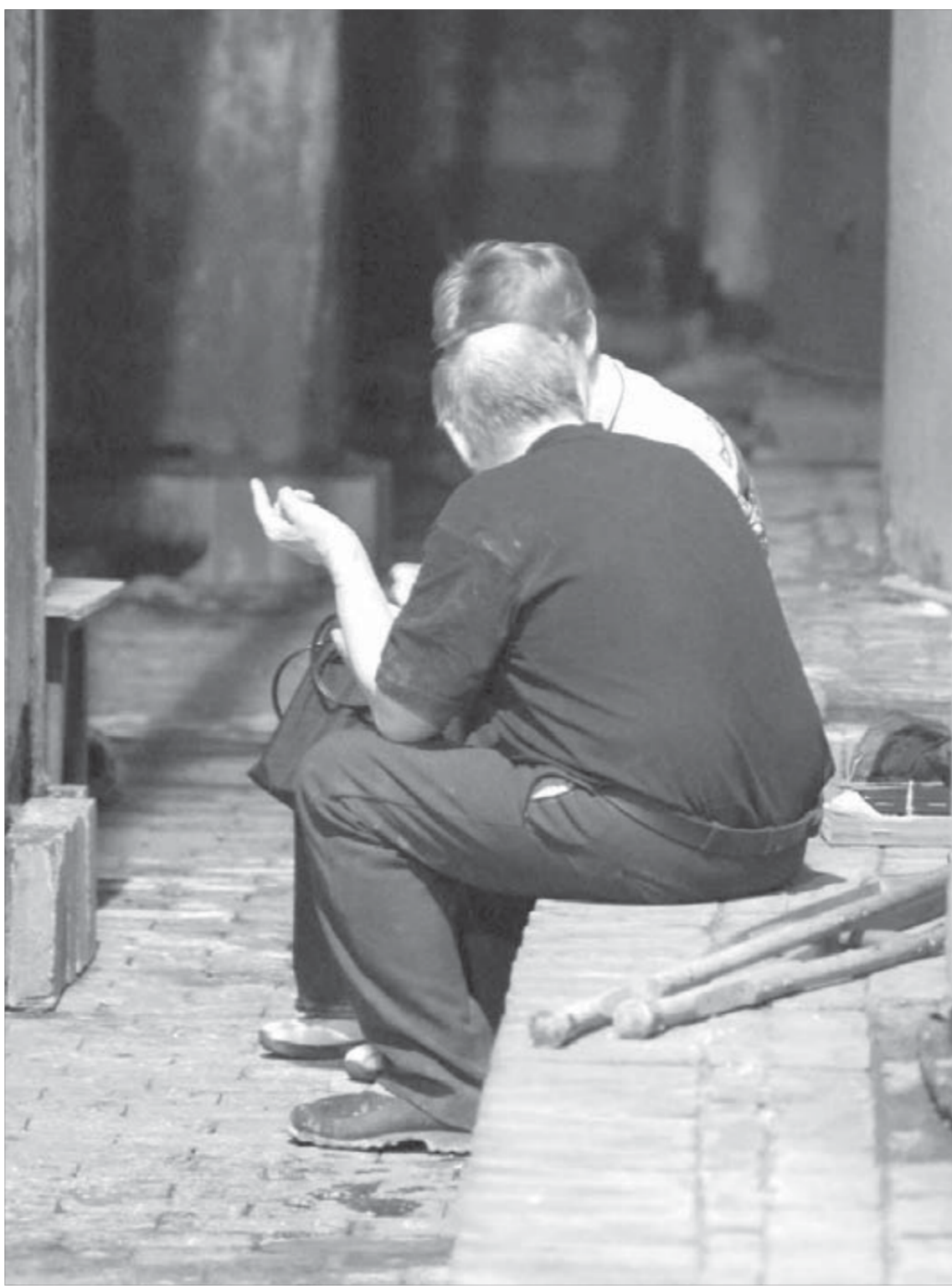
Бездомный из ХКЦ стесняется показать свое лицо