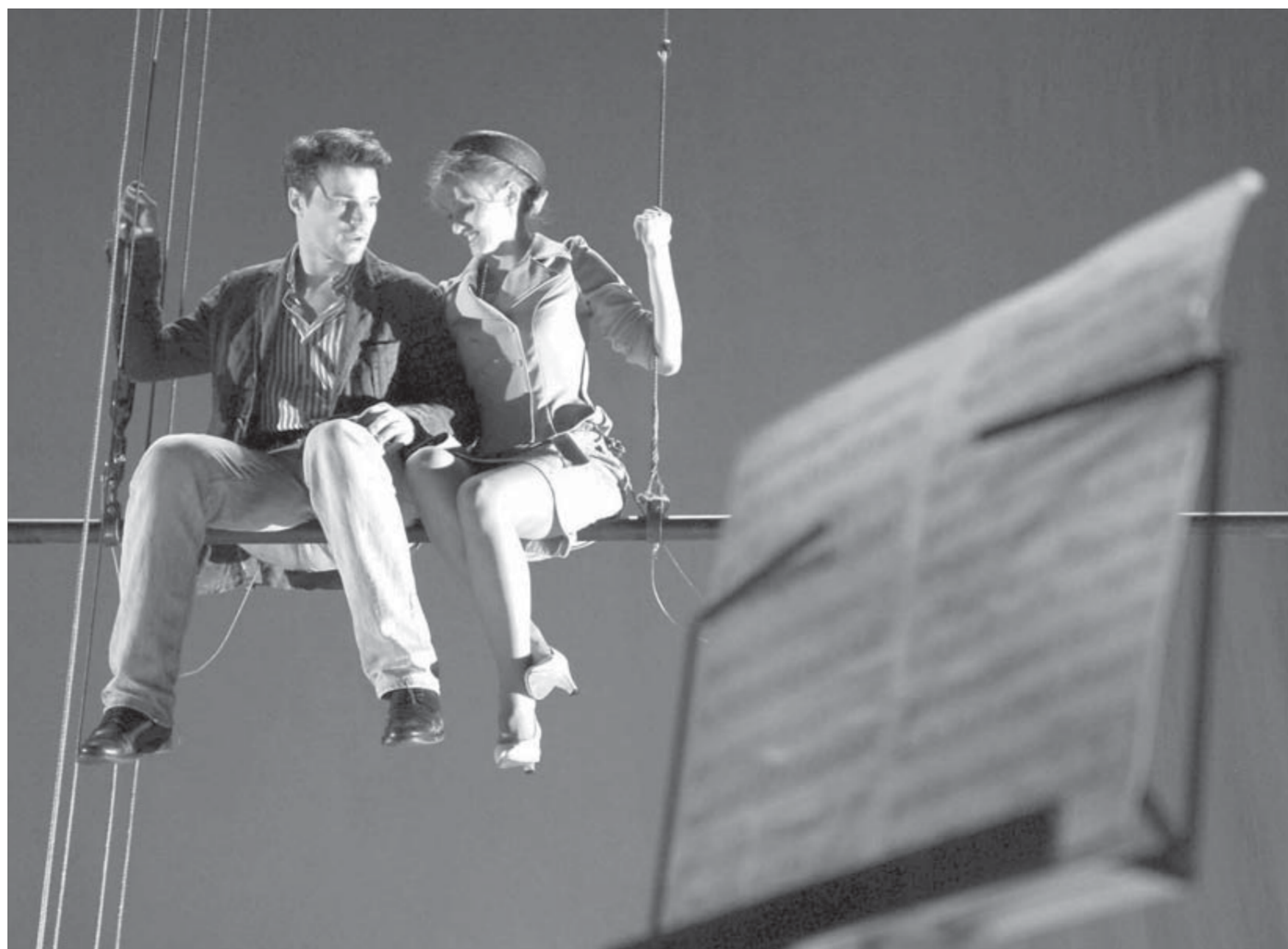
Полет наяву спустя 10 лет

был забит юношами и девушками. Если бы они не испытывали тех же чувств, что и герои, они бы не приходили.