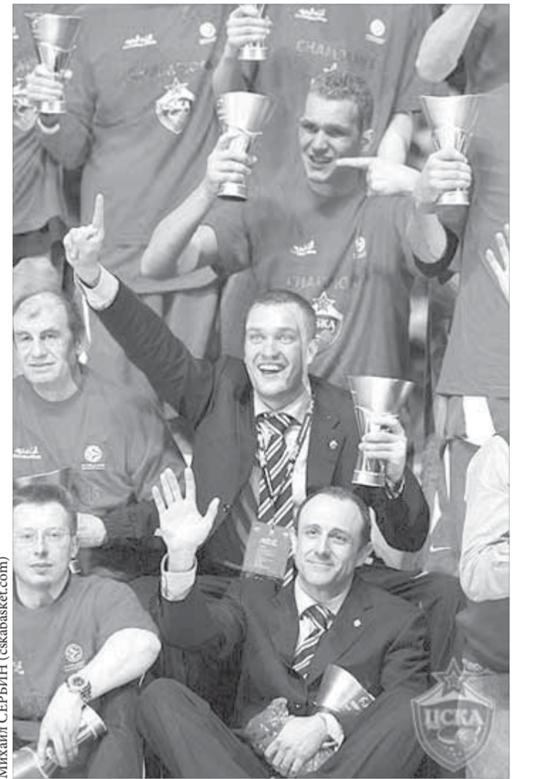
Самый успешный проект Прохорова – двукратный чемпион Евролиги баскетбольный ЦСКА

– Что касается будущего, то я уверен, что будет найдено решение, которое позволит сохранить этот проект. В каком формате, с какими источниками финансирования, с каким составом акционеров – это большой вопрос. Думаю, сегодня всем надо набраться терпения и ждать, – заключил генеральный директор.