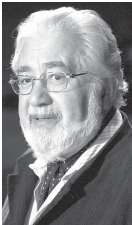
“Спектакль – живое существо и всегда проходит по-разному”

Впереди еще одно свидание – в Москве, еще через 10 лет. К тому времени “молодые люди уже