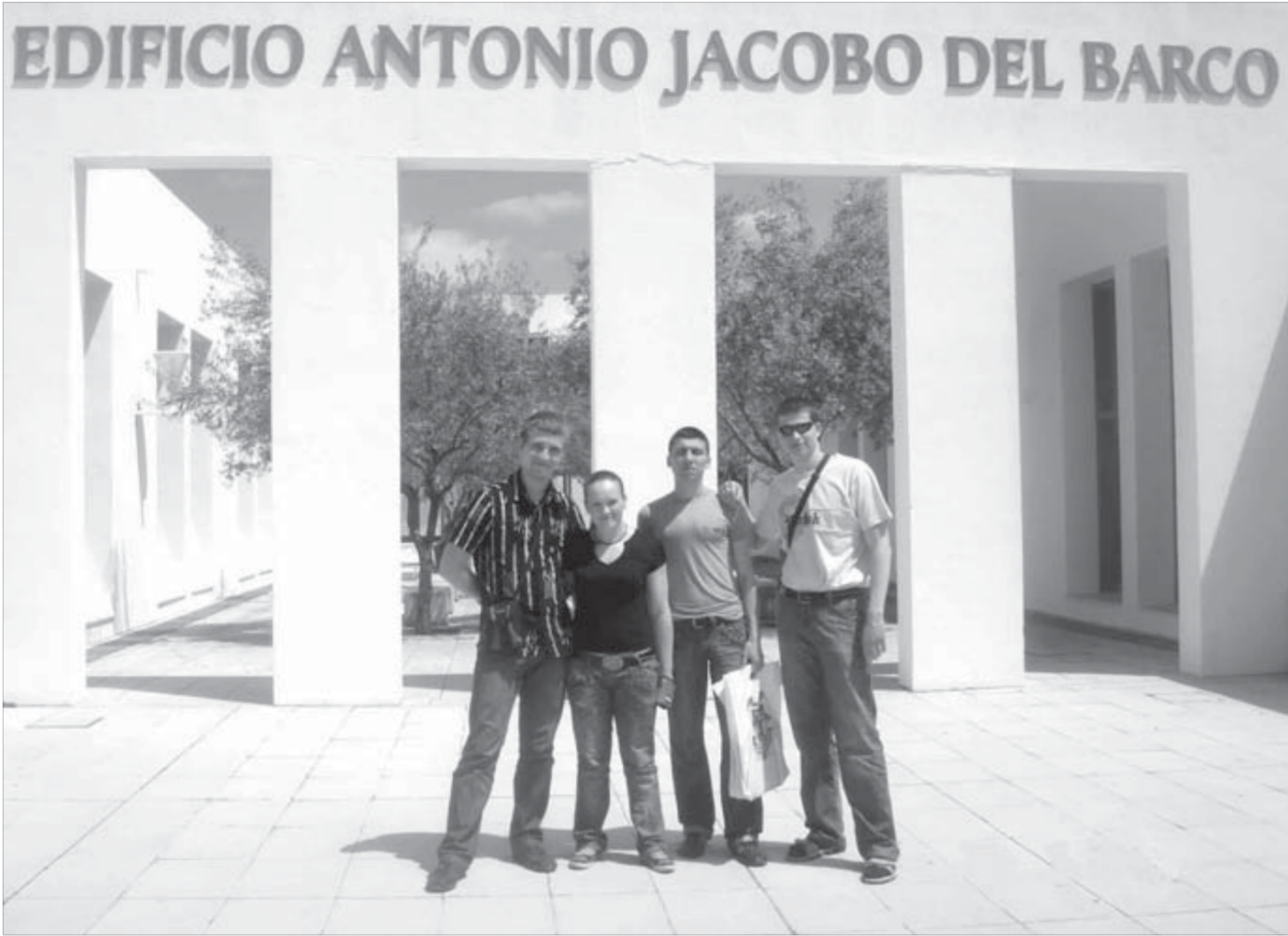
Университетский городок в Уэльсе