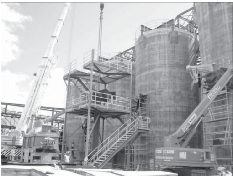
Завод сдадут в августе

Сравнивая предприятия Норильска и Испании-Португалии, студенты сошлись на том, что все они используют одинаковую технологию производства. Разница лишь в том, что зарубежные заводы, фабрики и рудники более автоматизированы, экологичны и чище. Запах сернистого газа там не ощущается – ни в цехах, ни в городе. Более того, многие производства сосредоточены всего в нескольких десятках километров от курортных зон. Однако вокруг чистота! Экологии здесь уделяется огромное значение – правительство и народ оказывают очень сильное влияние на правила ведения металлургического производства. У них жесткие экологические нормы, невыполнение которых влечет за собой огромные штрафы, а то и закрытие предприятий.