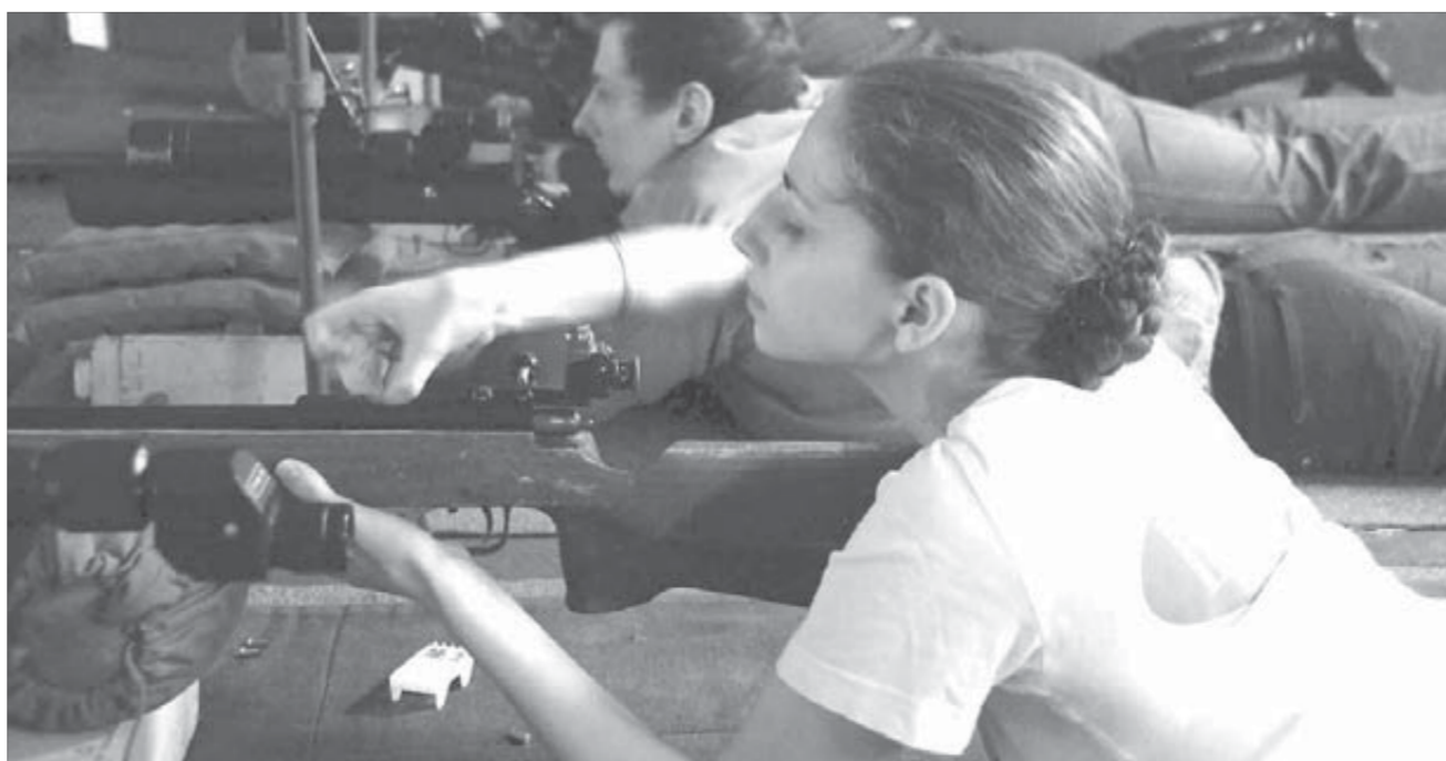
Забьем снаряд в винтовку туго...