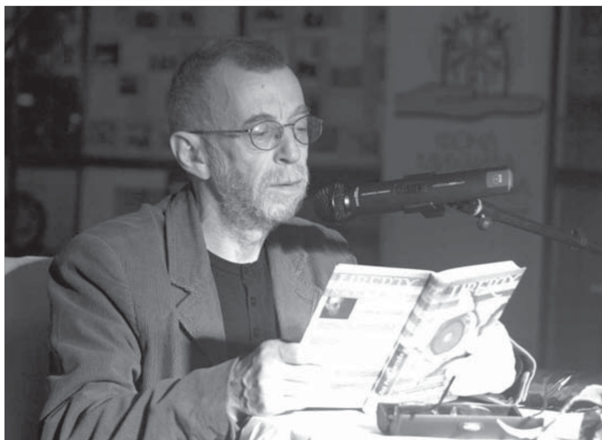
Лев Рубинштейн на встрече с норильскими читателями