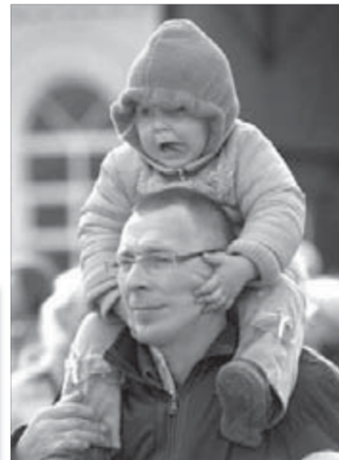
И для детей будут подарки!

Высылайте ваши предложения на электронный адрес газеты “Заполярный вестник”, информационного партнера фонда: vesti@nrd.ru , звоните по телефону 46-59-00. Ваше мнение обязательно будет принято во внимание.