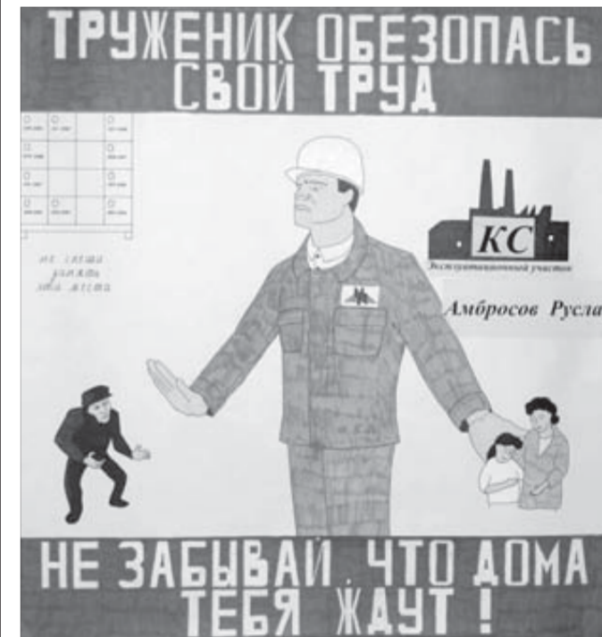
“Черного человека” на “Надежду” не пустят

Сегодня на Надеждинском металлургическом заводе чествуют и награждают участников и победителей двух конкурсов. Будут поощрены авторы плакатов по ТБ и лучшие структурные подразделения.