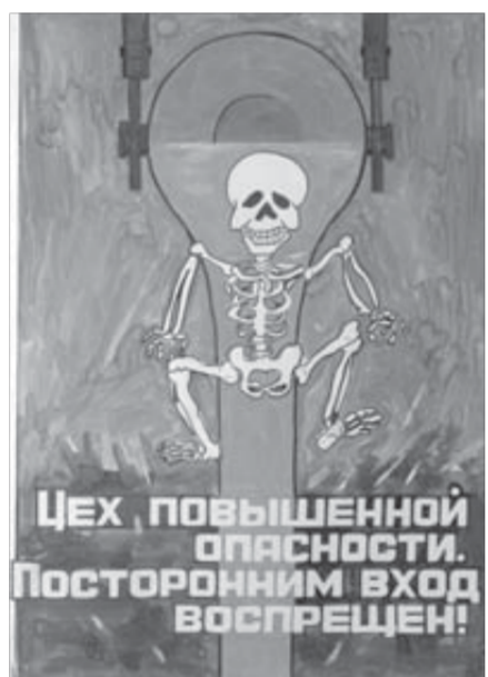
Плакат Аладдина Бахшалиева

Конкурс проводился при участии «Женского взгляда» Норильского никеля». Участницы проекта подготовили для «надеждинцев» концерт и подарки от Заполярного филиала «Норильского никеля».