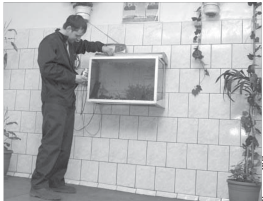
Аквариум повышает культуру производства

По степени важности конкурсантов поделили на три группы. Лучшими в первой группе цехов (основных) признаны плавильный участок №1 плавильного цеха №1 и гидрометаллургический участок цеха по производству элементарной серы. Во второй