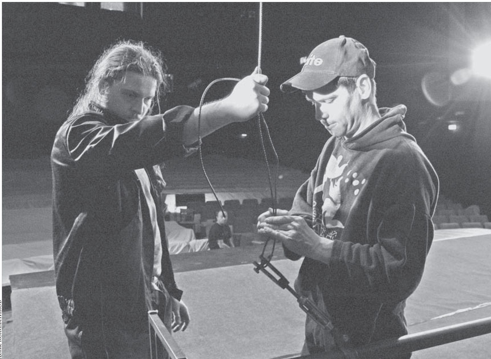
На норильской сцене питейцы чувствуют себя уверенно

Компания “Билайн” провела исследование среди своих абонентов в Сибирском регионе и выяснила, в каких странах предпочитают отдыхать клиенты. В 2007 году Турция была наиболее популярна среди абонентов оператора связи. В первую пятерку также вошли Германия, Египет, Франция и Таиланд. На шестом и седьмом месте Китай и Италия, далее идут Испания, Польша, Чехия.