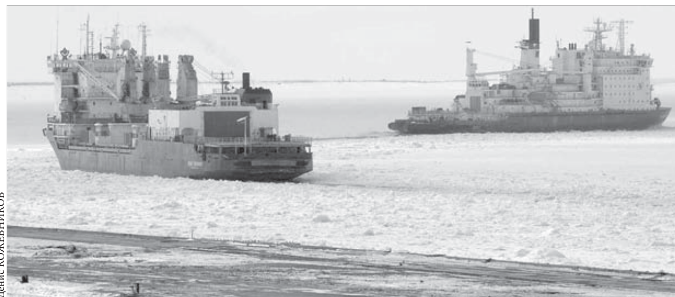
Последние суда покидают морской порт

работа Дудинского морского порта временно приостанавливается на период паводка. Вся перетурочная техника и порталы краны выведены с причалов и подняты на безопасную высоту согласно регламенту работы предприятия. Порт возобновит свою работу в середине июня, приступив к обработке морских судов сначала в рейдовом режиме, а с середины июля, после восстановления причалов, в штатном.