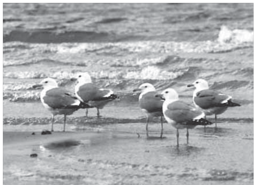
Серебристые чайки предпочитают держаться вместе