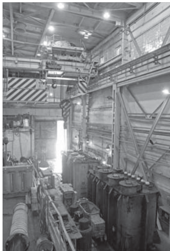
Эти стены помнят Завенягина

– Самой сложной была работа, когда в 97-м после пожара мы восстанавливали печные трансформаторы в плавильном цехе никелевого завода. Вопрос стоял