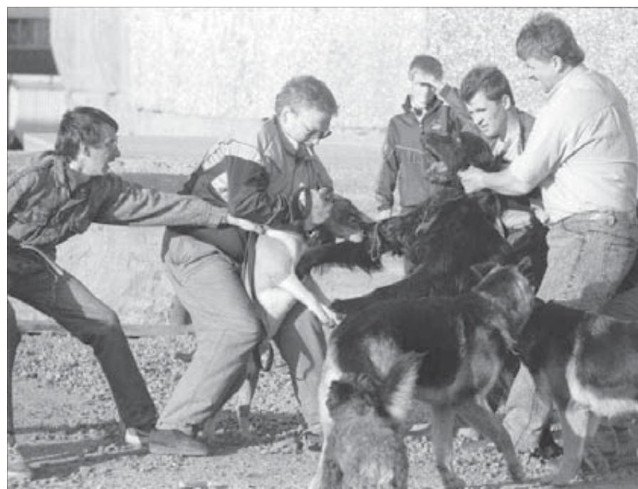
От собачьих потасовок человеку нужно держаться подальше

Год от года растет в Норильске число укушенных животными людей. В 2007-м за медицинской помощью обратилось 500 человек, с января по апрель 2008 года уже зарегистрировано 106 норильчан с укушенными ранами.