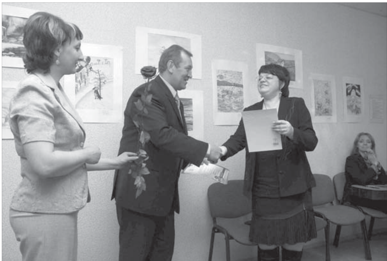
Награды тем, кто едет за туманом

Этой наградой сравнительно недавно был отмечен весь коллектив заповедника – за честь, доблесть, созидание и милосердие. В адрес сотрудников прозвучало много теплых слов от друзей и партнеров. Среди пожеланий немаловажным было следующее: "Желаем вам финансирования, достойного миллионов ваших квадратных метров".