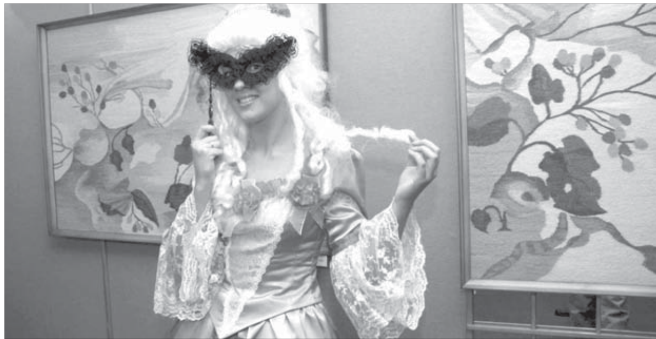
На выставке показали лучшие работы

Во Дворце культуры компании открылась юбилейная выставка "Волшебных нитей колдовство" студии "Гобелен".