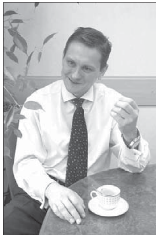
"Норильск меня не отпускает"

Как минимум каждый второй норильский мужчина — фанат тундры. Только что