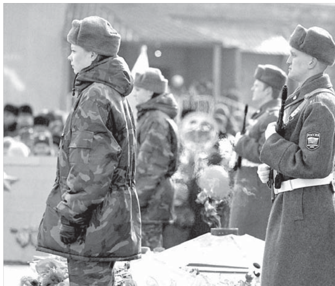
По традиции в почетном карауле будут и норильские школьники

Для жителей города будут работать 10 полевых кухонь (шесть в Норильске, по две в Талнахе и Кайеркане), а также организована уличная торговля.