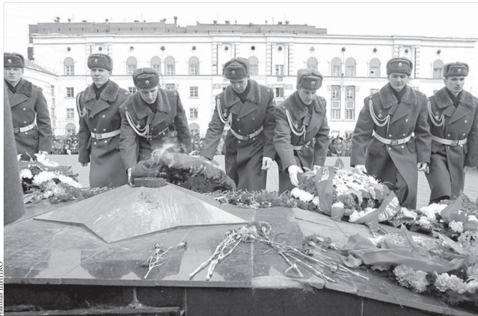
Наша память будет жить вечно

Вчера в Красноярске стартовала красная научно-практическая конференция "Профилактика употребления психоактивных веществ в подростково-молодежной среде". На 1 января 2008 года в крае зарегистрировано 12 587 потребителей наркотических средств, из них 2119 – в Норильске. Один из 25 наркоманов несовершеннолетний. Впрочем, по данным мониторинга, реальная численность потребителей наркотиков по краю превышает официальную в 6,7 раза, и процент несовершеннолетних среди наркоманов тоже больше. В конференции принимают участие представители Агентства здравоохранения Красноярского края, ученые кафедры психологии Московского государственного медико-стоматологического университета и Красноярской государственной медицинской академии, практикующие врачи-психиатры и наркологи, психотерапевты, медицинские психологи.