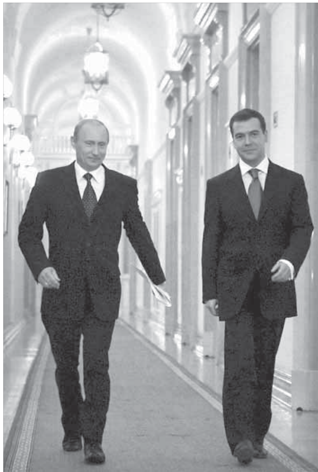
Впервые в истории бывший президент присутствовал на церемонии инаугурации нового

Дмитрий Медведев вступил в должность президента Российской Федерации