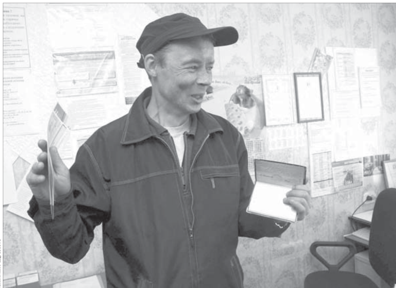
Паспорт и билеты есть