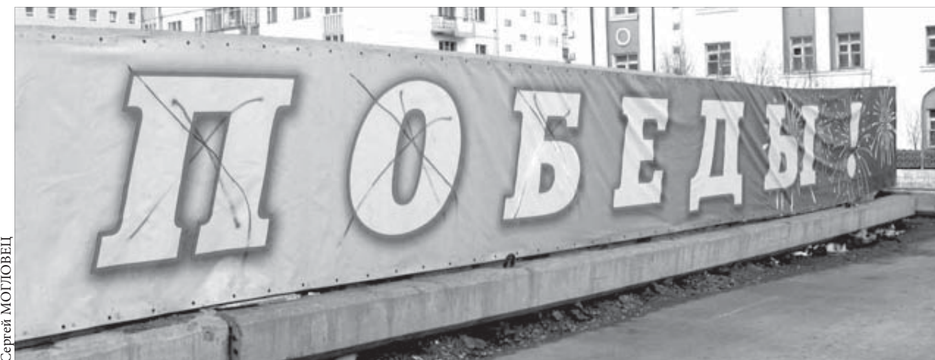
Замена баннера обойдется городской казне в крупную сумму

К Дню Победы улицы Норильска будут украшены и государственными флагами России. В связи с этим нелишне знать, что в УК РФ предусмотрена статья 329 «Надругательство над Государственными гербом и флагом». Она предусматривает ограничение свободы на срок до двух лет. Желание пошутить с символами государства может обернуться реальным тюремным сроком.