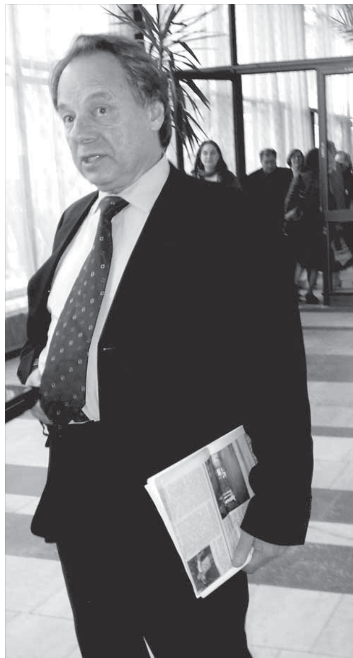
Олег Попцов: надо знать, что и где говорить

В интервью "Заполярному вестнику" Олег Попцов уверенно высказался за то, что диалог с властью возможен и необходим. "Гово-