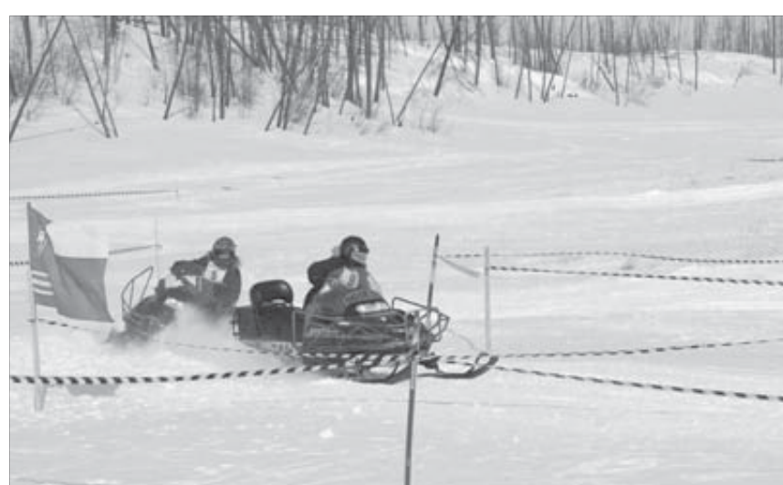
На трассе шла бескомпромиссная борьба