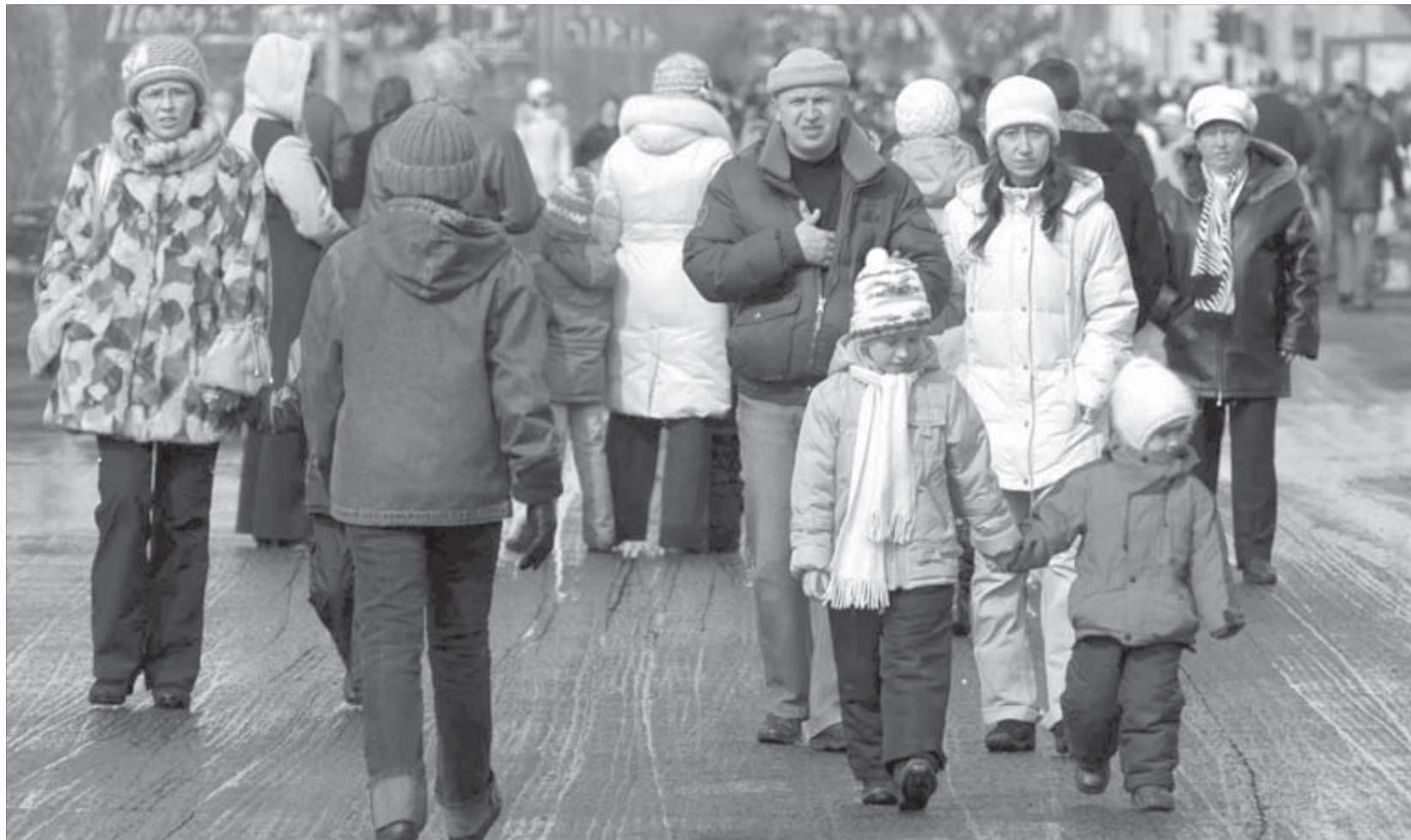
На Ленинский вышла добрая половина жителей города

Еще несколько минут демонстранты мирно беседовали на площади, сворачивая стяги под нетерпеливое ожидание сопровождавших колонну блюстителей порядка. Договорились встретиться еще раз в День Победы, 9 мая, напомним, что искать их группу следует, как водится, на левой стороне.