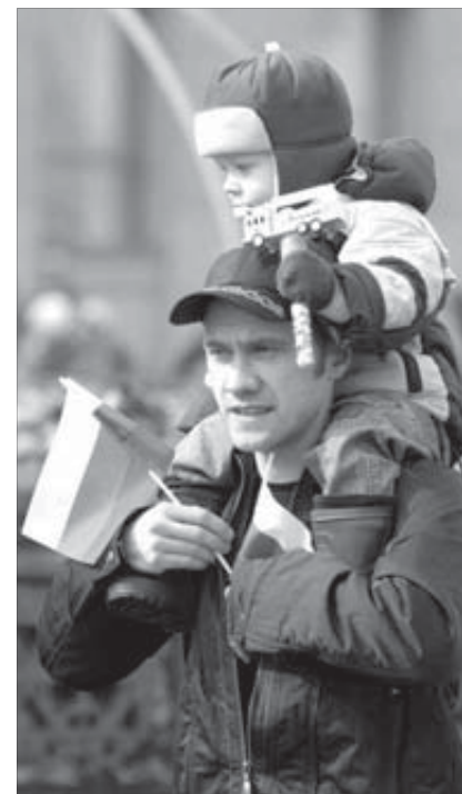
Юное поколение радовалось солнцу, теплу и празднику