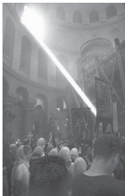
Этот огонь долетел до Норильска

Пусть скептики уверяют, что сходжение благодатного огня в храме Гроба Господнего можно объяснить простой химией и что причиной чуда в Иерусалиме являются самовозгорающиеся эфирные масла. Как известно, блажен лишь тот, кто верует, и именно ему тепло на свете. Вблизи благодатного огня - в особенности. Верующие НПП зажгли от православной святыни свои свечи и понесли свет благодатного огня дальше. К себе домой.