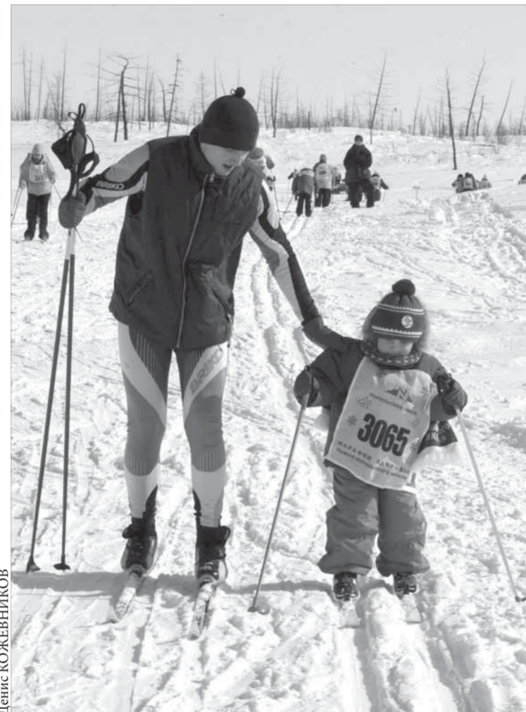
Первые шаги на лыжах

Организаторы соревнований подсчитали, что участники "Лыжни "Норильского никеля" – если сложить все результаты забегов – пробежали на лыжах вокруг Земли не один раз. В выходные лыжная база "Оль-Гуль" стала нашей планетой в миниатюре. Дворец культуры комбината подготовил увлекательную программу – "Путешествие вокруг света". На площадке перед базой – декорации китайских пагод с цветущими сакурами, африканских джунглей, американских прерий. Рostовые куклы и артисты в национальных костюмах разных стран дополняли иллюзию. Особенно веселилась детвора. А перед полевыми кухнями с гречневой кашей, развернувшихся рядом, выстроилась длинная очередь.