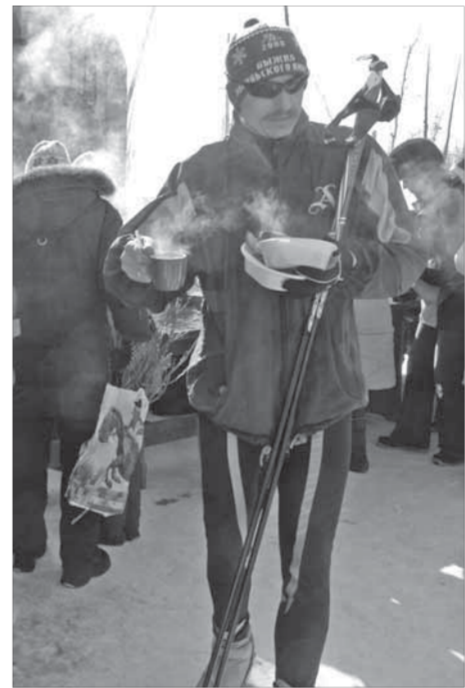
Отказаться от каши и чая – нереально...

– Я давно не видела столько ослепительно белого снега, – сказала чемпионка, – хотя сама я из Карелии, из города Кондопога. В европейской части России и за границей таких зим уже нет. У вас и лыжный сезон начинается в марте, когда на остальной территории страны уже спадают морозы. Поразила массовость и атмосфера праздника. Далеко не каждый город нашей страны может похвалиться проведением такого грандиозного, без преувеличения, спортивного мероприятия. В Карелии тоже проводятся лыжные праздники, но далеко не такого размаха. А столько лыж в прокате, как на "Оль-Гуле", я не видела ни в одном городе мира, правда! Хочу пожелать норильчанам здоровья! И еще – почаще вставайте на лыжи!