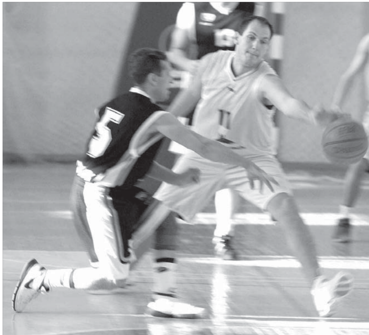
Настоящая мужская борьба на новом паркете