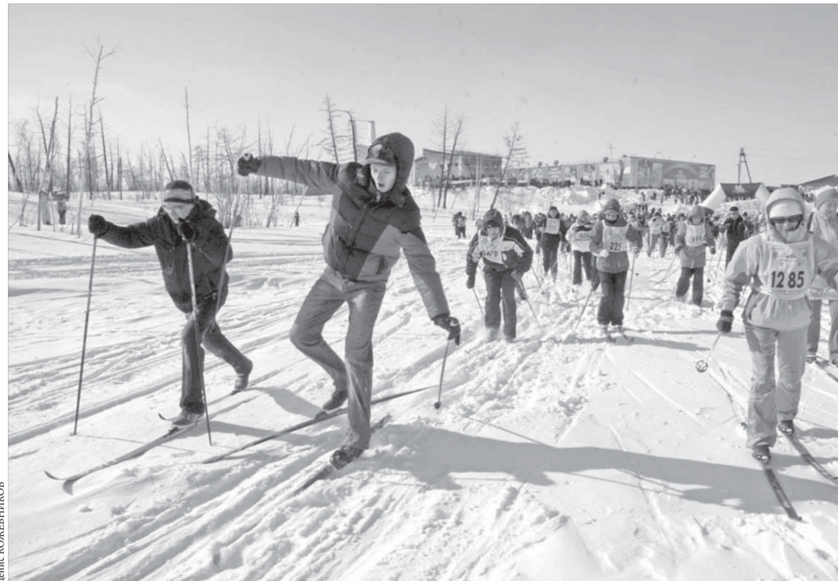
На “Лыжню “Норильского никеля”” вышли и любители, и профессионалы

Газета “Московский корреспондент” опубликовала 11 апреля заметку о жеманстве Путина на Кабаевой. В номере за пятницу, 18 апреля, редакция признала, что ни малейших оснований для публикации у нее не было, и принесла извинения всем, кого заметка затронула. Но газете это не помогло – “Московский корреспондент” прекратил свое существование, и даже сайт ее оказался вырублен с беспрецедентной в истории российских СМИ оперативностью.