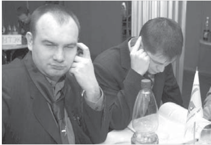
Вопросы по истории заставляют задуматься