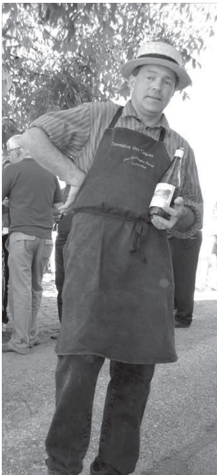
Соломенная шляпка – пропуск в Гурманию

Пройдя сквозь них, мы обнаруживаем накрытые столы и приветливых людей, которые угощают нас тонкими пирогами, похожими на пиццу. Мне объясняют, что пироги – специалитет