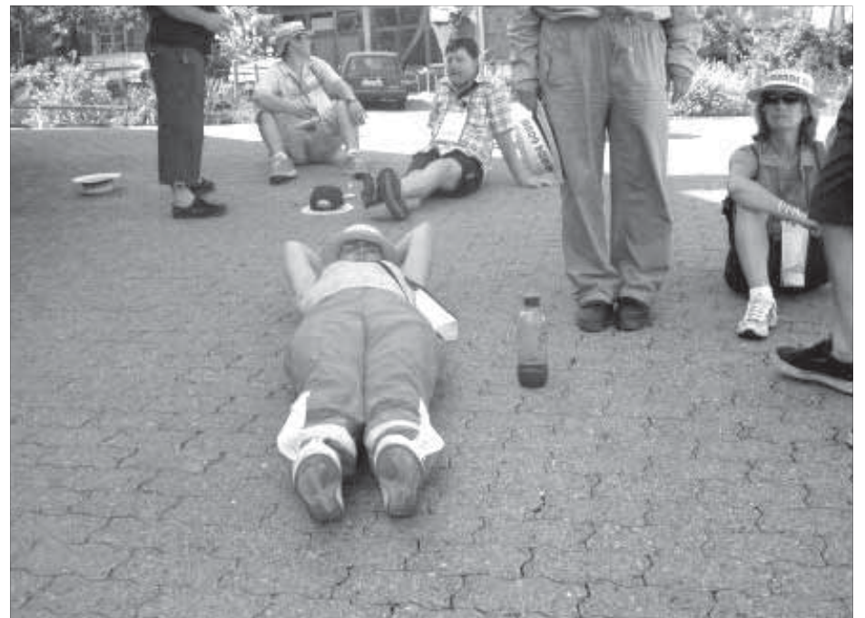
Тело мечтает о горизонтальном положении

Пьяных, ругающихся, недовольных не наблюдается. Все дружелюбно общаются, чему способствуют вся обстановка в целом и вино в частности. В голову приходит мысль, что на этом можно было бы и закончить. Тело, разморенное теплом, едой и вином, мечтает о горизонтальном положении. Но “Баллада гурмана” продолжается.