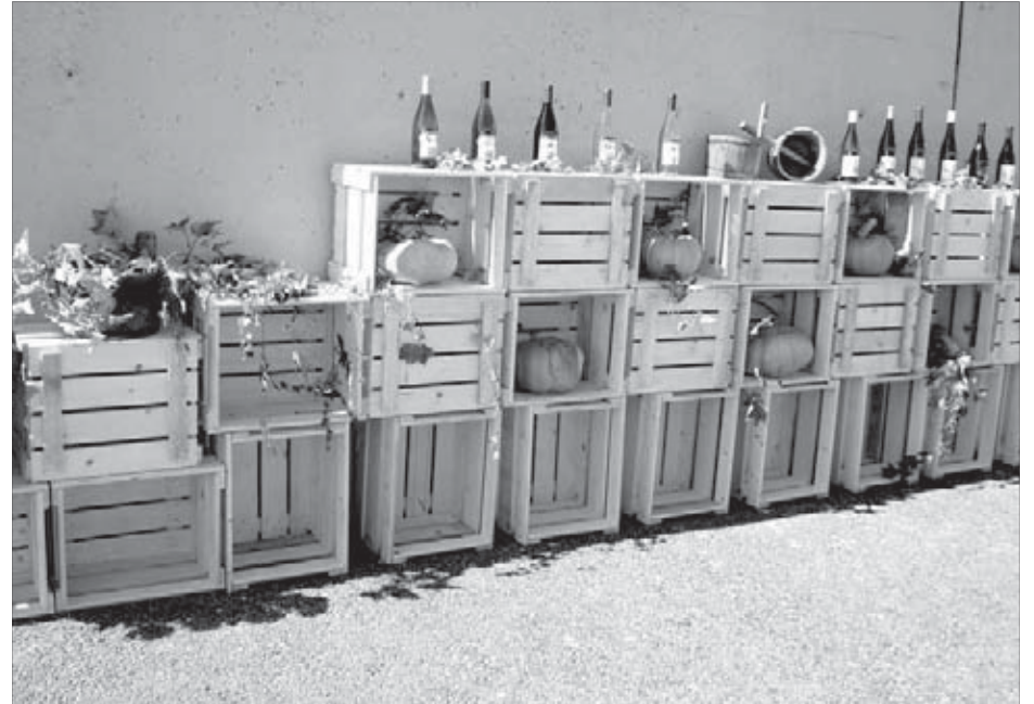
И снова дегустация вина

Теперь мы уже видим группу, идущую впереди нас, и группу за нами. В общей сложности за день по Гурмании проходит более тысячи человек. Когда одна группа отходит от пункта дегустации, а другая еще не подошла, организаторы и помощники быстро наводят порядок и подготавливают закуску для следующих едоков.