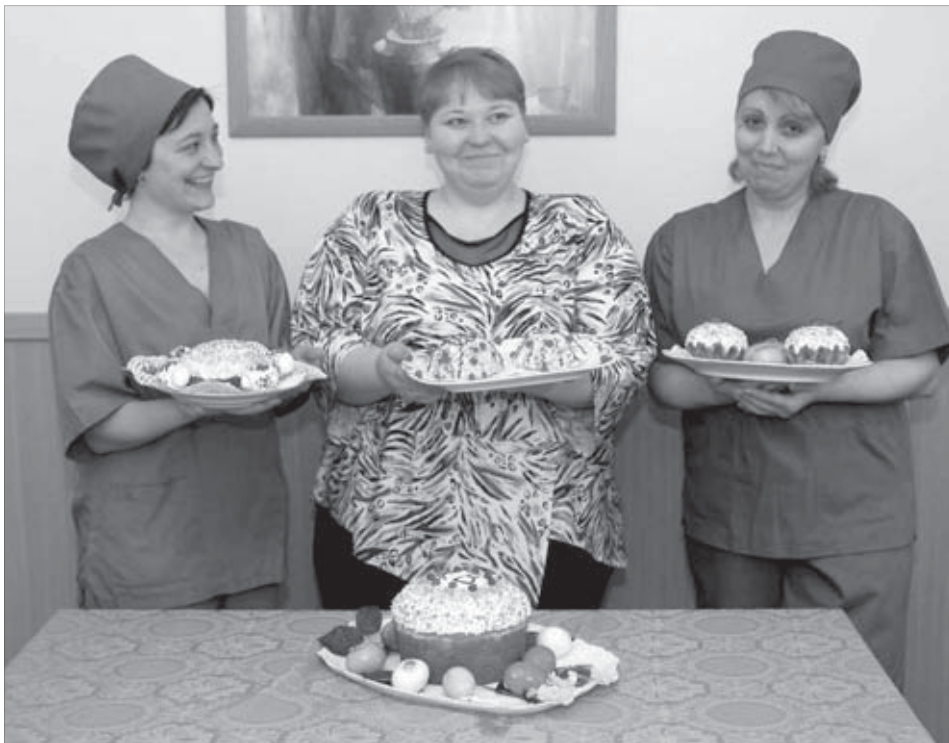
Повара и кондитеры столовой №3 к Пасхе готовы

В понедельник начинается Страстная неделя. Все ее дни называются Великими, с каждым связаны обычаи и приметы. В Великий четверг особое значение придается не только освященному огню, самой свече, но и четверговому хлебу как воспоминанию о преломлении хлеба на Тайной вечере. В четверг перед Пасхой на Руси всегда пекли куличи, красили яйца, варили кисель (обычно овсяный), выносили его в миске на улицу и кричали: "Мороз, мороз! Иди кисель есть! Не бей наш овес, нашу рожь, а бей быльник да крапивник!"