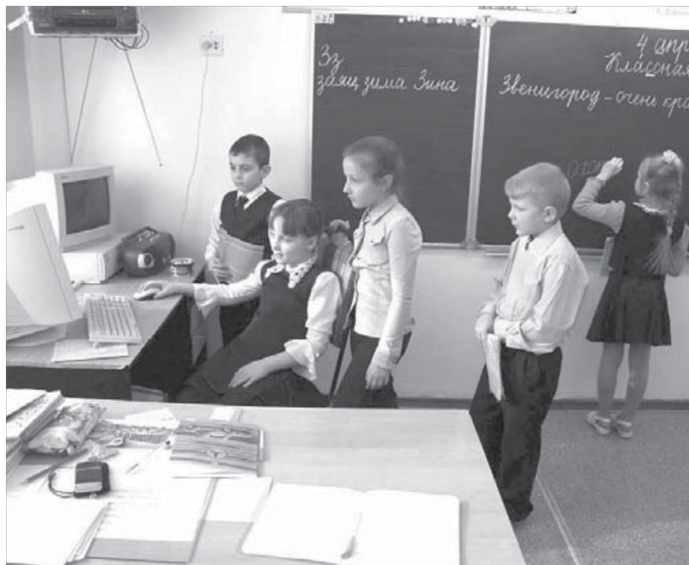
Учиться станет интереснее

Норильские педагоги отнеслись к этой идее без особого воодушевления. – Вы можете представить, какую работу надо проделывать педагогу, чтобы помимо проверки тетрадей, ведения журналов и прочего заносить информацию об оценках и поведении учеников еще и в компьютер? Причем ежедневно! – высказывают они свою точку зрения.