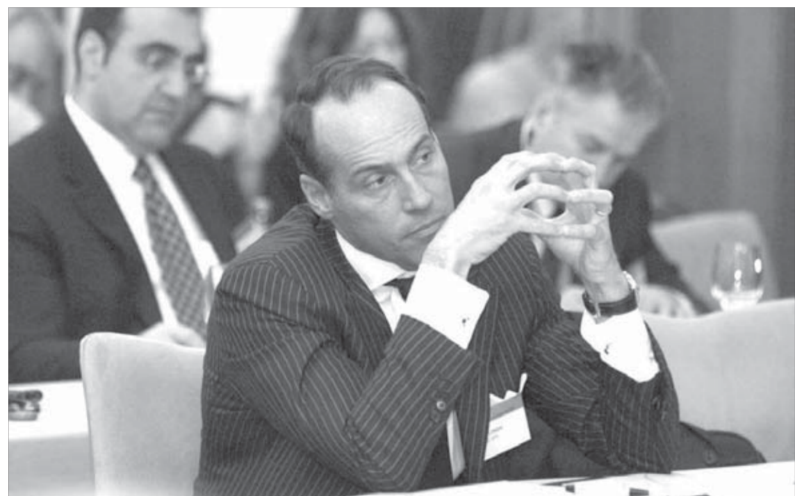
Делегаты собрались со всего мира

На улицах в эти дни увеличат число инспекторов дорожно-патрульной службы. Миллионеры проявят особую бдительность, но намеренно придираются ни к кому не будут, сообщили в ГИБДД.