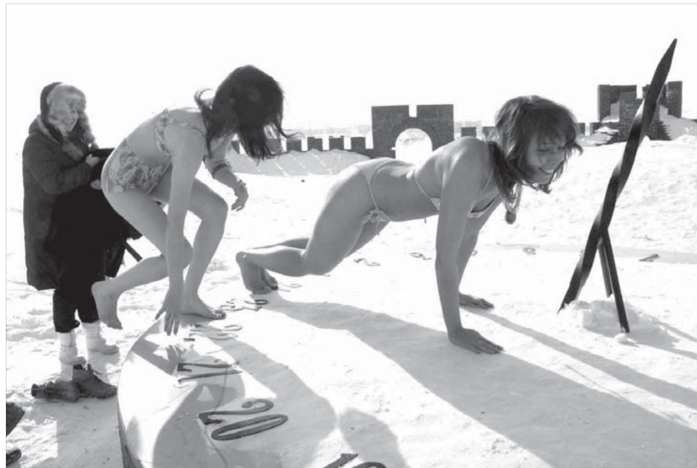
Самое теплое место на ледяных часах выбрать сложно