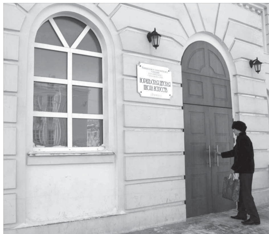
Возможно, мемориальная доска, выполненная Романом Кравчишиным и Виталием Курагиным, вернется на это здание