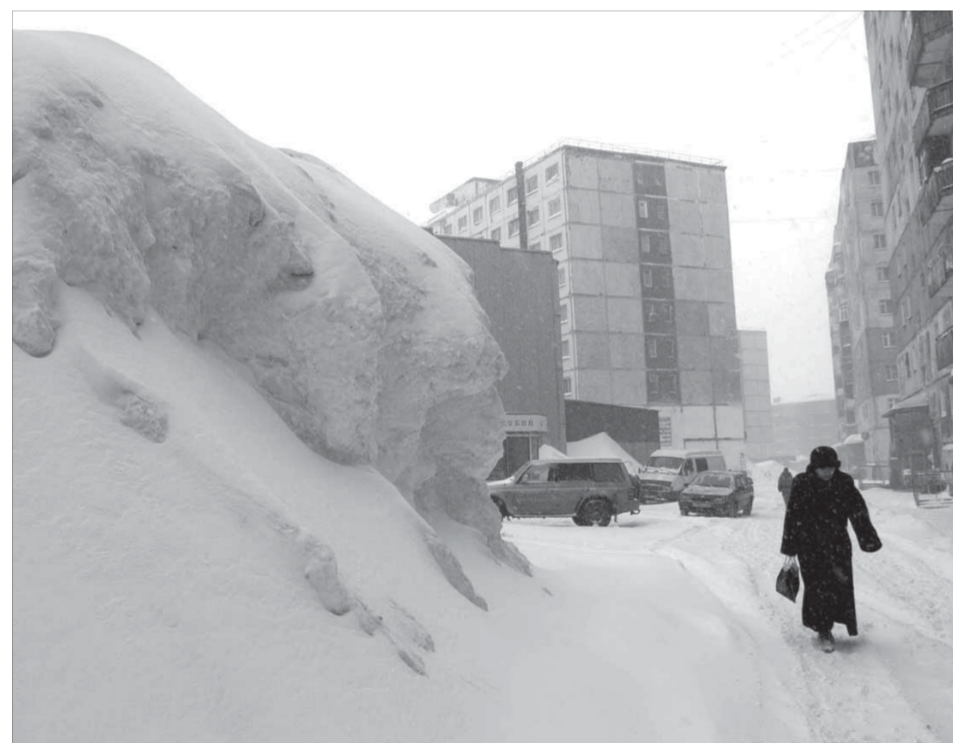
Вспру проводить чемпионат по ледолазанию...

Военный комиссар городов Норильск и Дудинка, Усть-Енисейского, Хатангского и Диксонского районов Красноярского края полковник О.Лобановский