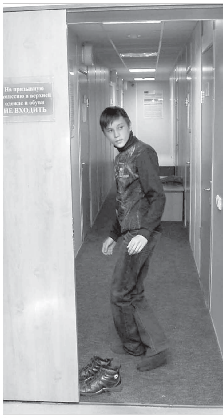
За этой дверью начало новой жизни – армейской

– Пока главная сложность – это несоответствие места регистрации призывников с фактическим местом проживания. Бывает нелегко найти призывника и вручить ему повестку. Но у нас налажено тесное взаимодействие с УВД, и, как правило, места проживания таких граждан мы все-таки выявляем.